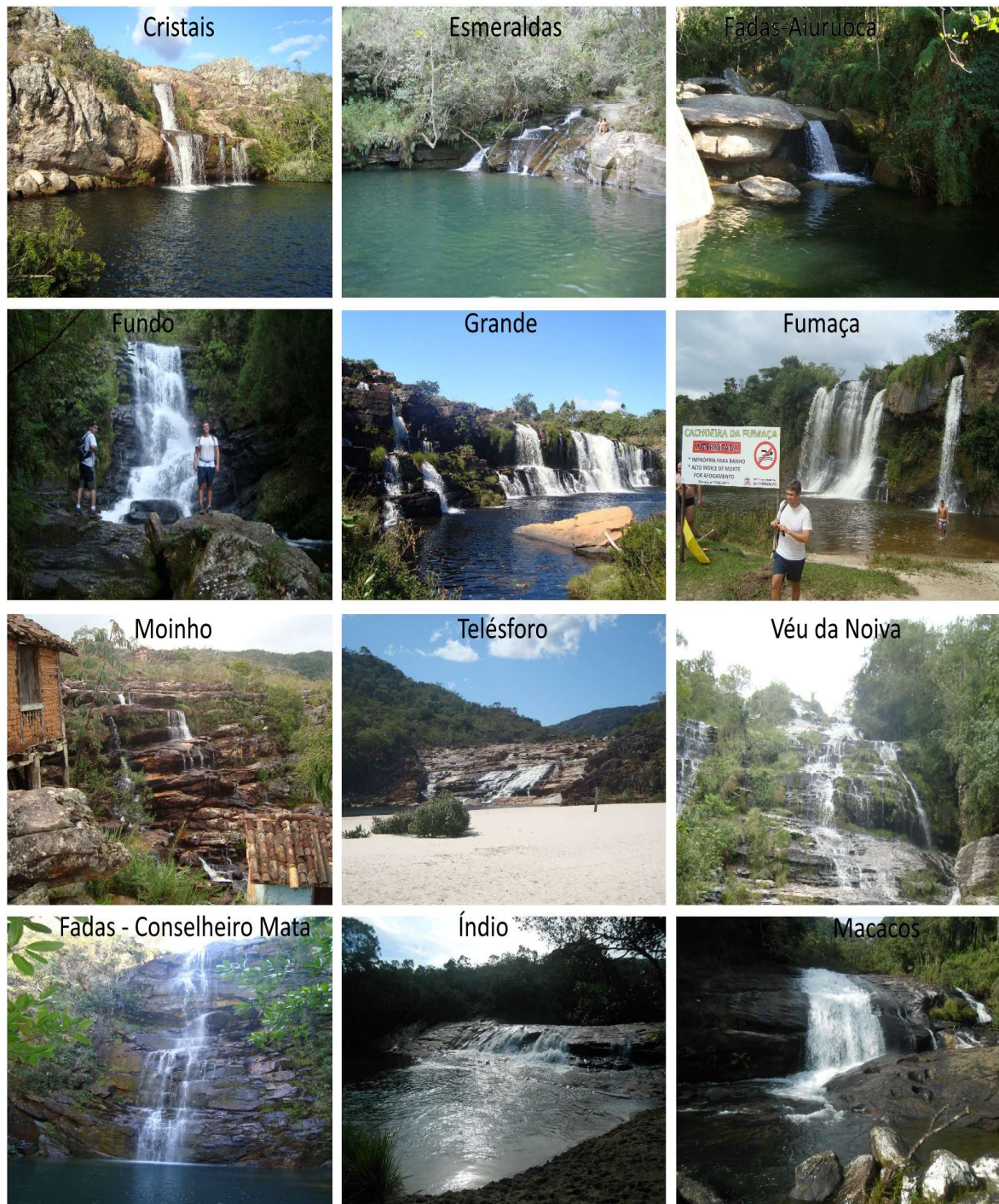
Figura 3 - Cachoeiras de Alta Relevância

A classe de alta relevância (Figura 3) abriga a maioria das quedas d'água, 12 (doze) ao todo. Esse número atesta que as cachoeiras visitadas, estão inseridas no grupo das principais quedas da Estrada Real. As cachoeiras pertencentes a essa classe, possuem boa preservação, importância cultural ou científica e