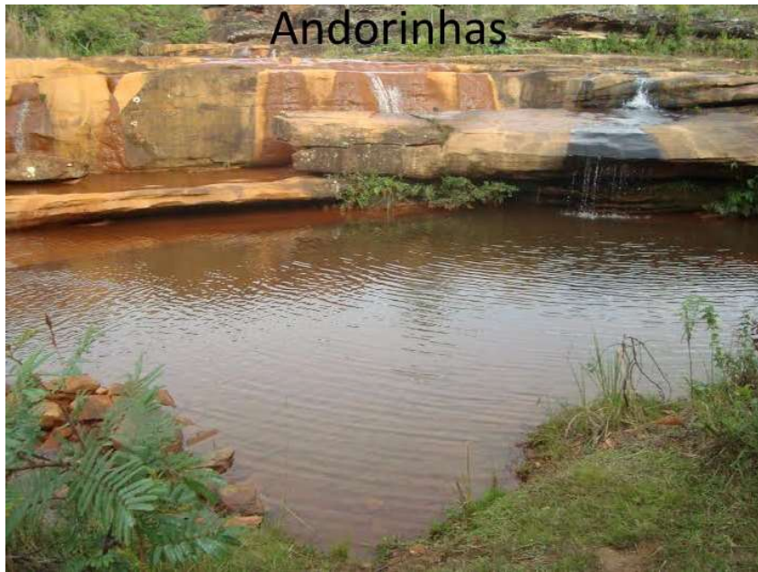
Figura 4 - Cachoeira de Média Relevância

Já a inexistência de cachoeiras enquadradas na classe de baixa relevância se justifica pelo fato que as quedas d'água selecionadas para a aplicação do protocolo foram apenas aquelas de incontestável reconhecimento e importância dentro da Estrada Real.