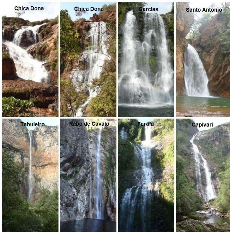
Figura 2 - Cachoeiras de Extrema Relevância