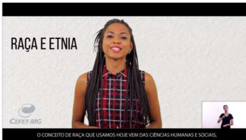
FIGURA 02 - Vídeo Institucional

o funcionamento das comissões em processos seletivos, além de expor de maneira nítida conceitos como: raça, etnia, fenótipos, autodeclaração étnico-racial, entre outros.