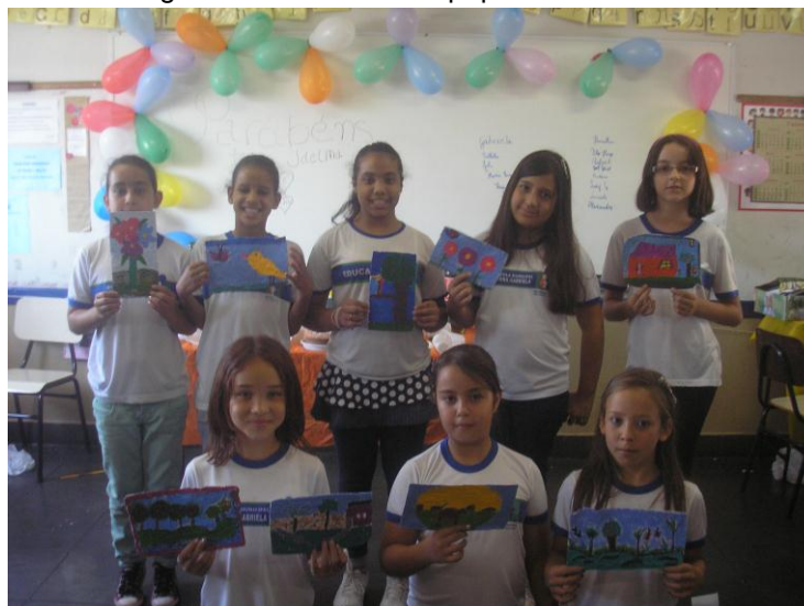
Figura 10 – Pinturas no papel reciclado

Depois de seco, os alunos realizaram pinturas variadas sobre o papel reciclado. O objetivo da atividade foi aprender a reciclar o papel e proteger o meio ambiente.