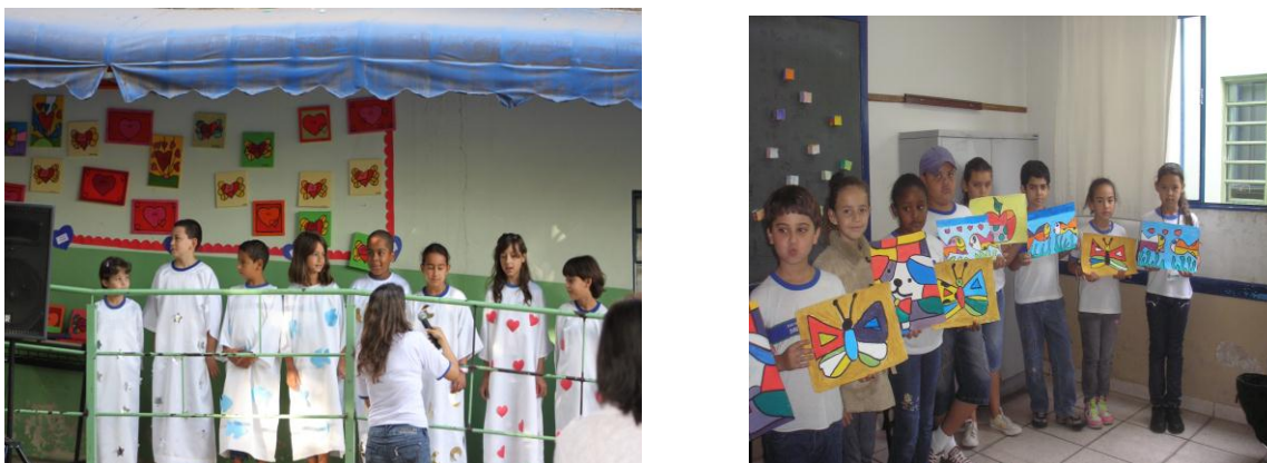
Figura 2 – Atividades sobre Romero Britto