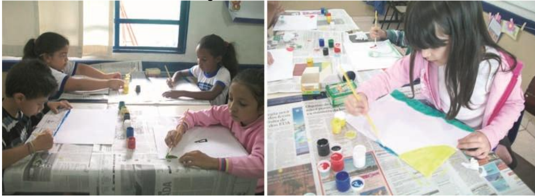
Figura 11 – Pintura livre

Em outra atividade proposta, os alunos do 1º ano praticaram a pintura livre, embalados por uma música bem tranquila escolhida pela professora. A intenção foi o aprofundamento de cada um no seu próprio universo e a transcrição para o papel sobre o que a emoção lhe propunha naquele momento.