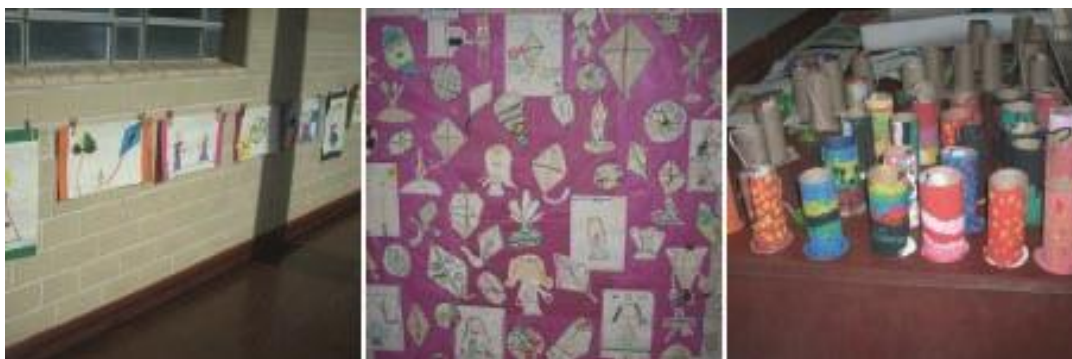
Figura 3 – Produção dos alunos do 1º e 2º ano