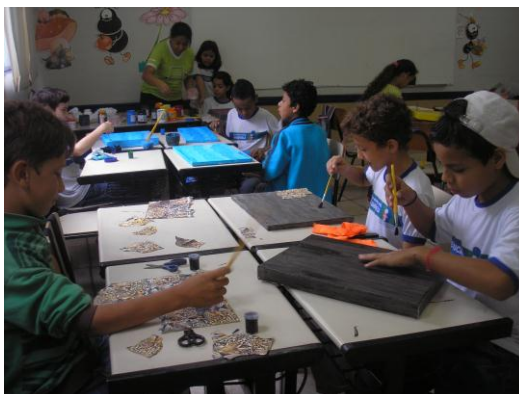
Figura 8 – Trabalho de decoupage

Outra atividade com os alunos do 4º ano da Escola pública envolveu a técnica decoupage . Eles trouxeram de casa telas, guardanapos com desenhos de diversas gravuras, bichos, flores, borboletas etc. As pinturas foram expostas na própria sala de aula.