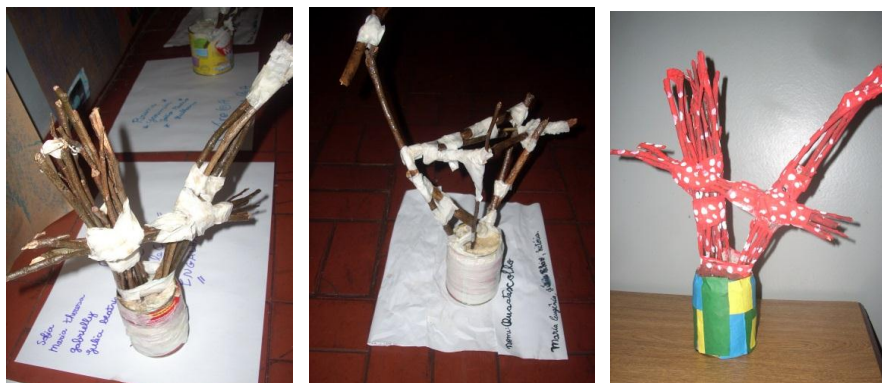
Figura 1 – Atividades sobre o meio ambiente