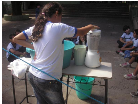
Figura 9 – Reciclagem de papel

Já o 5º ano desta mesma Escola realizou a preparação para reciclagem de papel. Ele foi triturado no liquidificador, colocado nas formas e depois levado ao sol para secar.