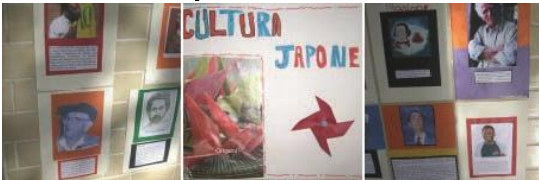
Figura 6 – Trabalho dos alunos do 5º ano

“Etnias e Cultura” foi o tema trabalhado pelos alunos do 5º ano. A partir da leitura e apreciação de imagens de vários artistas, as crianças puderam compreender como o povo brasileiro é o resultado da miscigenação de indígenas, africanos e europeus. As atividades propostas envolveram produção de painéis apresentando a diversidade cultural brasileira após estudo da obra e do artista Jonathas de Andrade. Além disso, foi feita uma pesquisa envolvendo personalidades mineiras, que contribuíram para o desenvolvimento da nossa cultura.