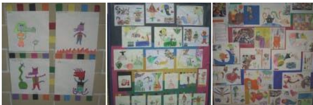
Figura 4 – Releituras dos alunos do 3º ano

Os alunos do 3º ano estudaram sobre “Lendas e Personagens” e conheceram o universo artístico do artista Fernando Chamarelli, povoado por uma mistura de imagens de civilizações antigas e cultura popular brasileira. As atividades propostas envolveram produção de desenhos, pinturas e releituras de obras de Fernando Chamarelli e Tarsila do Amaral.