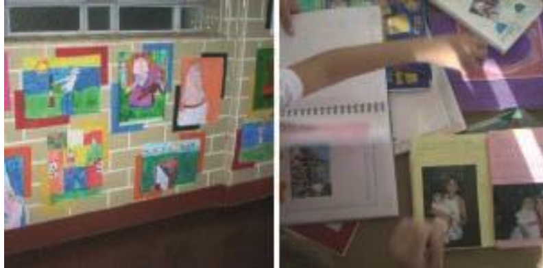
Figura 5 – Trabalho dos alunos do 4º ano

costumes da família e fizeram comparativos com os costumes de ontem e os costumes de hoje.