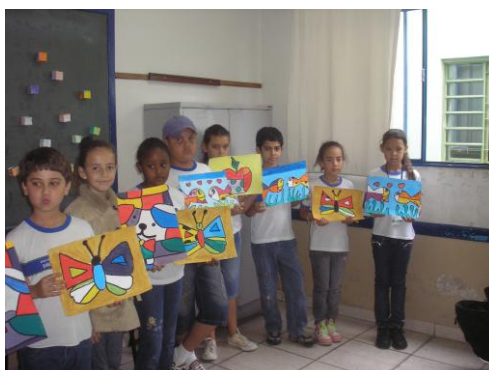
Figura 7 – Trabalho dos alunos do 4º ano da rede pública

Na Escola da rede pública uma atividade realizada pelos alunos do 4º ano propôs a apresentação e reprodução das obras de Romero Britto. Primeiramente eles conheceram as obras e a biografia do artista, foram em seguida questionados sobre as formas geométricas e cores fortes e alegres que o autor utiliza em suas obras. Depois os alunos fizeram releituras de algumas delas, e suas produções foram expostas no corredor da escola, juntamente com a biografia do artista.