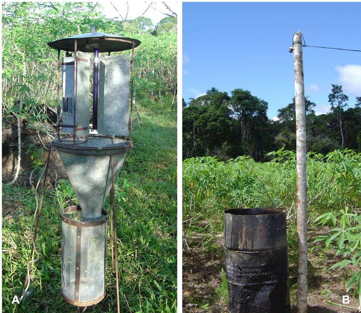
Figura 3. Armadilha luminosa modelo “Luiz de Queiroz” (A) e armadilha alternativa improvisada (B) utilizadas na captura de adultos de Erinnyis ello .