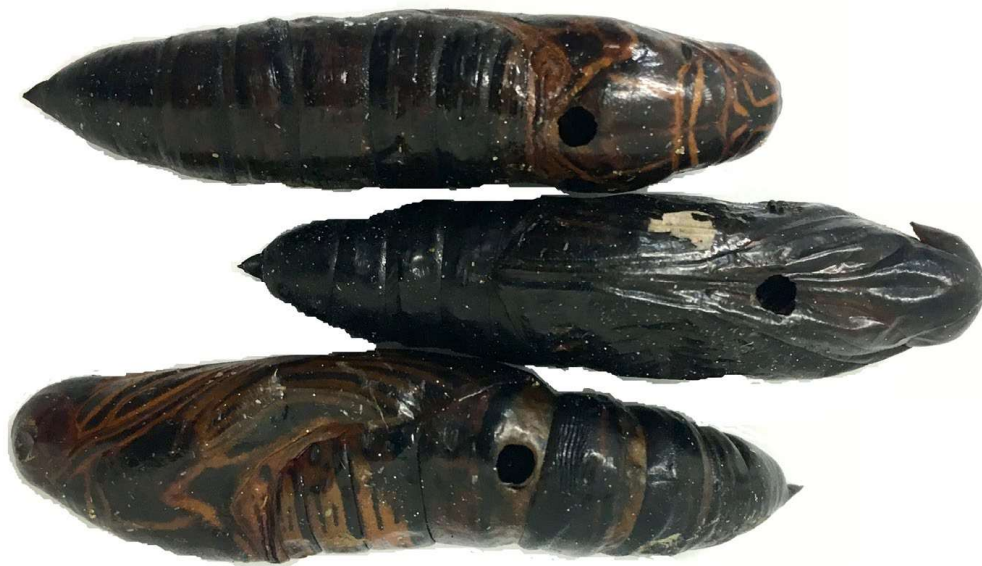
Figura 2. Pupas de Erynnis ello (Lepidoptera: Sphingidae) parasitadas por Brachymmeria annulata (Hymenoptera: Chalcididae).

grandes infestações (Winder, 1976). A maioria das espécies utilizadas por E. ello como hospedeiro são produtoras de látex, e, por isso, é possível que essas lagartas só consigam completar seu desenvolvimento em plantas com essa característica (Winder, 1976). O látex, provavelmente, atua na identificação do hospedeiro ou como estimulante alimentar. Depois de completado os cinco ínstaes, as lagartas descem ao solo e se escondem embaixo de restos vegetais (p.ex.: palhadas, troncos de árvores e arbustos), onde passam para a fase de pré-pupa. Não consomem alimento e apresentam pouca mobilidade durante essa fase e se transformam em pupa (Figura 2) em aproximadamente dois dias (Pratissoli et al., 2002)