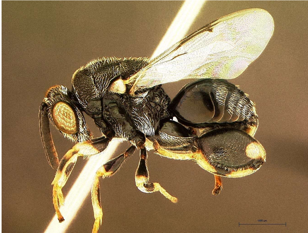
Figura 5. Adulto do parasitoide de pré-pupa Brachymeria annulata (Fabricius) (Hymenoptera: Chalcididae).

Moscas dos gêneros Belvosia , Chetogena , Drino , Euphorocera (Tachinidae) e Oxysarcodexia (Sarcophagidae), também são relatadas como parasitoides de E. ello (Winder, 1976; Schmitt, 1983; Gallo et al., 2002). As moscas de Belvosia depositam micro-ovos sobre as folhas, que são ingeridos pelas lagartas (Winder, 1976)