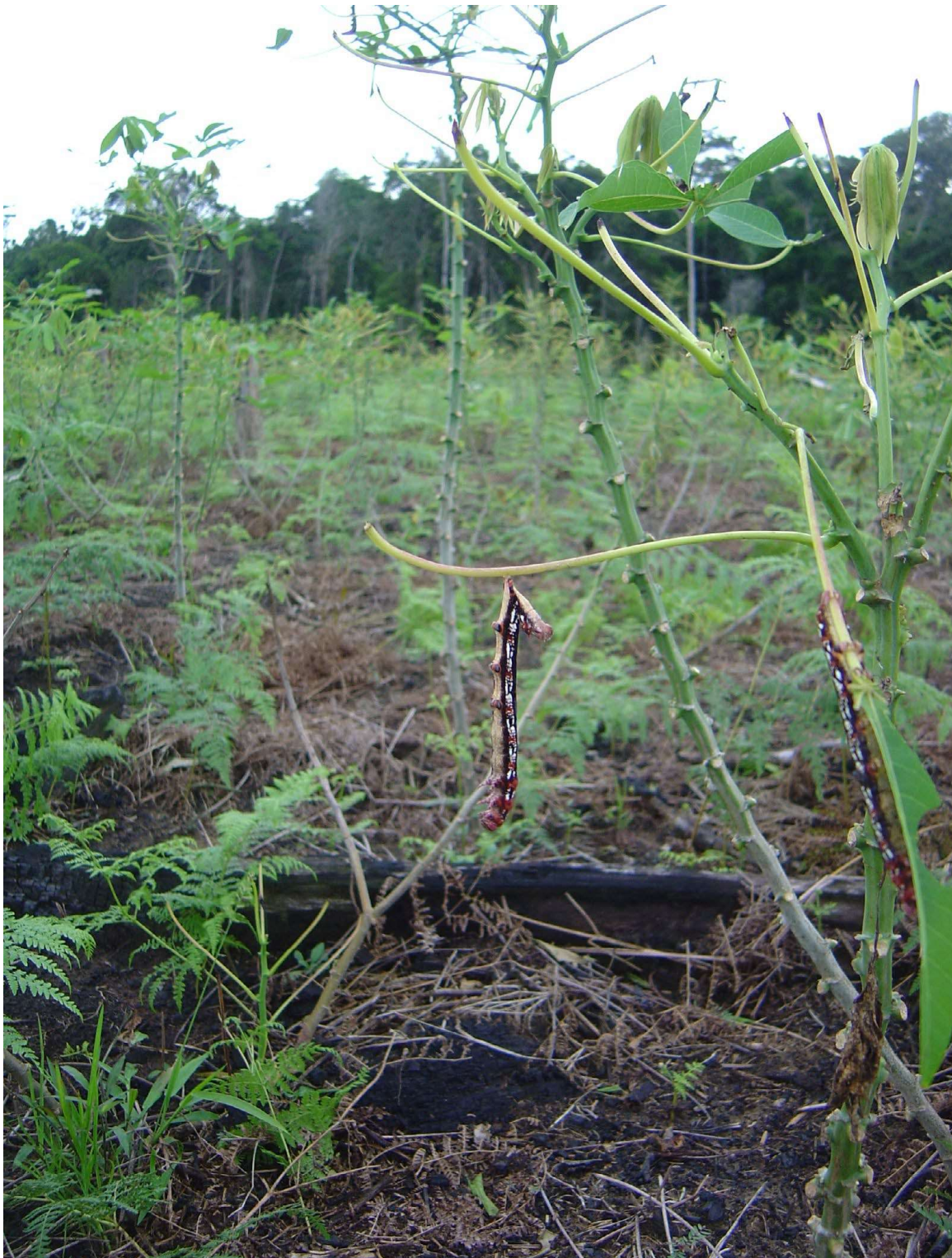
Figura 4. Lagarta de Erinyis ello (Lepidoptera: Sphingidae) morta com sintomas característicos de infecção por Baculovirus erinyis .

Apesar desse método de controle ainda não ter sido avaliado no cultivo da seringueira no Brasil, acredita-se que possa ter a mesma eficiência de controle.