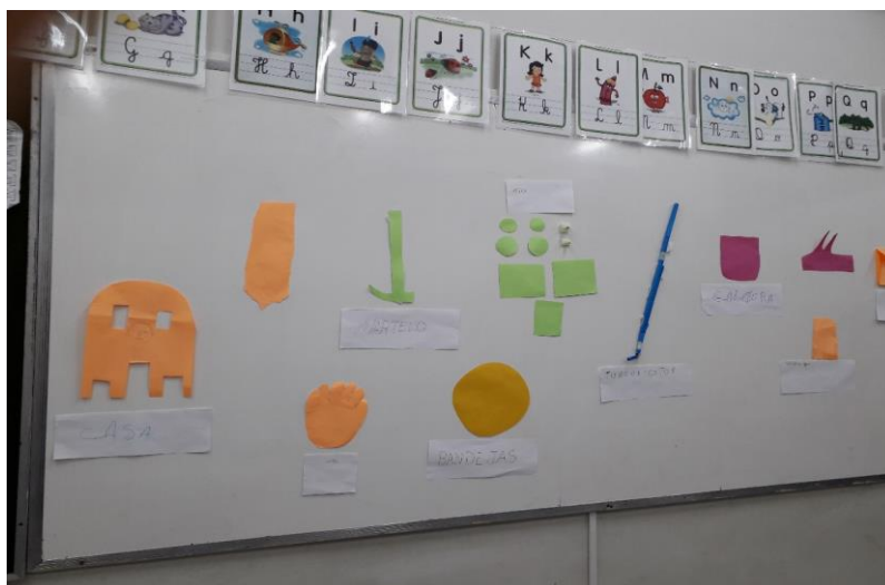
Figura 1 – Instrumento de trabalho significativo para os sujeitos