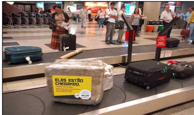
FIGURA 2 Disposição das esteiras