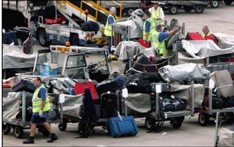
FIGURA 3 Transporte de bagagens aéreas

procedimentos de segurança. A FIG. 3 mostra uma situação de transporte de bagagens em uma conexão de voos.