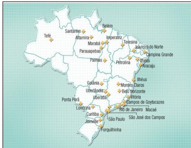
FIGURA 1 Localização dos principais aeroportos do Brasil