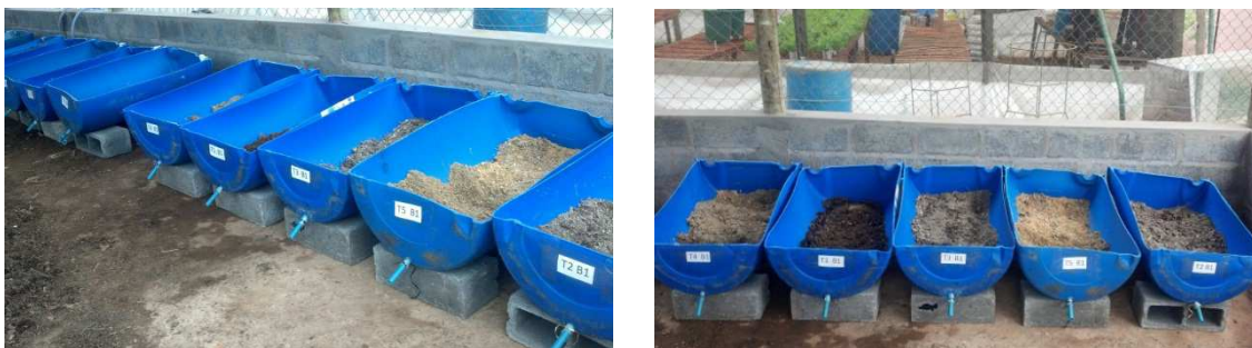
Figura 1 - Detalhes das parcelas experimentais.

Em cada unidade experimental foi adicionado 1 kg de minhocas vermelhas da Califórnia ( Eisenia foetida ). Os recipientes foram cobertos com sombrite, a fim de evitar a evaporação excessiva e o ressecamento do substrato, e de proteger as minhocas de predadores e impedir a sua fuga.