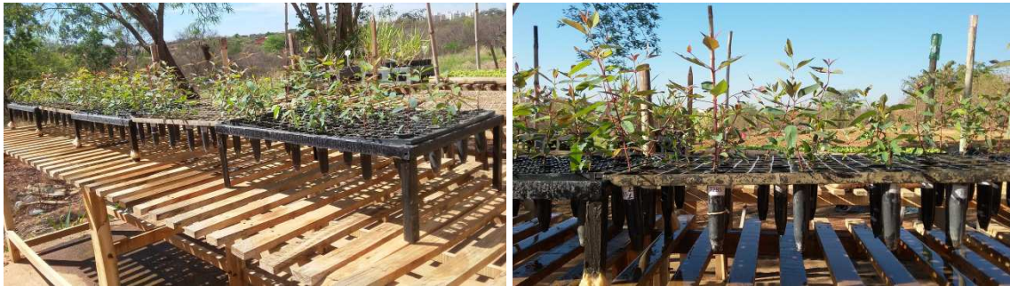
Figura 4 - Experimento montado de mudas de E. urophylla

essa solução a cada 10 dias, até a muda atingir o tamanho desejado (GONÇALVES, 1995).