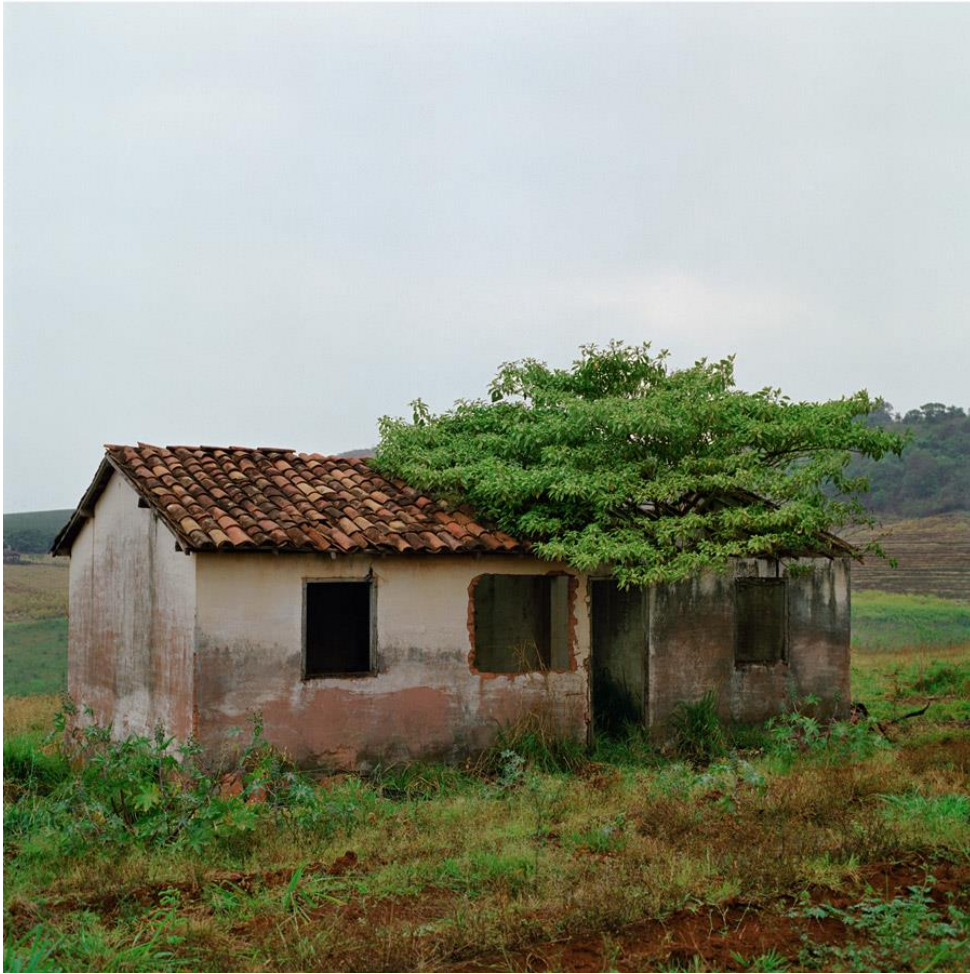
Imagem 1 – Pedro Motta - Reação Natural (#6)