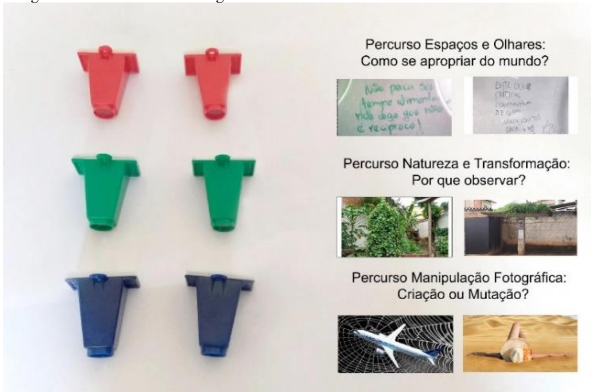
Imagem 4 - Monóculos com imagens autorais