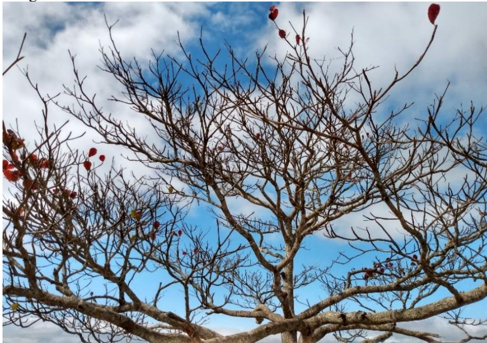
Imagem 6 – Milho Verde – Minas Gerais

É importante que o professor também faça do ato de fotografar uma prática, uma vez que é a partir dessas experiências é possível exemplificar técnicas e olhares, sobre um determinado espaço ou objeto.