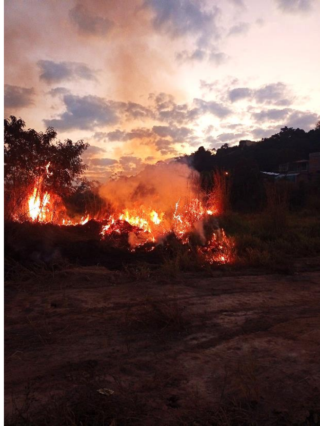
Imagem 5 - Ficha Mudança Imposta