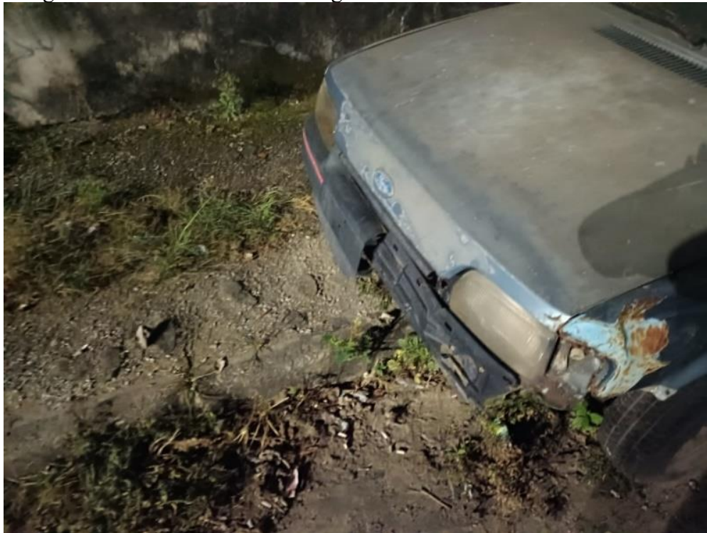
Imagem 3 - Ficha Caminho Investigado