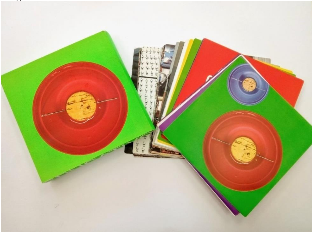
Imagem 5 – Material Educativo 29ª Bienal de São Paulo