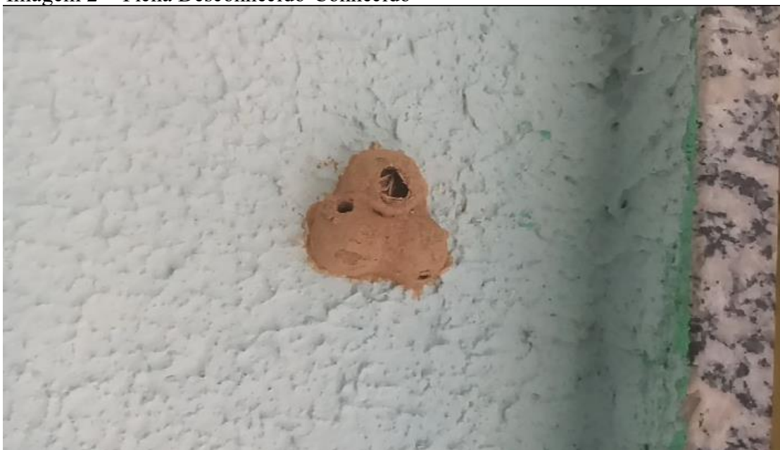
Imagem 2 - Ficha Desconhecido-Conhecido

Proponha-se a socialização e discussão coletiva das fotografias produzidas, promovendo uma reflexão sobre as escolhas criativas e as interpretações possíveis. Nesse processo, o diálogo entre produção individual e coletiva se torna essencial, pois o estudante aprende a respeitar sua autonomia criativa, ao mesmo tempo em que compartilha experiências com seus colegas. Esse movimento de partilha fortalece a dimensão colaborativa da aprendizagem em arte, permitindo que cada estudante amplie seu repertório a partir do contato com diferentes perspectivas. O confronto entre olhares diversos estimula a construção de sentidos múltiplos sobre a realidade registrada, transformando a fotografia em um espaço de diálogo e não apenas de expressão individual.