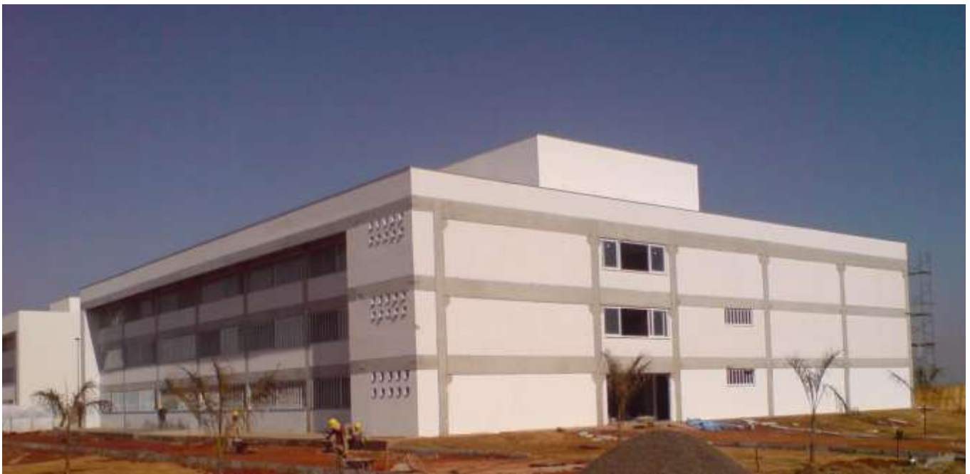
FIGURA 19: Prédio UEMG Frutal Bloco B.