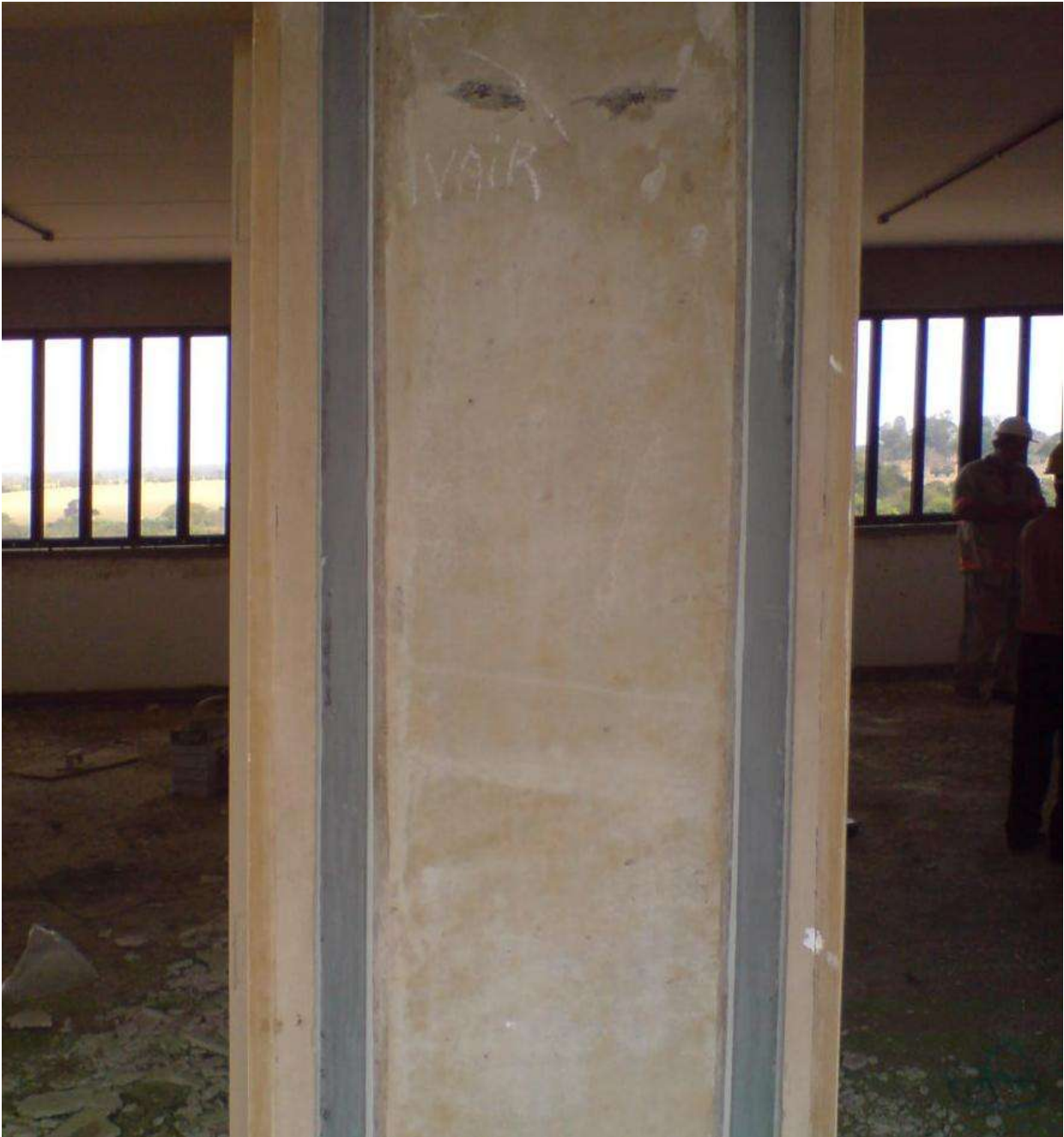
FIGURA 12: Juntas do perfil com a alvenaria e estrutura de concreto preenchidas com poliuretano.