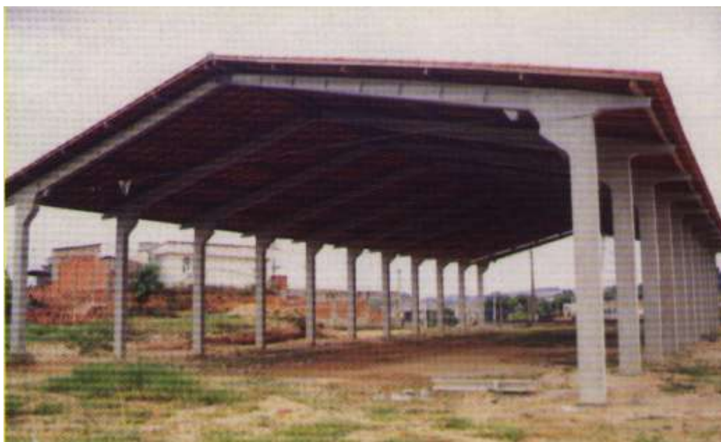
FIGURA 1: Sistema estrutural de pórticos para telhado de duas águas.

fabricantes que já produzem elementos leves, como elementos pré-fabricados para lajes de forro e piso. Dada a grande responsabilidade que se passa a assumir em estruturas que podem atingir até 30 m de vão, há necessidade de uma definição mais clara dos métodos de análise estrutural e o esclarecimento dos fabricantes e usuários sobre os cuidados imprescindíveis a serem tomados no projeto, na execução, no uso e na manutenção dessas construções.