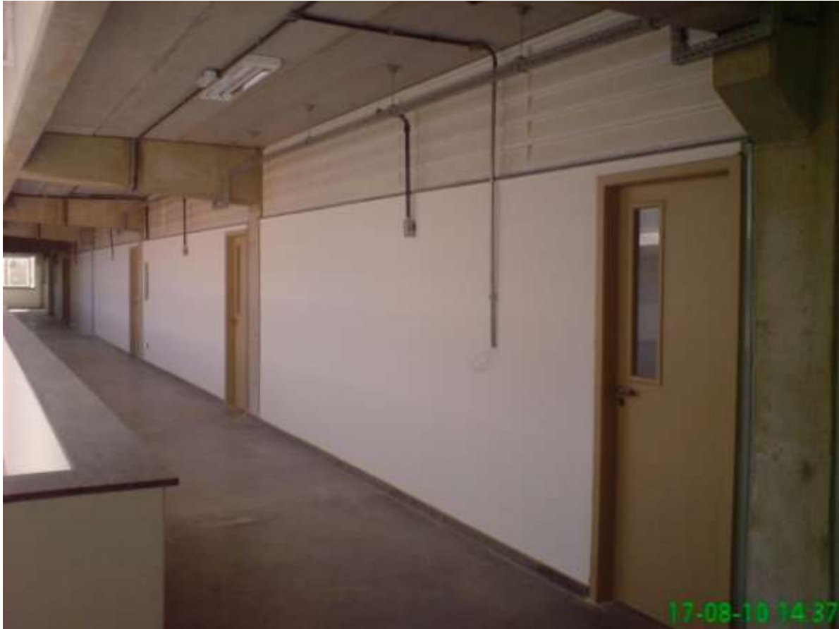
FIGURA 18: Prédio UEMG Frutal Bloco B, Corredor externo.