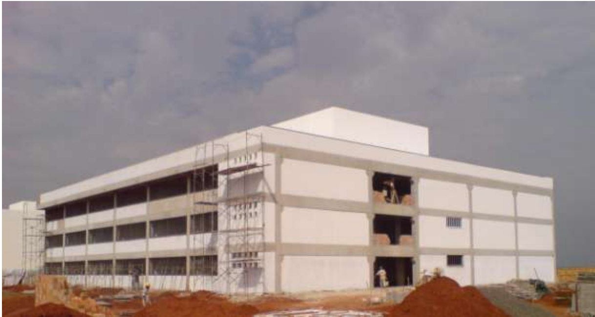
FIGURA 17: Prédio UEMG Frutal Bloco B, acabamento externo.