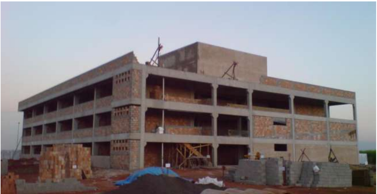
FIGURA 16: Prédio UEMG Frutal Bloco B, execução painéis de alvenaria.