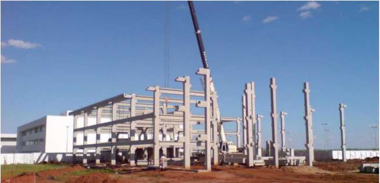
FIGURA 15: Prédio UEMG Frutal Bloco B, montagem estrutura pré moldada.