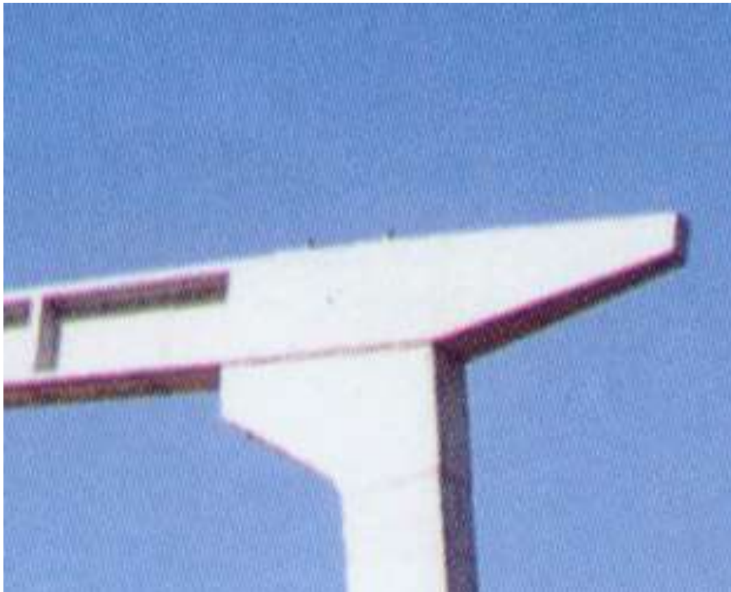
FIGURA 2: Ligação viga-pilar executada através de consolo e chumbador.

Muitos trabalhos relacionados à rigidez parcial das ligações entre elementos pré-moldados de concreto foram e estão sendo desenvolvidos no exterior. No Brasil, contudo, esta linha de pesquisa ainda está em fase inicial. Wilson e Moore, que em 1917 realizaram testes para determinar a rigidez de ligações viga-pilar rebitadas em estruturas metálicas, são considerados os pioneiros no estudo das ligações semi-rígidas. No âmbito das estruturas pré-moldadas de concreto cita-se, como precursor, o programa de pesquisa experimental em ligações de estruturas pré-moldadas de concreto realizado na década de 60 pela Portland Cement Association (PCA). Depois dele outros estudos foram realizados. Dentre eles convém mencionar o projeto PCISFRAD (Specially Funded Research and Development), fundado em 1986 com um programa de pesquisa intitulado “ Moment Resistant Connections and Simple Connections ”. Em 1990 a indústria de pré-moldados da França (French Precast Concrete Industry) iniciou um programa de pesquisa intitulado: “ Investigation of the