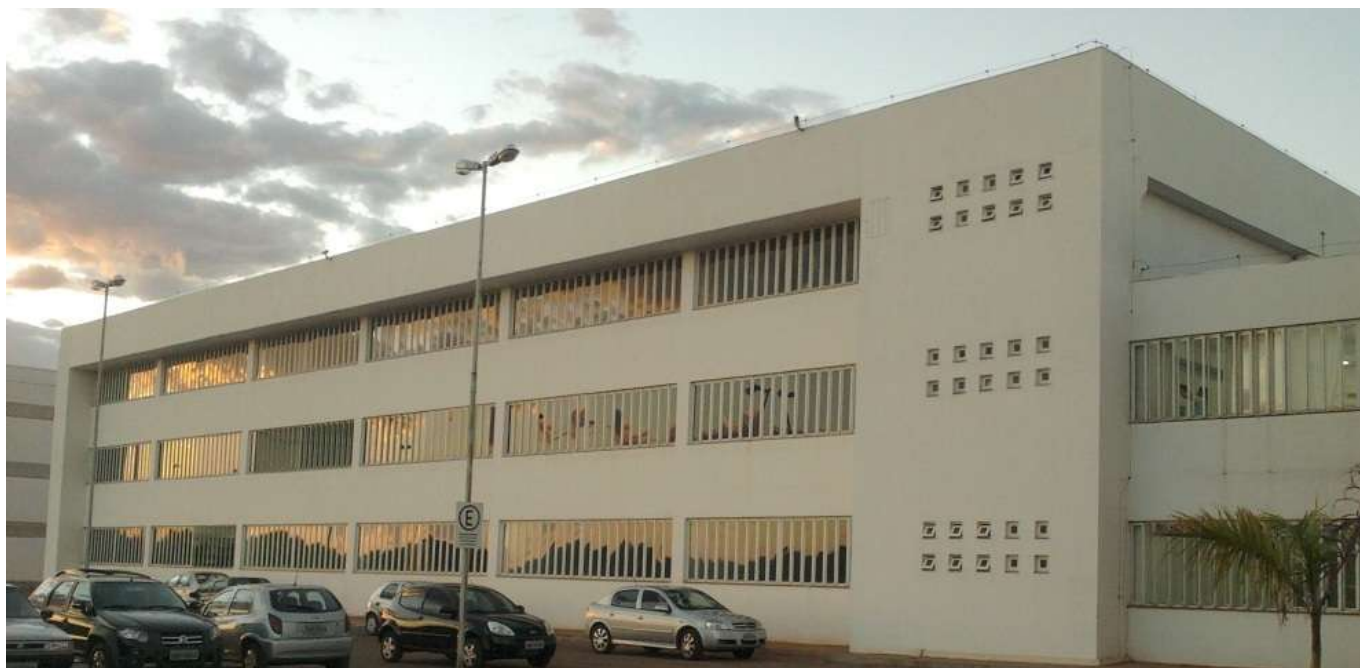
FIGURA 4: Prédio UEMG Frutal Bloco A.

Estrutura de concreto armado pré moldado e alvenaria de vedação engastada a estrutura através de barras de aço horizontais afixadas na estrutura em concreto armado, através de adesivo epóxi, e na junta horizontal do bloco cerâmico através da argamassa de assentamento, revestimento argamassado contínuo na alvenaria e estrutura de concreto pré moldado.