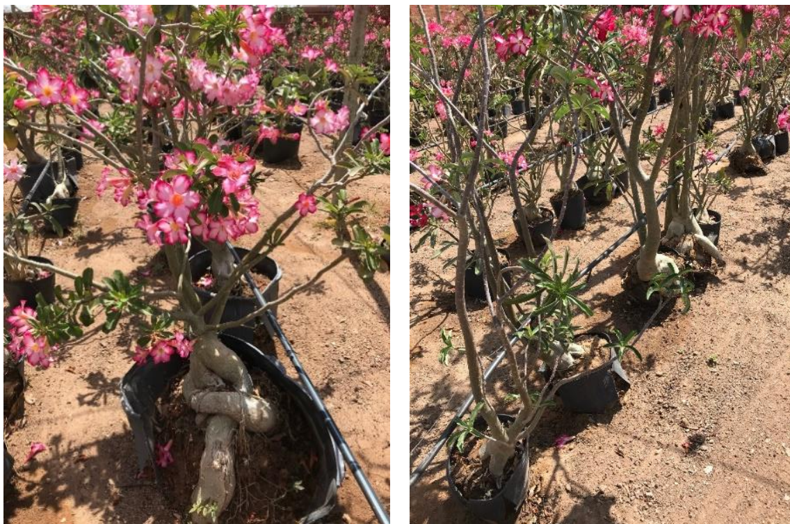
Figura 4 – Sistema de irrigação.

A qualidade da água de irrigação é outro ponto que necessita de atenção. O pH desequilibrado desfavorece o bom desenvolvimento das plantas e pode causar o apodrecimento de suas raízes. O ideal seria o pH próximo a 7. Recomenda-se que o manejo de irrigação deva ser realizado de forma planejada, consciente, e especialmente evitando desperdícios, para um sistema produtivo cada vez mais eficiente.