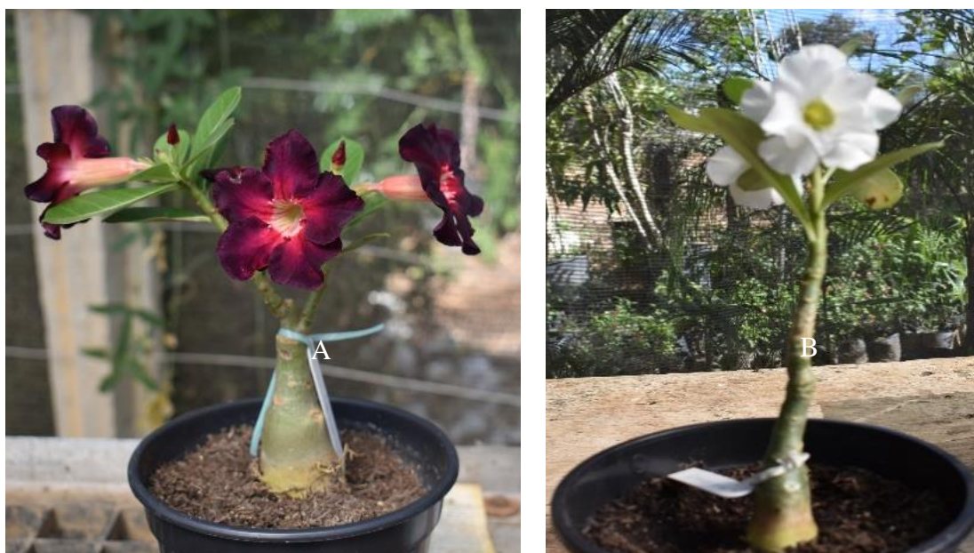
Figura 6 – Adenium obesum submetida à poda e com formação de três ramos (A); não submetida à poda e com apenas um ramo (B).

Na poda de condução, devem ser feitos cortes em apical em todos os ramos da planta, deixando, no mínimo, 05 cm de comprimento, e sempre observando os locais onde estão as gemas. Aconselha-se a colocar canela em pó no local do corte. Após cerca de duas semanas, as plantas já apresentam emissão de novos ramos (FIGURA 6). As respostas ao estímulo são muito influenciadas pelas condições climáticas, sendo, por isto, indicado realizar essa poda em temperaturas acima de 18° C.