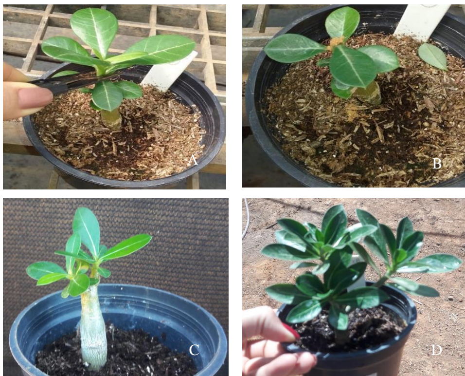
Figura 5- Etapas de poda de formação de Rosa-do-Deserto. (A- Corte apical; B- Após a poda com a aplicação de canela em pó; C- Planta com três semanas após a feita a poda e D- Planta com 60 dias após a poda).

Cerca de 02 semanas após a poda, as plantas já apresentam emissão de novos ramos (FIGURA 4). As respostas ao estímulo são bastante influenciadas pelas condições climáticas, por isso, pesquisas regionais são necessárias. De acordo com estudos preliminares, a poda feita na época de altas temperaturas estimula a rápida brotação e o desenvolvimento, mas, em temperaturas abaixo de 18 °C, muitas plantas interrompem seu desenvolvimento, podendo advir a mortalidade.