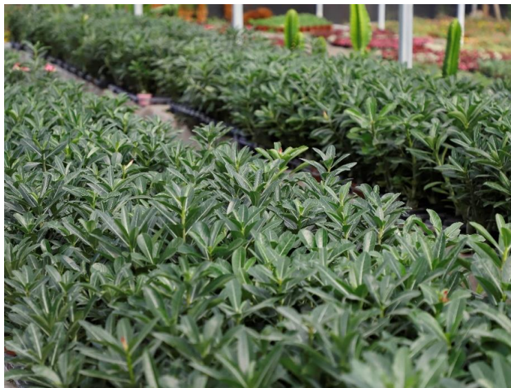
Figura 2 – Cultivo comercial de Rosa-do-Deserto com plantas bem nutridas.