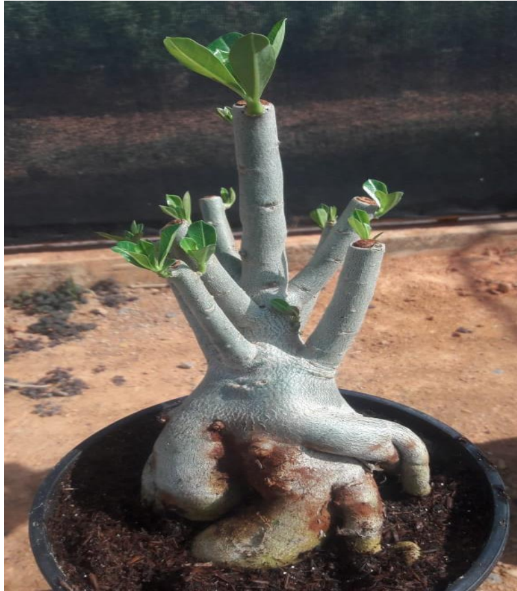
Figura 7 – Adenium obesum submetida à poda na parte aérea e nas raízes.

camada de pedrisco no fundo do vaso e uma de substrato, de forma que o caudex da planta fique acima da borda, e o substrato acrescentado a essa estrutura cuidadosamente retirada. Quando o caudex aparecer totalmente, com o auxílio de uma tesoura ou estilete, devem ser removidas as raízes indesejáveis. Também, após o corte, deve-se colocar canela em pó no local do corte.