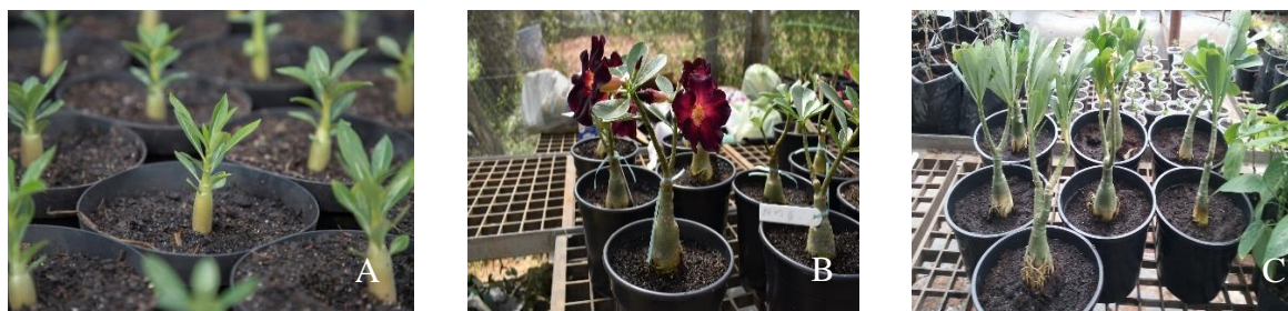
Figura 3 – Características das plantas no primeiro (A), segundo, (B) e terceiro (C) período.