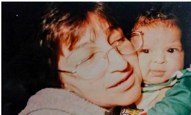
Imagem 10: Eu bebê.

As reflexões, aqui, tecidas são fruto de uma proposta de escrita narrativa que ocorreu em um dos encontros da disciplina eletiva “Documentação Narrativa de Experiências Pedagógicas”. A proposta era criar uma narrativa sobre alguma experiência marcante da nossa infância, relacionada a alguma fotografia ou objeto. Pode parecer uma tarefa fácil de se fazer, mas preciso declarar o meu incômodo com a proposta, que, em si, não tem nada de errada, mas, de encontro com a minha pessoa, gerou uma série de tremeliques e tornou essa tarefa mais desafiadora do que eu esperava. Por sorte, me lembrei da fala de um professor de física, saudoso mestre Dani, que, ao notar, nas nossas expressões faciais, tais tremeliques, frente aos problemas apresentados, logo soltava: "Começemos por partes!". Então, vamos lá!