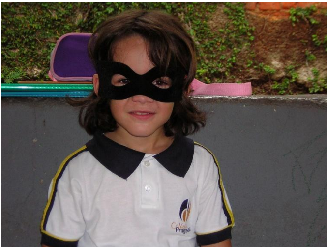
Imagem 9: Fantasia.

Nunca fui um grande entusiasta de fantasias. Elas me despertam sentimentos de preguiça (pensar um tema e planejar todo o disfarce) por causa das festas. Festas à fantasia são sempre ambientes desconfortáveis. Quando criança tinha meus heróis favoritos e, é claro, que eles eram as principais referências para o tão esperado dia da fantasia no colégio. Nos fantasiar, no ambiente escolar, era quase como um episódio comemorativo de qualquer série de televisão que nos vem à cabeça.