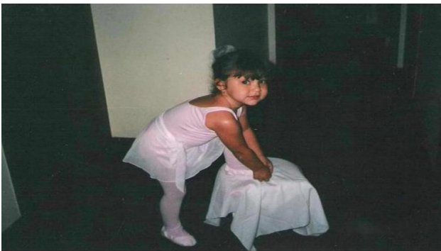
Imagem 4: Menina-artista.

Eu não sou boa em me lembrar do ano em que minhas memórias da infância aconteceram ou quantos anos eu tinha em cada uma delas. A verdade é que minhas memórias de infância não são muito claras, no geral, mas são boas. Muitas vezes, vejo uma fotografia, mas não me lembro do instante em que ela foi tirada, mas essas, em específico, por algum motivo, eu me recordo exatamente do momento.