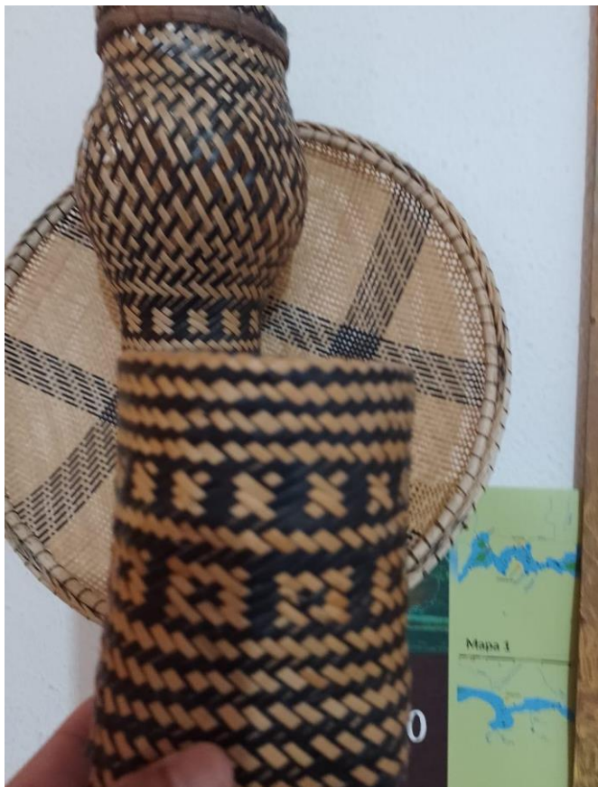
Imagem 3: Urutu, cesta confeccionada com fibras de Arumã.

Eu me lembro de como era a vida na minha comunidade, como se fosse hoje. Até então, logo após voltar da aula, estive comentando com a minha colega que, a essa hora, a minha mãe deveria estar voltando da roça, e meu pai, da escola, na qual ele trabalha. É uma saudade a qual me faz lembrar dos momentos em