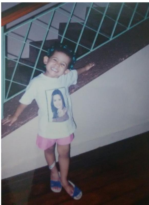
Imagem 1: Uma menina e uma casa.

Construções costumam dizer algo sobre alguém ou sobre histórias. (Evelise Diandra da Silva)