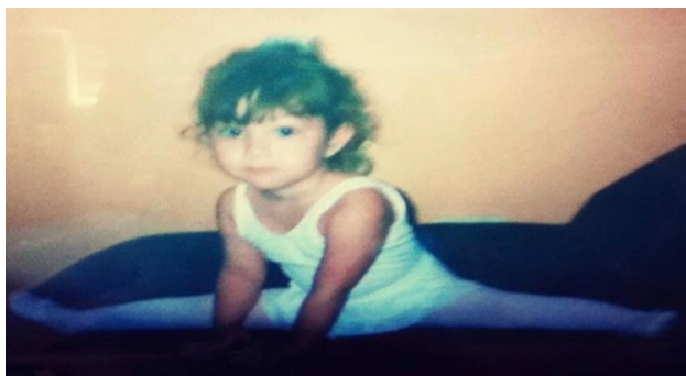
Imagem 5: A bailarina 1.

Eu gostava de colocar a roupinha de ballet e ficar dançando pela casa o clássico "essa menina tão pequenina quer ser bailarina", de Cecília Meirelles, imaginando que estava em um palco, que era a primeira bailarina, muito famosa, muito bonita, que encantava a plateia com meus movimentos leves e graciosos. Provavelmente, só ficava pulando igual a uma cabrita pela casa! Naquele dia, o sofá e o banquinho eram meus objetos de cena, eu os usava como parte das minhas complexas coreografias: subia, fazia pose, pulava, qualquer coisa, menos o jeito tradicional de se usar um sofá. No meio da apresentação, minha tia Maria, a quem eu carinhosamente chamo, até hoje, de "titia", chegou na sala, o que significava mais plateia, então, claro, que não interrompi o ato, afinal, o show tem que continuar.