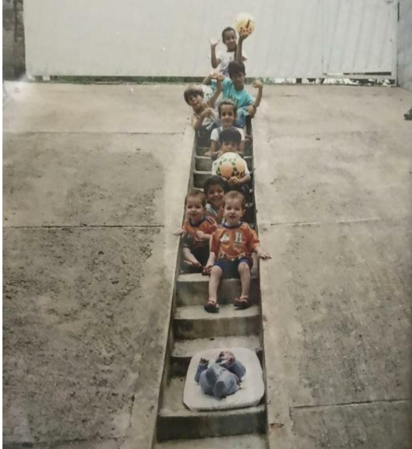
Imagem 2: Irmãos.