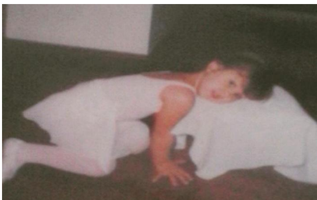
Imagem 7: A bailarina 3.

Imagino que minha tia tenha achado a cena digna de ser lembrada, pois pegou sua máquina e fotografou várias das minhas poses, que, na minha cabeça, eram elaboradas e geniais. Fico muito feliz que titia tenha decidido registrar aquela performance, porque nunca me esqueci dessa sessão de fotos e essas imagens são, até hoje, muito importantes para mim.