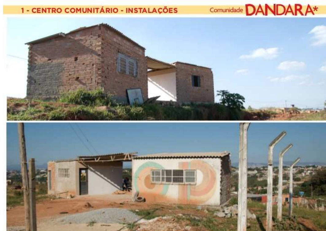
Figura 4 – Centro Comunitário Prof. Fábio Alves, na ocupação Dandara (em construção)