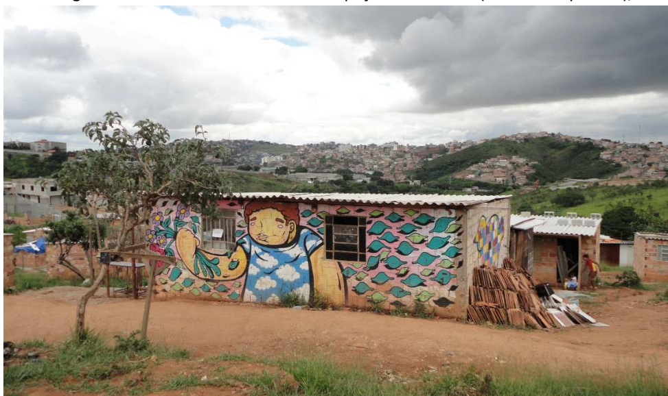
Figura 6 – Creche Tia Carminha na ocupação Eliana Silva (antes da expansão), 2013

A Creche Tia Carminha é fonte de grande orgulho para as moradoras e moradores da Eliana Silva, e tornou-se um dos seus espaços coletivos mais importantes. Atende a crianças com até 6 anos, de dentro da própria comunidade, e foi construída – e expandida recentemente – mediante mobilização e financiamento coletivo-digital, com o apoio de pesquisadores e estudantes da UFMG. A creche é mantida pelo trabalho de mulheres voluntárias, e pela contribuição e pelo apoio financeiro de dentro e fora da comunidade. É um espaço comum onde as formas de comunalização do trabalho doméstico, assumidas geralmente por mães solteiras, são vivenciadas pela partilha do cuidado do outro.