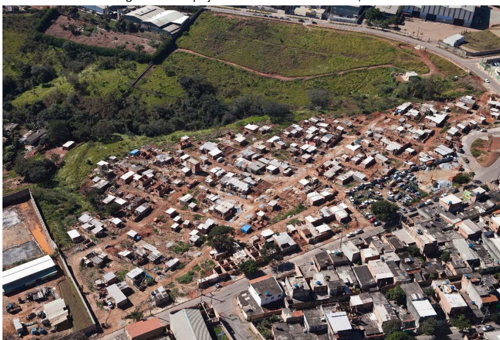
Figura 3 – Ocupação Eliana Silva vista de cima, 2013