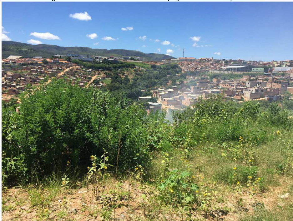
Figura 8 – Horta comunitária na ocupação Paulo Freire, 2016