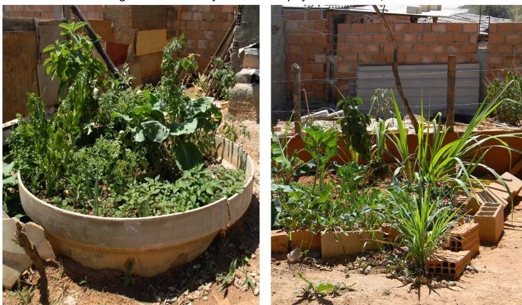
Figura 9 – Hortas e jardins na ocupação Eliana Silva, 2013

Por outro lado, na Eliana Silva, alguns moradores relatam que o jardim e quintal da própria casa são “comunais”, já que vizinhos e conhecidos podem usá-los quando precisarem, inclusive para plantar e colher. Essas práticas costumeiras estão enraizadas na noção de usufruto, isto é, no direito de usar e desfrutar da propriedade de outrem. Apesar da perda da horta comunitária, o mesmo se dá na ocupação Dandara, onde muitas famílias ainda cultivam hortas e jardins em quintais, e há relatos de redes de doação, intercâmbio local e venda de excedentes de produção para as necessidades de autoconsumo das famílias, formando comunidades informais baseadas em relações de partilha e reciprocidade que, além de minimizar situações de vulnerabilidade, criam laços comunitários.