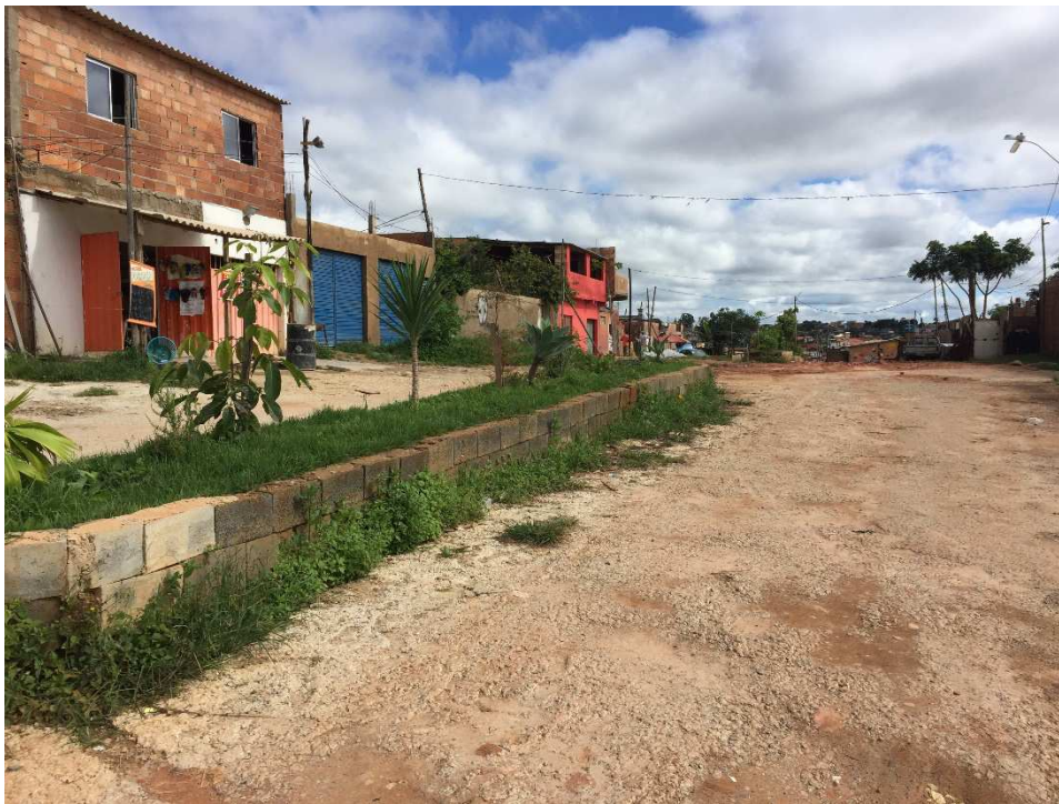
Figura 10 – Canteiro na avenida principal da ocupação Dandara, 2016

mostram como fragmentos de espaços não exatamente públicos nem privados, cuja produção e manutenção estão intrinsecamente enraizados nas possibilidades e nos obstáculos do cotidiano de cada família responsável por eles, florescem especialmente em condições de informalidade, precariedade e falta de planejamento por parte do estado.