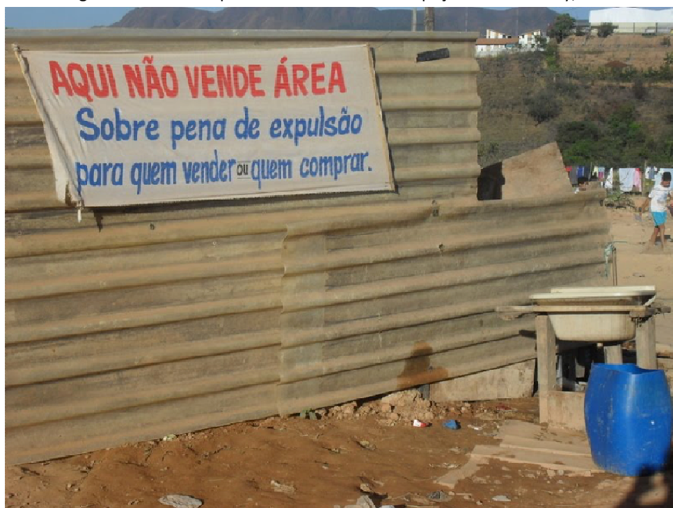
Figura 12 – Faixa “Aqui não vende área” na ocupação Irmã Dorothy, 2010

Na época da formação da ocupação Irmã Dorothy, vizinha da Eliana Silva, encontravam-se faixas em sua entrada afirmando: “Informamos que a única maneira de morar na ocupação é através da fila” e “Aqui não vende área. Sobre pena de expulsão para quem vender ou quem comprar”. Na Eliana Silva, ainda existe o sistema de filas (dando preferência a mulheres e pessoas com deficiência, em condições de precariedade habitacional) e o controle quanto ao acesso à terra, com restrições à compra e venda. Caso alguém desista de viver na ocupação, o morador original pode ser compensado pelo novo habitante no valor da melhoria de sua casa, sem poder computar o valor da terra. Houve até relatos de que alguns moradores que chegaram a ser expulsos por não respeitarem estas regras.