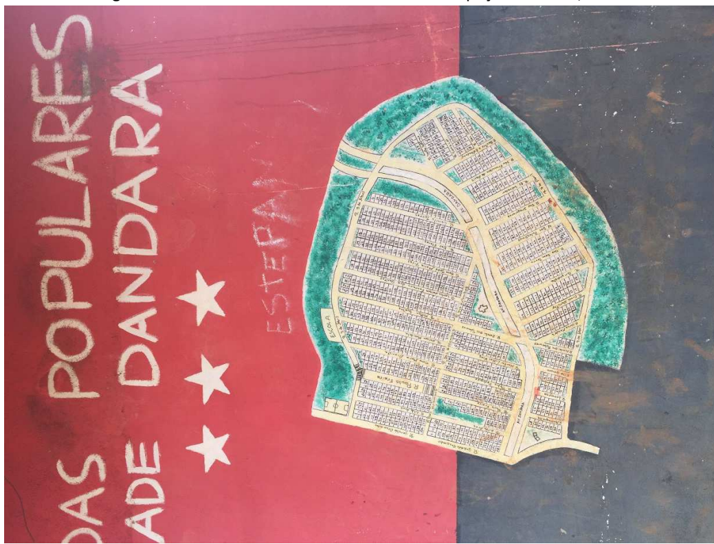
Figura 11 – Subdivisão de lotes individuais na ocupação Dandara, 2016