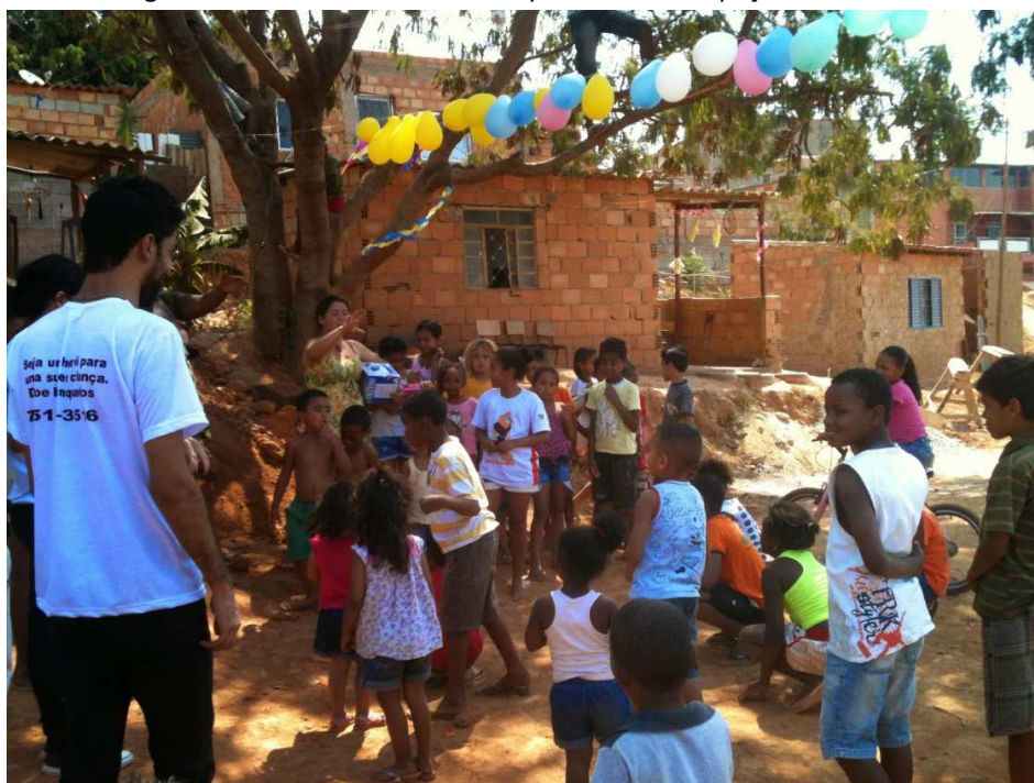
Figura 5 – Festa de aniversário na pracinha da ocupação Eliana Silva