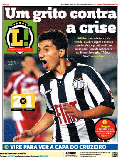
52A Um grito contra a crise

Esta segunda possibilidade pode ser observada na página a seguir, onde o título 52A se situa sobre a imagem de um jogador atleticano gritando num gesto de comemoração: