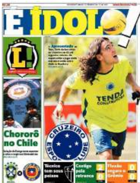
Figura 8: CAPA 8 Lance!