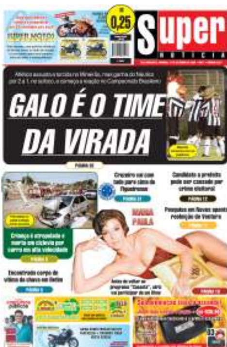
Figura 4: CAPA 4 Super