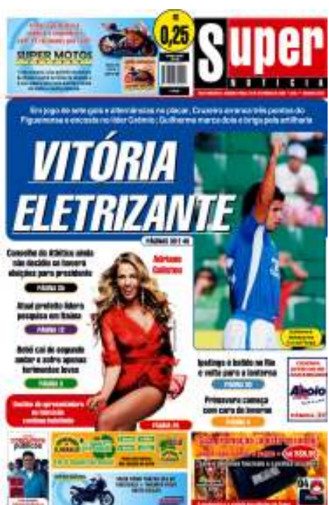
Figura 5: CAPA 5 Super