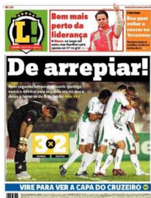
Figura 7: CAPA 7 Lance!

Foi possível perceber que a equipe que apresenta o melhor desempenho no momento da publicação é sempre a escolhida para a capa principal.