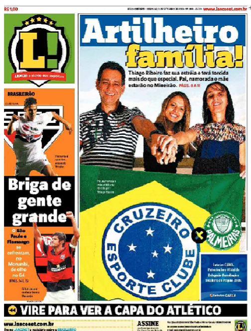
Figura 6: CAPA 6 Lance!

No caso do Lance! , algumas edições configuram sua contracapa como uma segunda capa, chamada de “capa do Atlético” ou “capa do Cruzeiro”, dependendo da equipe que ganhou mais destaque na capa principal. A partir desse recurso topográfico, dá-se voz a um enunciador de cada equipe e se espera a simpatia/atração (iv) das duas nações, como podemos observar a seguir: