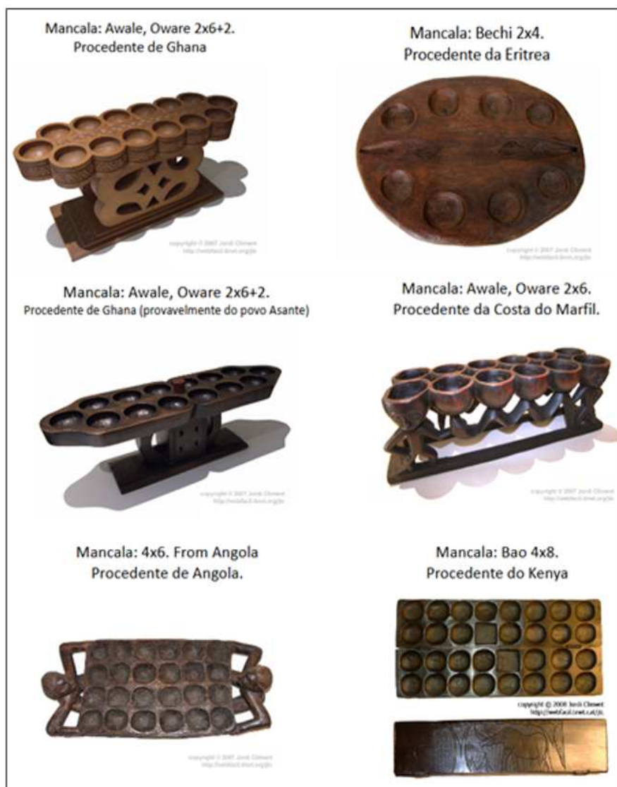
Figura 2 Família de Mancalas