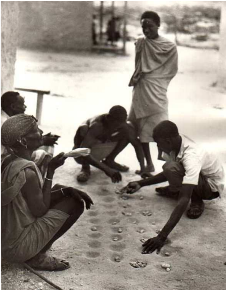
Figura 1 Praticantes da Mancala