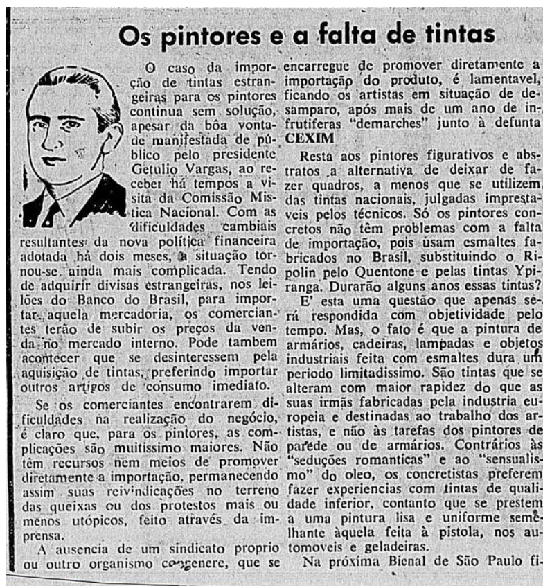
Figura 3 - Diário Carioca . Rio de Janeiro, edição 07793, 29 de novembro de 1953.

Paulo figuram quadros de alguns concretistas, pintados com tintas plebeias. Mas, há, no Brasil pintores que, ciosos da tradição de seu ofício, recusam-se utilizar-se do produto nacional. É o caso de Iberê Camargo. Como lhe perguntássemos por que não concorrera à internacional do Parque Ibirapuera, disse-nos o pintor: Não disponho mais de tintas verdadeiras, desisti da Bienal. Sou contrário a esse gênero arriscado de experiências e não uso o Ripolin ou o Quentone. Registro a confissão do artista, sintomática da crise gerada pela falta de importação de tintas estrangeiras. (BENTO, Antônio. Os pintores e a falta de tintas. Diário Carioca , 29 de novembro de 1953. Ed. 07793, p. 6).