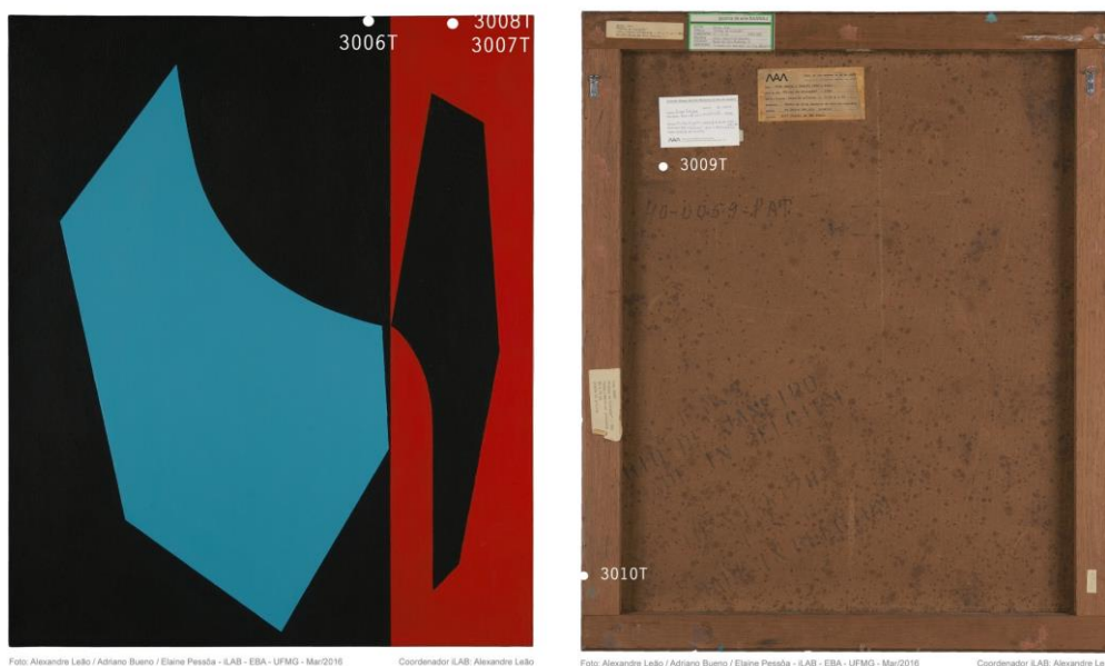
Figura 2 a e b (frente e verso) - Ivan Serpa, Forma em Evolução , 1952, 87,5x73cm. Acervo MAM-RJ. Marcas das áreas de remoção de amostras pelo LACICOR

“pintura concreta” do artista não tenha sido identificada na nota publicada em julho de 1952, Formas em Evolução corresponde cronológica e tecnicamente ao experimento noticiado. Esta pintura foi apresentada na I Exposição Nacional de Arte Abstrata, realizada no Hotel Quitandinha, na cidade de Petrópolis, em 1953. Vinte anos depois, foi exposta na XII Bienal de São Paulo, ocorrida em 1973, mesmo ano em que Ivan Serpa faleceu. Conforme documentação museológica, a mesma foi doada pelo artista ao acervo do MAM-Rio, em 1953.