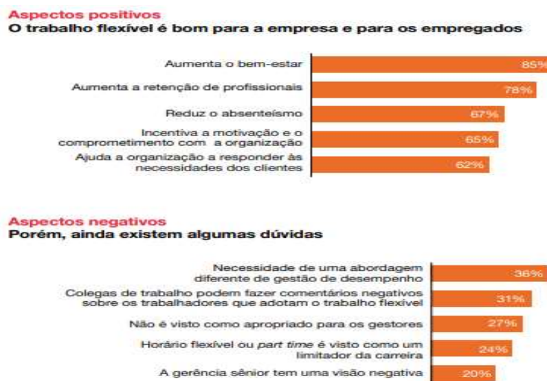
Figura 1 – Vantagens e desvantagens do home office

Muito se discute acerca sobre as vantagens e as desvantagens desse formato de trabalho, sendo que ambos os casos se têm considerações como as mostradas na Figura 1.