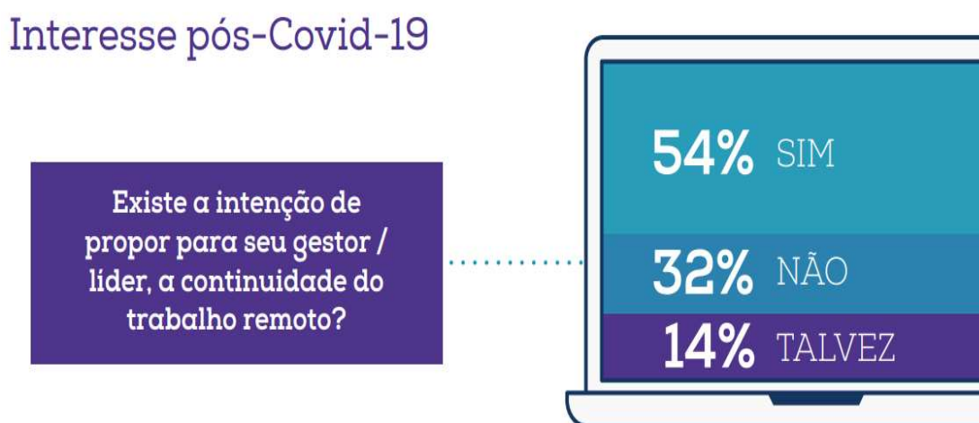
Figura 3 - Intenção da continuidade do trabalho remoto após a pandemia do COVID-19