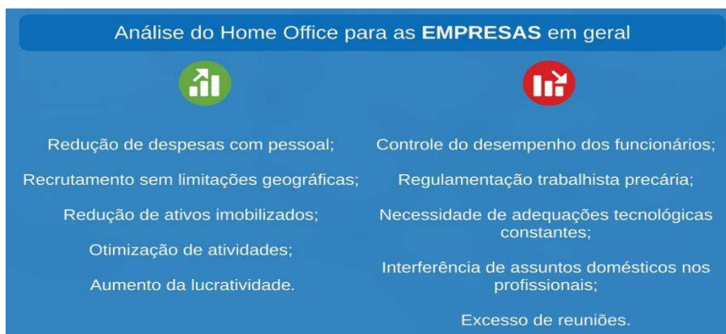
Quadro 3 - Análise do home office por parte das empresas brasileiras de um modo geral

Analisando o Quadro 2, percebe-se que o foco da Petrobrás, assim como da maioria das empresas brasileiras, comparando com as ações início pandemia em 2020, continua sendo o de dar suporte aos seus colaboradores. O que se observa de diferença é que esse apoio tem se estendido a outras instituições e a órgãos governamentais brasileiro, para, assim, auxiliar toda a população na luta contra a Covid-19. A partir do que foi apresentado até agora, o Quadro 3 mostra uma análise do home office por parte das empresas brasileiras de um modo geral