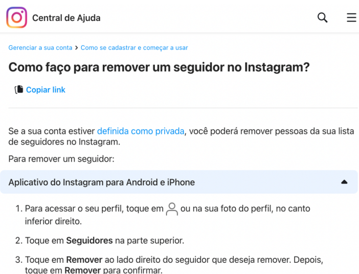
Figura 2 - Captura de tela: como remover um seguidor no Instagram