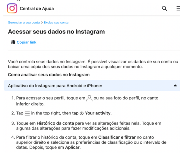
Figura 3 - Captura de tela: como acessar seus dados no Instagram

Esses são apenas alguns recursos, escolhidos a título exemplificativo, disponíveis no Instagram, que podem auxiliar na proteção da criança na prática do sharenting .