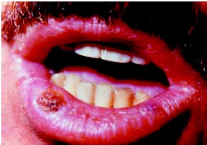
Carcinoma invasor de lábio