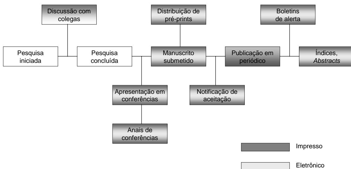
FIGURA 2 – Adaptação do modelo de Garvey e Griffith para um ambiente impresso e eletrônico

Costa (2000) acredita que o modelo de Garvey e Griffith, firmado apenas no meio impresso, não faz mais sentido na atual situação. Entretanto, o modelo apoiado exclusivamente no meio eletrônico, conforme proposto por Hurd, ainda não existe. Assim, ela apresenta um modelo híbrido de comunicação de pesquisa, que considera ilustrar melhor a situação atual, o qual é reproduzido a seguir: