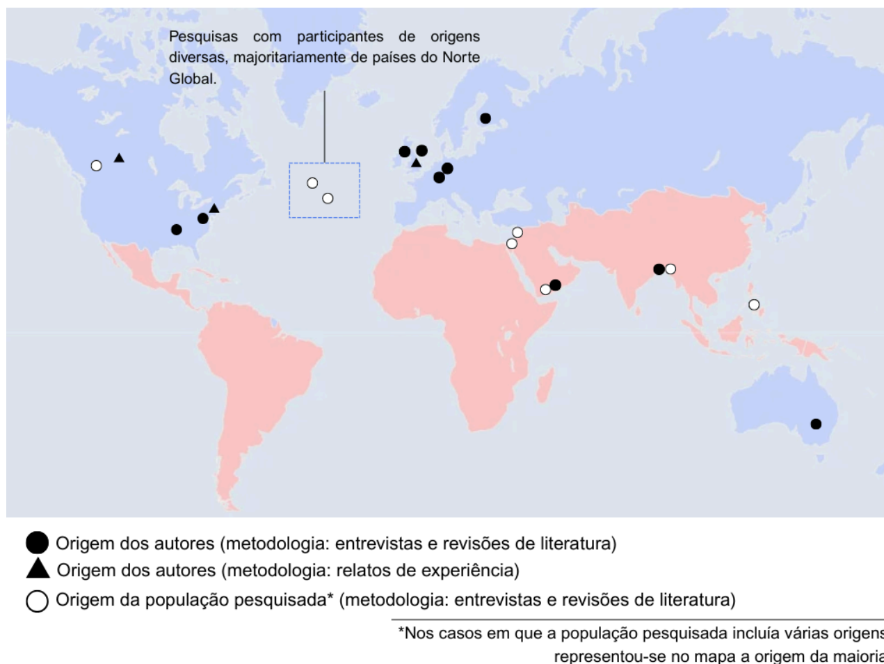
Figura 3 - Mapa das origens dos autores (elaborado pela autora)

uma história pode perder seu cerne e sua identidade quando o narrador é estranho à narrativa.