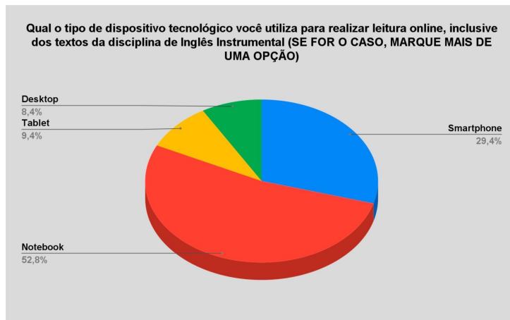
Figura 2. Tipos de dispositivos utilizados pelos estudantes.