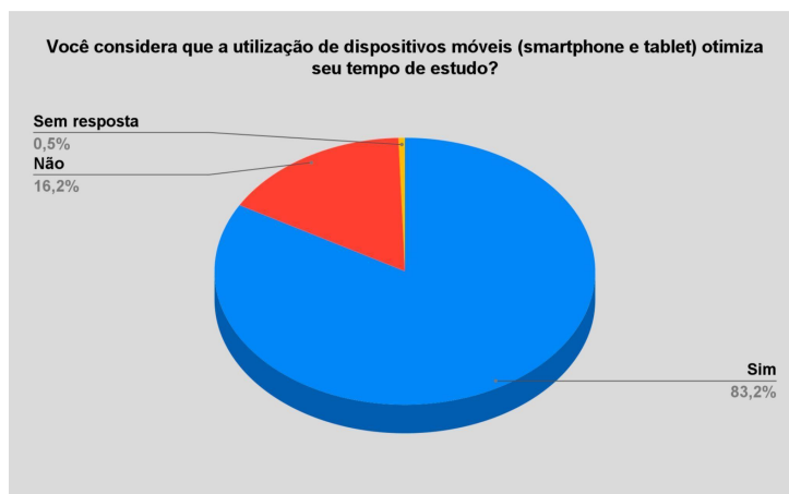
Figura 4. Otimização do tempo.