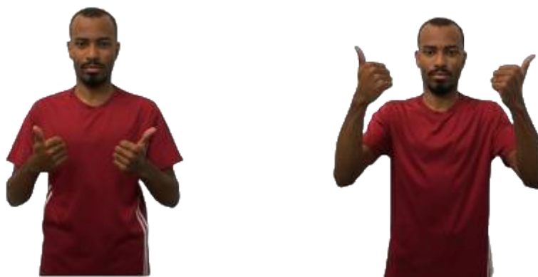
Figura 09 - Sinal MELHOR em Libras

Legenda: metáfora orientacional para cima é relacionada a algo bom.