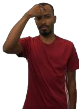
Figura 05 - Sinal de CONSCIÊNCIA em Libras

Legenda: metáfora ontológica região da cabeça.