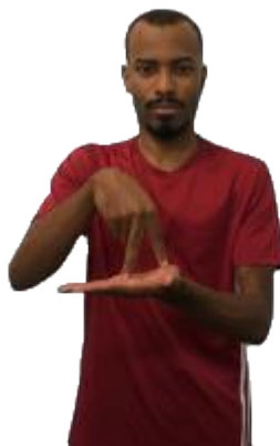
Figura 07 - Sinal FIRME em Libras

Legenda: metáfora estrutural; estar sobre uma base.