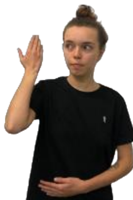
Figura 08 - Sinal PASSADO em Libras

Legenda: metáfora orientacional; algo que ficou para trás.