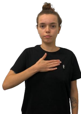
Figura 02 – Sinal de PRAZER em Libras

Legenda: metáfora ontológica região do tórax.