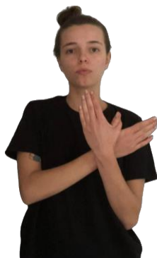
Figura 01 - Sinal BORBOLETA em Libras