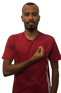
Figura 03 - Sinal de VIDA em Libras

Legenda: metáfora ontológica região do tórax.