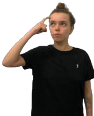
Figura 04 - Sinal de PENSAR em Libras

Legenda: metáfora ontológica região da cabeça.