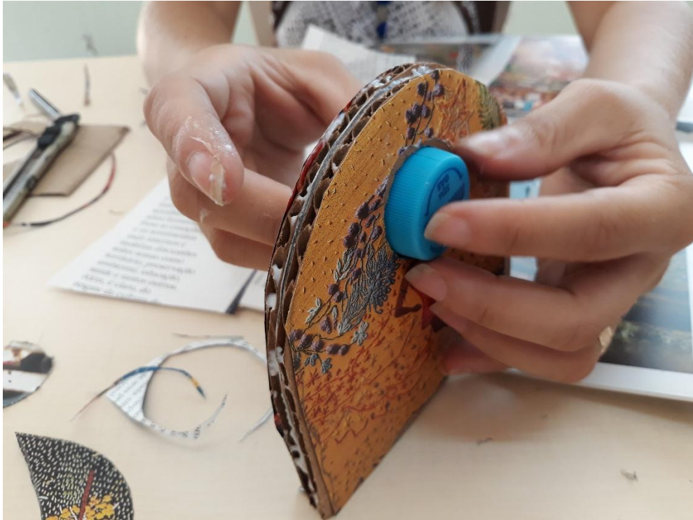
Figura 5 – O fazer de um livro-objeto sonoro