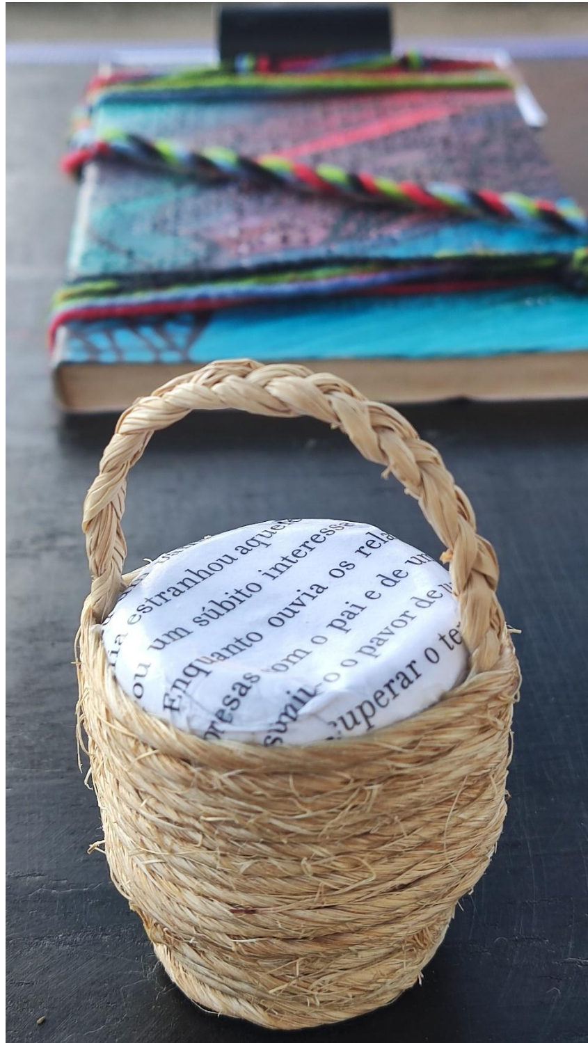
Figura 3 – Dois livros-objeto da exposição “Leitura sensorial”