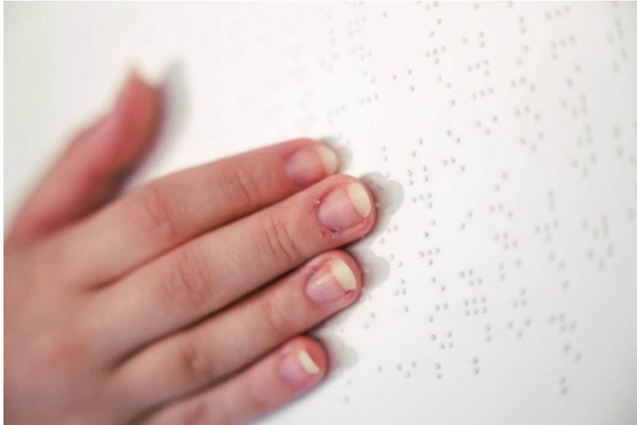
Figura 1 – Leitura do texto curatorial impressa em braille