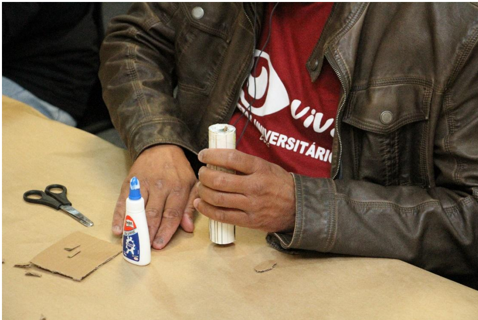
Figura 4 – O fazer de um livro-objeto