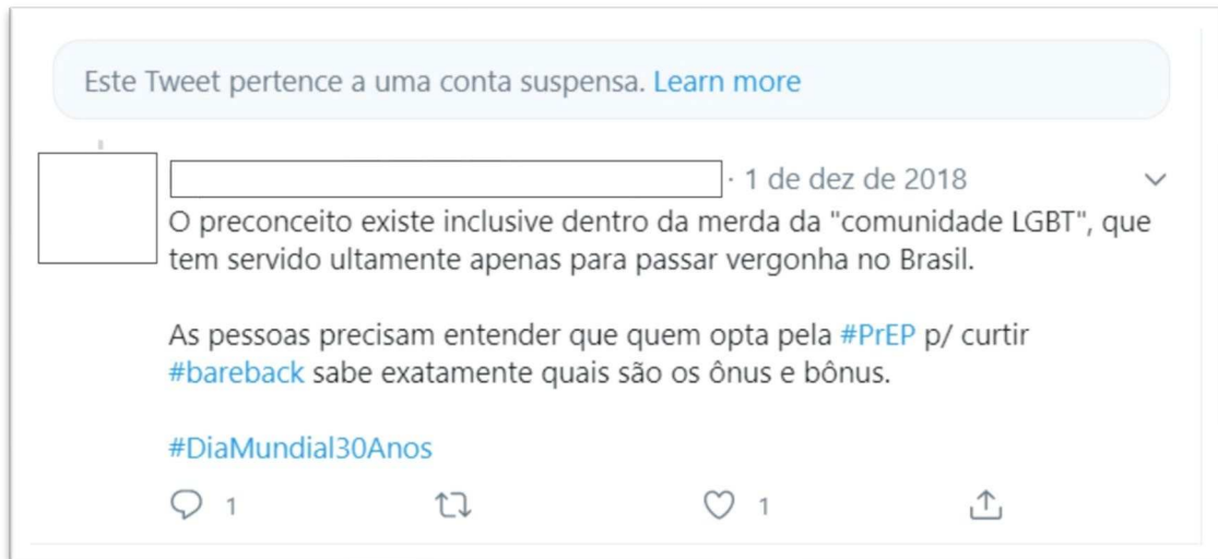
Figura 5 Captura de tela 10