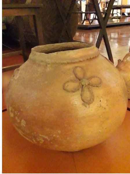
Figura 2: Moringa (detalhe).