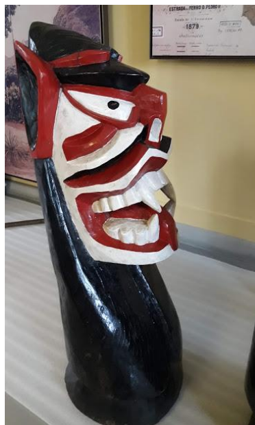
Figura 5: Carranca, séc. XIX/XX.