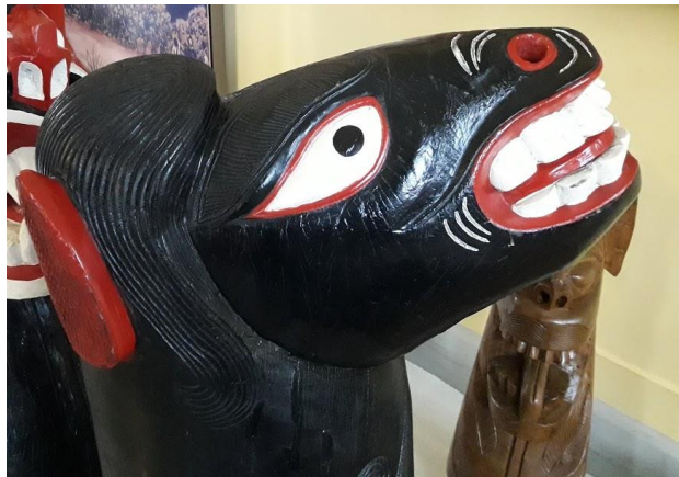
Figura 4: Carranca (detalhe), séc. XX.

O acervo do MAO abriga objetos utilitários, em sua maioria; desde ferramentas antigas de carpintaria e marcenaria, até garfos, pratos, formas de bolo. São peças artísticas que dialogam com o artesanato e as habilidades manuais. Existem também peças como as carrancas, que eram colocadas na proa das canoas para espantar os maus espíritos e proteger a viagem do canoeiro.