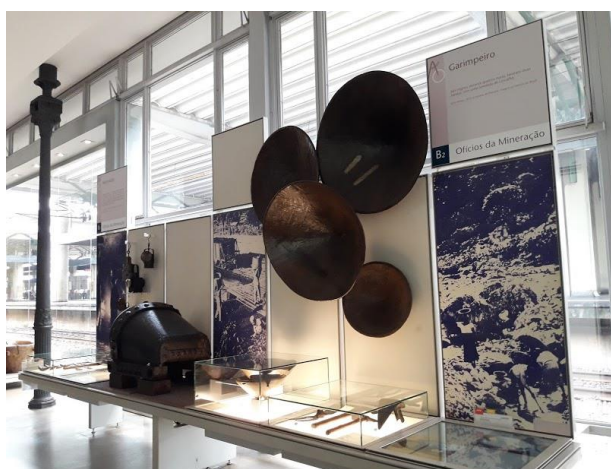
Figura 9: Ofícios da mineração e garimpo.

Quando estamos diante de objetos que denunciam práticas desumanas de trabalho que aconteciam sem nenhuma preocupação com os trabalhadores envolvidos, os jovens também questionam e relacionam com práticas atuais. Como exemplo, no acervo do MAO, temos as bateias que eram utilizadas no garimpo e as lanternas na mineração. Eles pensam em relações entre o que mudou e o que continua igual, perguntam sobre as origens desses objetos e sobre como foram feitos. Pensam de forma crítica e se encantam com a materialidade.