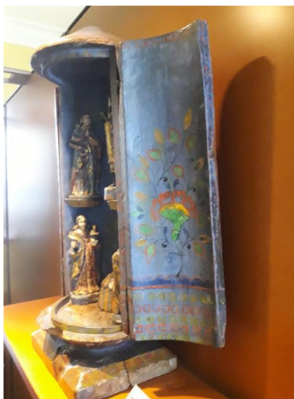
Figura 6. Oratório bala, séc XVIII/XIX (detalhe).

No sentido de proteção, os detalhes dos oratórios na Sala da Proteção do Viajante , contam para o visitante sobre como as pessoas que os esculpiram e pintaram acreditavam no poder do que faziam. Quando conversamos com os jovens sobre esses oratórios e relacionamos com o sincretismo religioso praticado no Brasil pelos povos africanos e afro-brasileiros, os mesmos levantam muitas questões, como por exemplo, a questão da resistência e luta desses povos. Alguns jovens, praticantes de religiões afro-brasileiras, contam sobre suas vivências e nos explicam conceitos e valores que eles acreditam. A partir de um simples objeto, muitas reflexões vêm à tona - podemos perceber o quanto a arte é importante para o desenvolvimento do olhar e do pensamento.