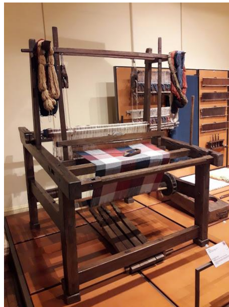
Figura 3: Tear, Séc XIX

Um objeto comum como um garfo, pode ascender o nosso olhar, nos fazendo pensar nas questões de memórias e afetos. Sobre isso, Dewey nos aponta sobre “chegar à teoria da arte por meio de um desvio” (2010, pag. 60). Devemos olhar devagar, dar tempo e silêncio; assim, a visão se amplia. É sobre prestar atenção nos detalhes das coisas – imagens, objetos, sons, instantes, memórias – desde as mais simples até as que parecem mais complexas, e pensar sobre elas. Esse ato gera