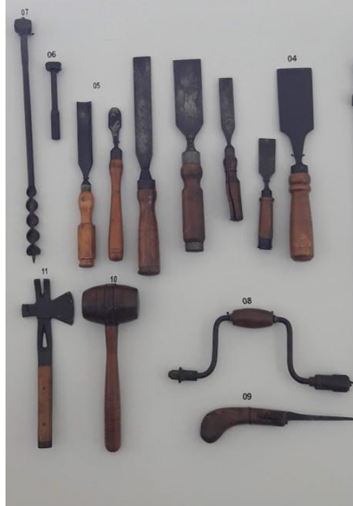
Figura 1: Conjunto de ferramentas, séc.XIX/XX.

A coleção do Museu de Arte e Ofícios nos remete diretamente a ideia da arte como experiência, citada por John Dewey.