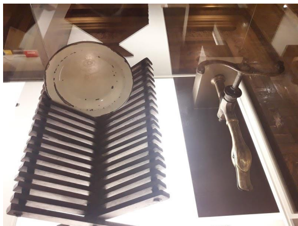
Figura 7: Torneira e Escorredor de Pratos, Séc. XIX/XX.

É possível perguntarmos sobre como um objeto comum e aparentemente simples, como por exemplo, um prato esmaltado com todos os seus detalhes e marcas do tempo, pôde encontrar o seu lugar permanente dentro de um museu. A resposta para essa questão, dentre várias, está dentro de cada pessoa, olhando para o objeto e identificando-se com ele de alguma maneira. Muitos se lembram da infância nas casas dos avós, ou dos pratos iguais a esse que ainda hoje utilizam. Alguns olham para a luxuosa torneira do século XIX logo ao lado do prato e se questionam como objetos tão opostos podem estar juntos. Quem utilizava a torneira ornamentada e provavelmente cara, e quem utilizava o prato esmaltado e levemente descascado pelos gestos de quem se alimentava com simplicidade – são perguntas que ficam e nos transportam no tempo e nas questões também sociais.