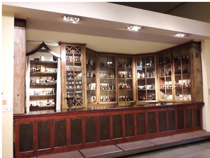
Figura 8: Botica

brasileiros possuem com a natureza, a tal ponto de terem transmitido tantos ensinamentos e práticas que curavam – e curam – as pessoas.