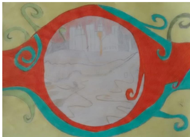
Figura 7: Trabalho realizado por aluno