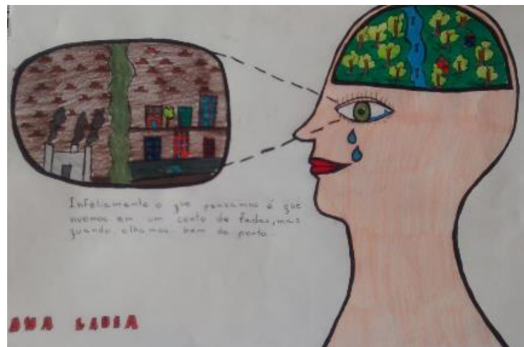
Figura 6: Trabalho realizado por aluno

A partir dessa perspectiva, foi proposta a produção de um desenho, em que os alunos refletissem sobre alguma questão presente na atualidade. O tema escolhido pelos alunos meio ambiente. Cada aluno, em papel A4 e utilizando lápis de cor e canetinhas, produziram as suas ilustrações. Os alunos foram orientados de que estariam, neste momento, realizando o esboço do que será reproduzido nas paredes.