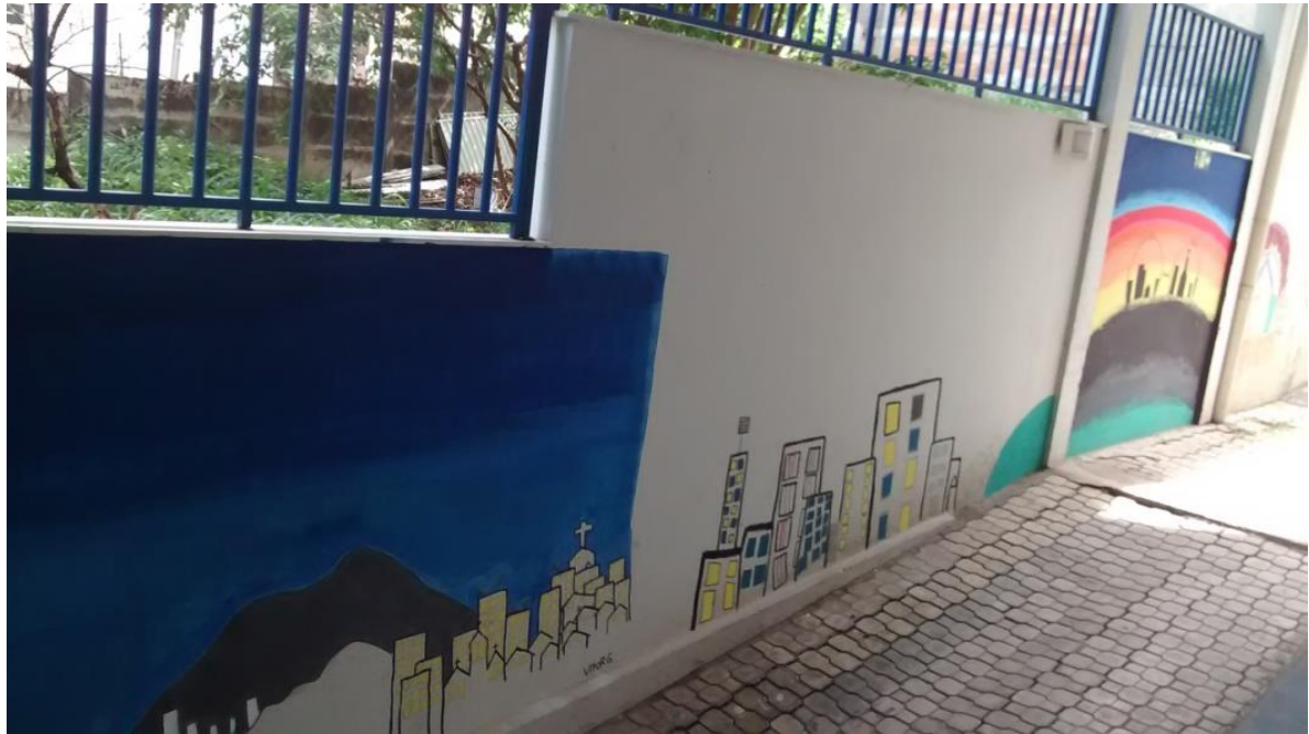
Figura 12: Pintura realizada pelos grupos 1 e 2 nos muros da escola

Paulo Freire (Freire, 1996, pag.21) afirma que Ensinar não é transferir conhecimento, mas criar as possibilidades para a sua produção ou a sua construção. Assim, o ensino deve ter como princípio a orientação para formulação de conceitos a serem construídos a partir dos conhecimentos que o aluno possui o diálogo com o que eles pensam estimulando a capacidade de indagar que contribui para a formação de um cidadão consciente de seus direitos e deveres. Devemos considerar que a proposta de trabalho com o Grafite possibilitou este dialogo, o que pode ser comprovado através das produções realizadas pelos alunos. Através dos trabalhos em grupo de pintura nos muros da escola, também fica evidente que os alunos conseguiram se apropriar de seus conhecimentos individuais e extrapolar para um contexto social mais amplo de forma eficaz.