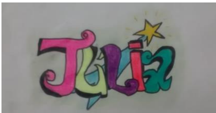
Figura 4: Trabalho realizado por aluno