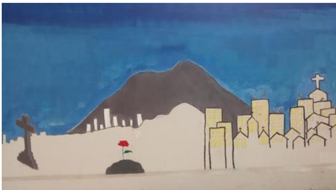
Figura 10: Pintura realizada em grupo pelos alunos nos muros da escola