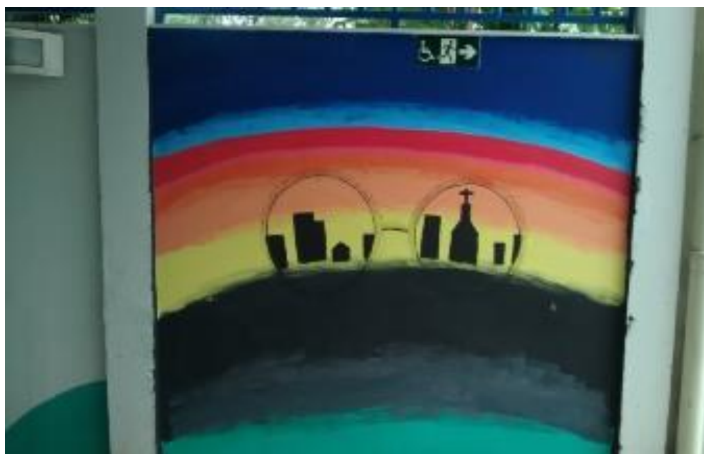
Figura 9: Pintura realizada em grupo pelos alunos nos muros da escola

Em consonância com que é proposto pelo Plano Curricular Nacional, o presente trabalho permitiu concluir, na prática, que o Grafitismo pode ser uma valiosa proposta no ensino de Artes Visuais, constituindo-se como uma opção para a abordagem de um trabalho de emancipação, uma vez que buscou-se a aproximação das vivências do educando com um contexto mais amplo , que extrapola seu meio e parte para o social.