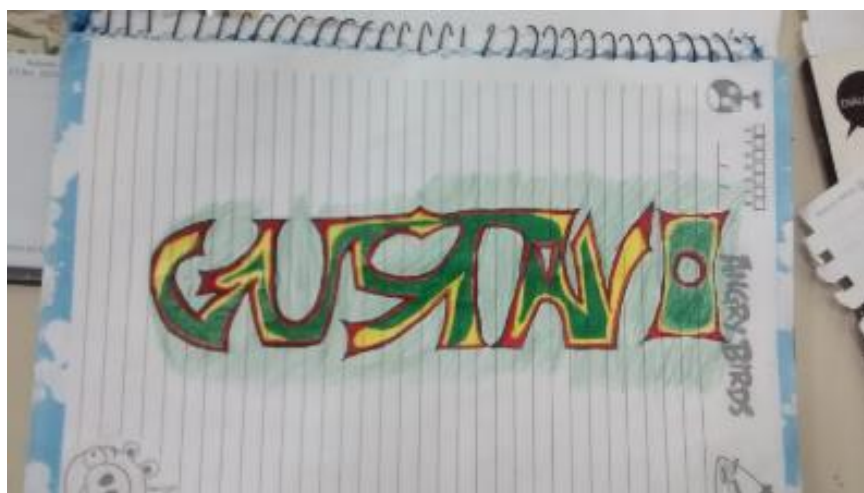
Figura 5: Trabalho realizado por aluno