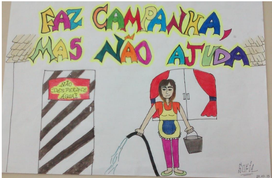
Figura 8: Trabalho realizado por aluno