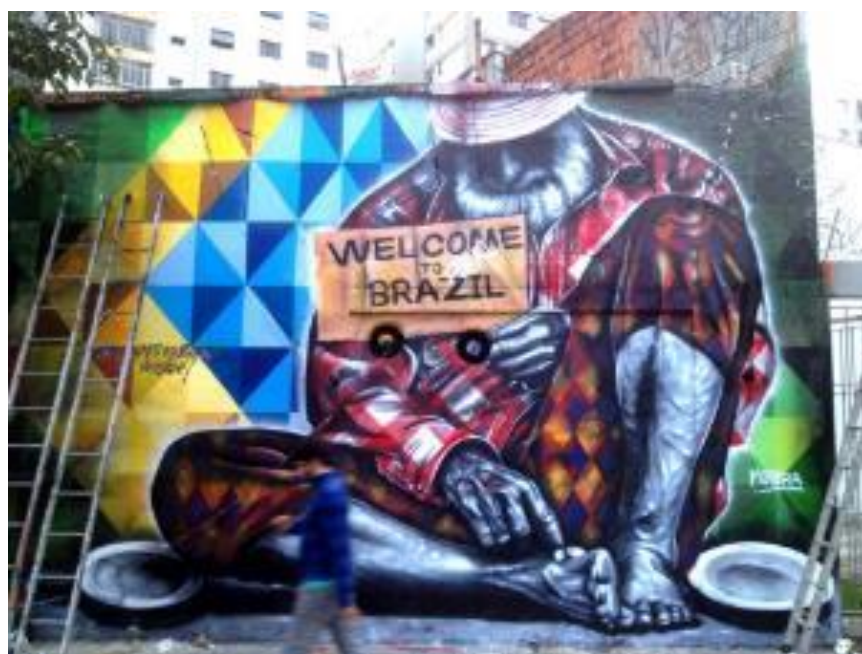
Figura 2: mural “Welcometothe real Brazil” de Eduardo Kobra, localizado em São Paulo

Em sequencia, buscando atender aos objetivos propostos pela atividade de leitura e codificação de imagens, a discussão foi conduzida com foco no tema apresentado, passando do limite estético para a crítica. O questionamento principal colocado foi: como vocês entendem a obra? Coube ao conduzir a atividade, o cuidado de não estabelecer o conceito de certo ou errado, nem ficar tentando adivinhar a possível intenção do artista. Em sequencia, foi selecionada, pela professora, a imagem de um grafite produzido pelo artista Kobra, para que os alunos discorressem por escrito sobre ela, com base nos mesmos pontos apresentados na discussão oral.