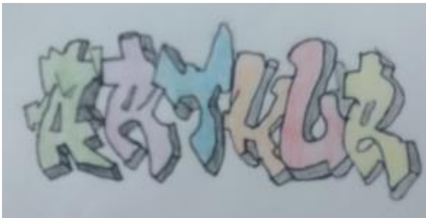
Figura 3: Trabalho realizado por aluno

Mion. Após a apresentação os alunos escreveram seus nomes utilizando as informações dos Tutoriais apresentados.