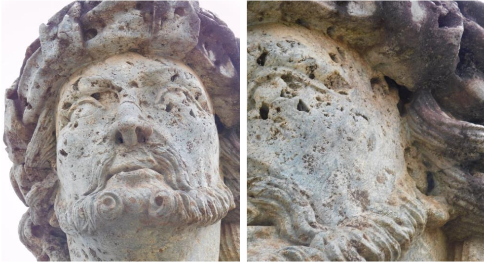
Danos verificados no Profeta Jeremias.