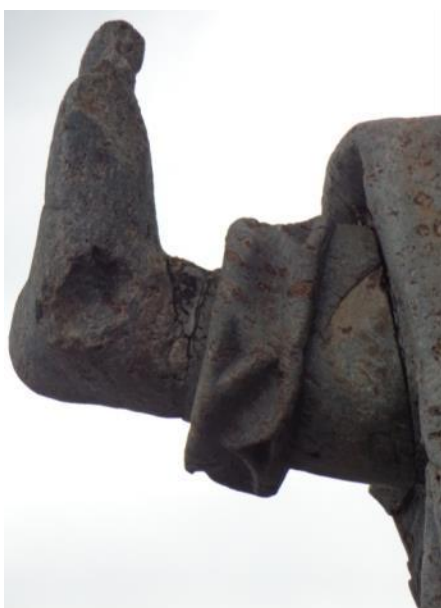
Danos verificados no Profeta Jonas.