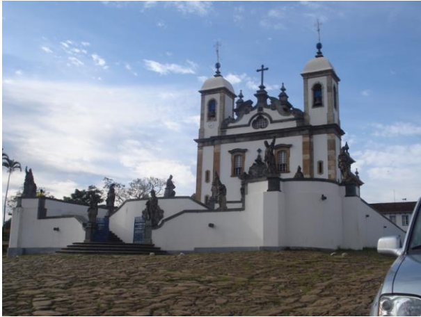
Santuário Bom Jesus de Matosinhos, Congonhas do Campo/MG

Após a criação do SPHAN (Serviço do Patrimônio Histórico e Artístico Nacional) no final da década de 1930, ocorreu o tombamento expressivo de bens culturais em Minas Gerais, privilegiando a produção artística do período conhecido como barroco colonial mineiro (século XVIII), com iniciativas no sentido de restauração e da preservação do patrimônio cultural do Brasil, e pesquisas da utilização de alguns materiais. (Costa, 2009). Apesar da pedra não ser contemplada em tais estudos, foi constatado um número significativo de peças em material pétreo na região mineira, com danos que poderiam levar à destruição dos bens. A partir de tal constatação foi solicitado o estudo da cantaria, realizada no ano de 1941 por Orosco. (Revista do SPHAN, 1941).