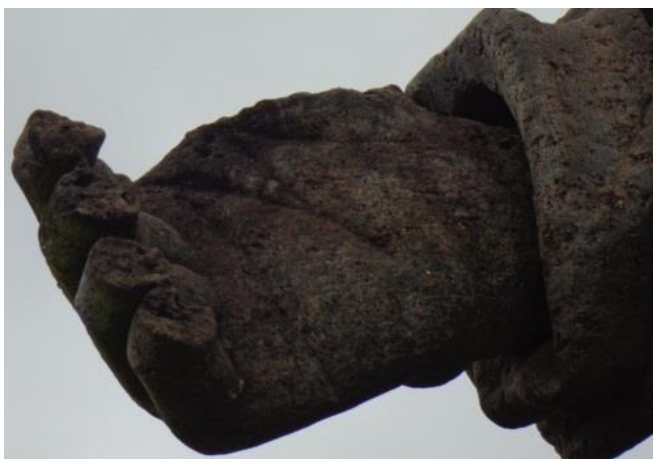
Danos verificados no Profeta Amós.

As análises para conhecimento do estado de preservação das esculturas abarcou alguns ensaios, como a medição da velocidade ultrassônica, que evidenciou os diferentes estados de deterioração e as diferentes pedras utilizadas. O decaimento salino - cristalização e recristalização de sais - pode ser considerado o fator mais importante de aceleração da degradação, já que possuem alto poder de destruição. A umidade e a poluição atmosférica contribuem ainda para o processo de deterioração. Apesar de lento, é notável a aceleração do processo devido às mudanças climáticas e ao tempo de exposição, deixando os danos cada vez mais visíveis. (Herkenrath et al. , 1994).