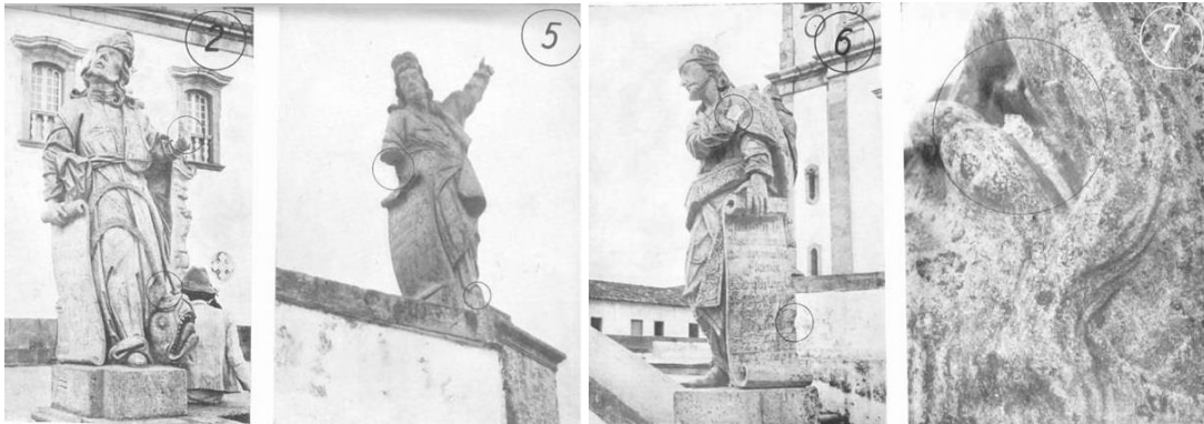
Mutilações sofridas pelos profetas: dedos de Jonas [2]; antebraço e pé de Habacuc [5]; mão, punho e painel de Ezequiel [6]; e língua da figura do peixe junto a Jonas [7].