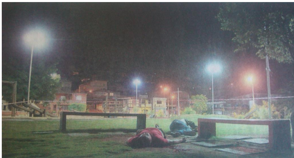
5 MORREM EM SANTO ANDRÉ; ÔNIBUS PARAM NA ZONA SUL (Folha de São Paulo, edição de 10 de novembro de 2012).