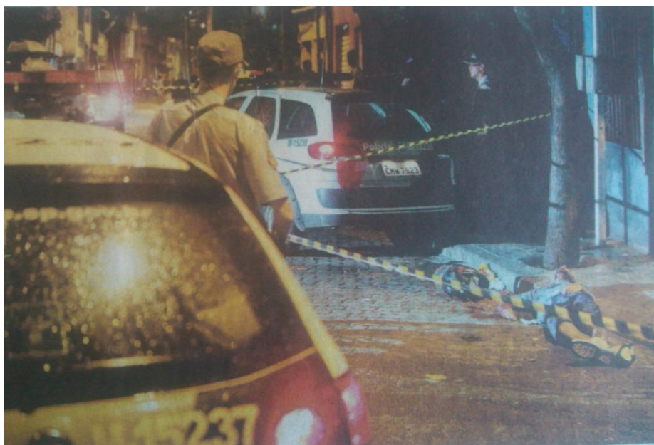
TRÊS PESSOAS SÃO ASSASSINADAS E SETE FICAM FERIDAS EM GUARULHOS (Folha de São Paulo, edição de 13 de novembro de 2012).

O fotojornalismo, a cada dia, nos traz as porções do mundo e de seus acontecimentos. Produzem e fazem circular pequenas narrativas diárias recortadas por um tempo e espaço já pactuados em uma espécie de “imagem-síntese” dos fatos, especialmente, aquelas ligadas ao sofrimento humano. 60