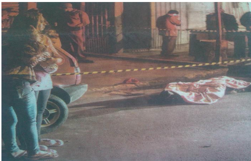
ATIRADORES MATAM 4 PESSOAS E FEREM 7 EM OSASCO E CARAPICUÍBA (Folha de São Paulo, edição de 19 de abril de 2013).

Com um corpo coberto por um lençol estendido no chão e observado por alguns olhares curiosos, a Folha de São Paulo ilustra mais uma notícia cujo enfoque é a violência urbana. A fotografia pode causar estranheza, pena, revolta, indignação ou medo naqueles que a veem. Qualquer um e todos os sentimentos são possíveis diante da imagem. Improvável é que alguém não sinta nada diante dela. E é essa a razão pela qual ela está ali.