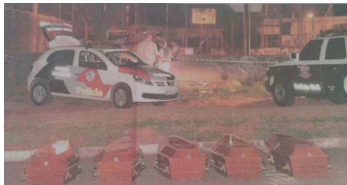
SETE SÃO MORTOS EM CHACINA EM SÃO PAULO (Folha de São Paulo, edição de 1º de novembro de 2012)

O cachorro que lambe o sangue derramado na rua, ou os cinco caixões enfileirados no local onde ocorreram as mortes, são imagens como essas que acompanham as edições diárias das notícias policiais. A imagem tem importância crucial na construção da narrativa, já que