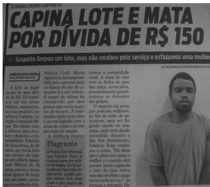
CAPINA LOTE E MATA POR DÍVIDA DE R$ 150 (Super Notícia, edição de 08 de fevereiro de 2013).

Contudo, essa conclusão não torna as fotografias que ilustram as matérias do Super Notícias menos questionáveis. Se para a Folha de São Paulo o corpo sem vida, assassinado é o destaque da fotografia, para o Super Notícias é o corpo vivo, daquele que foi acusado de ter cometido o crime, o objeto da imagem.