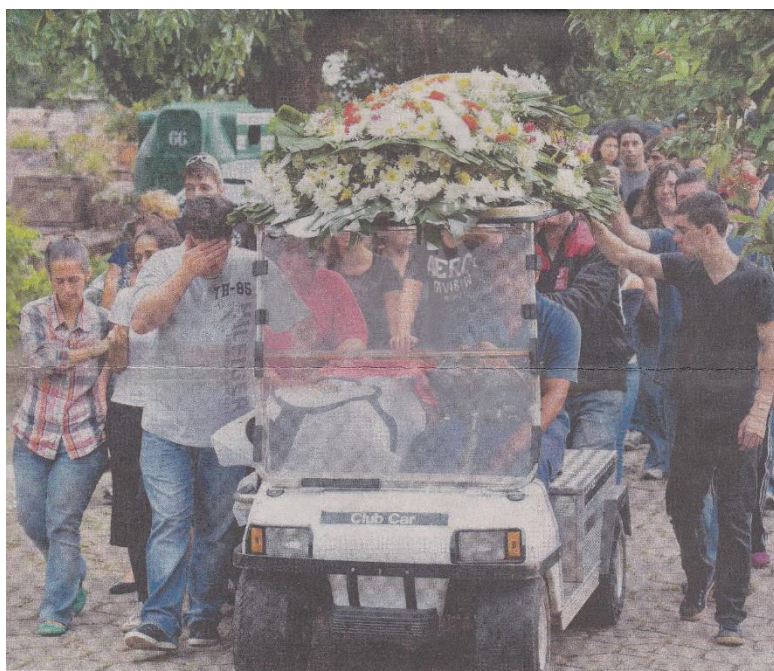
Pai (com a mão no rosto) e amigos no enterro; calção foi coberto com bandeira do Santos e camisa do time da faculdade