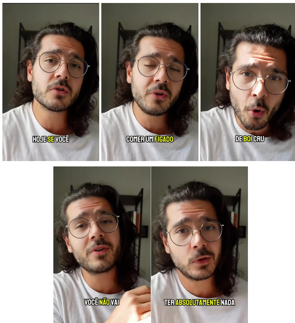
Frames do vídeo “Os benefícios do leite cru para a saúde”.

Cabe destacar que a análise crítica das afirmações tendenciosas presentes no vídeo sobre a pasteurização do leite permite não apenas discutir o conteúdo científico envolvido, mas, sobretudo, desenvolver competências argumentativas nos alunos. Nesse sentido, a proposta didática que parte deste trabalho visa promover a capacidade de identificar falácias, avaliar fontes, reconhecer estratégias retóricas enganosas e construir contra-argumentos embasados em dados confiáveis. O ensino da argumentação, nesse contexto, adquire um papel central na formação de sujeitos autônomos, capazes de participar ativamente nos debates sociais e científicos que definem o mundo contemporâneo a partir de informações embasadas.