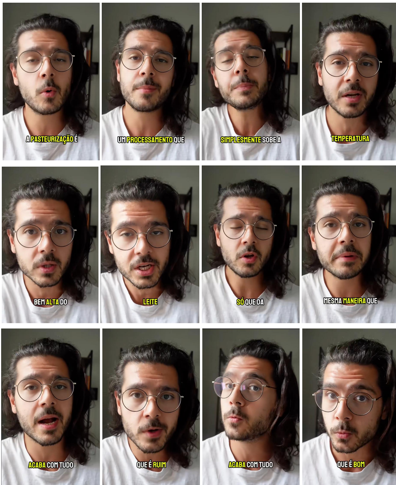
Frames do vídeo “Os benefícios do leite cru para a saúde”.