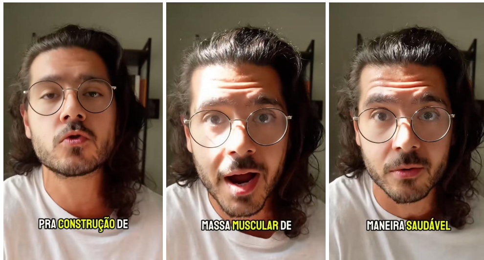
Frames do vídeo “Os benefícios do leite cru para a saúde”.

Atribuir valor científico à experiência empírica de fisiculturistas, desprovida de validação acadêmica, é uma forma de conferir legitimidade a um argumento que parece não estar baseado em estudos com rigor metodológico. Essa estratégia pode ser desconstruída em sala de aula, promovendo o desenvolvimento do senso crítico dos alunos diante de informações que circulam com aparente credibilidade em espaços não científicos.