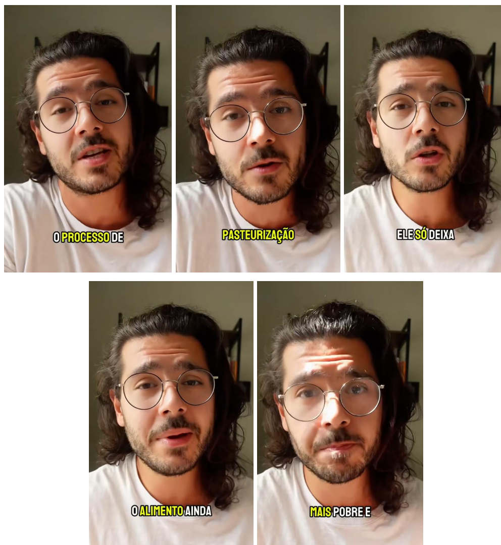
Frames do vídeo “Os benefícios do leite cru para a saúde”.

A sequência de falas no vídeo inclui também a alegação de que a pasteurização “deixa o alimento ainda mais pobre”, o que é uma afirmação vaga, de modo que recorre a um vocabulário subjetivo e impreciso para sustentar uma ideia de empobrecimento do leite sem qualquer quantificação ou referência empírica.