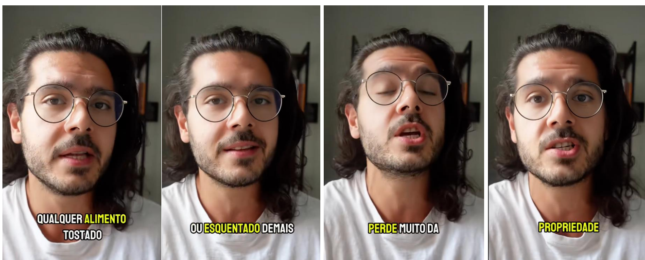
Frames do vídeo “Os benefícios do leite cru para a saúde”.

estudantes do EM, elemento fundamental para que possam interagir de forma ética e responsável com os múltiplos discursos que permeiam a sociedade contemporânea. O vídeo escolhido apresenta uma série de afirmações categóricas que, mesmo revestidas de aparente autoridade e apelo emocional, carecem de fundamentação científica. Inicialmente, afirma-se que “qualquer alimento tostado ou queimado faz mal”, estabelecendo uma generalização absoluta que ignora os diversos contextos em que alimentos passam por processos de aquecimento.