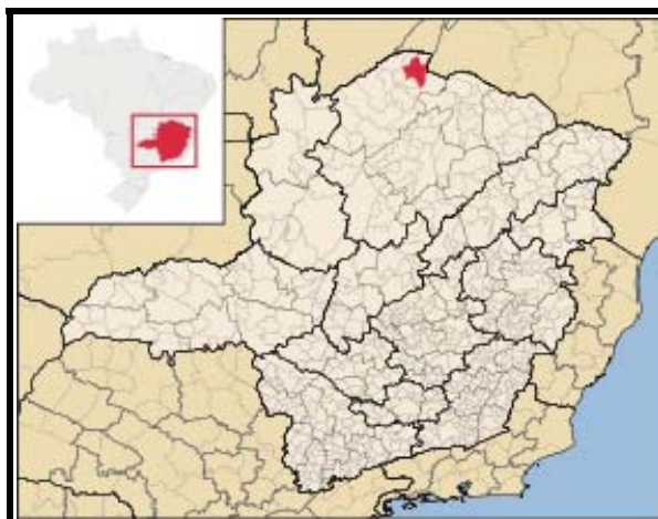
Figura 1 - Localização do município de Manga no estado de Minas Gerais