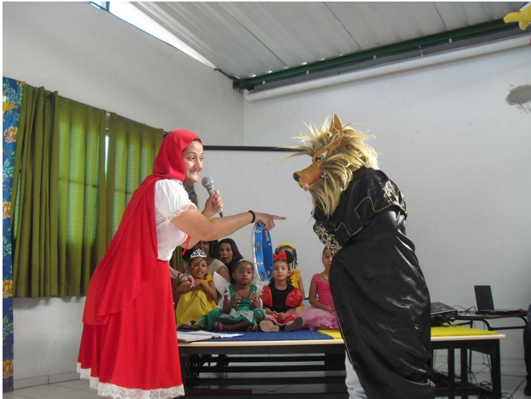
FIGURA 3 – O cordel do chapeuzinho e seu lobo