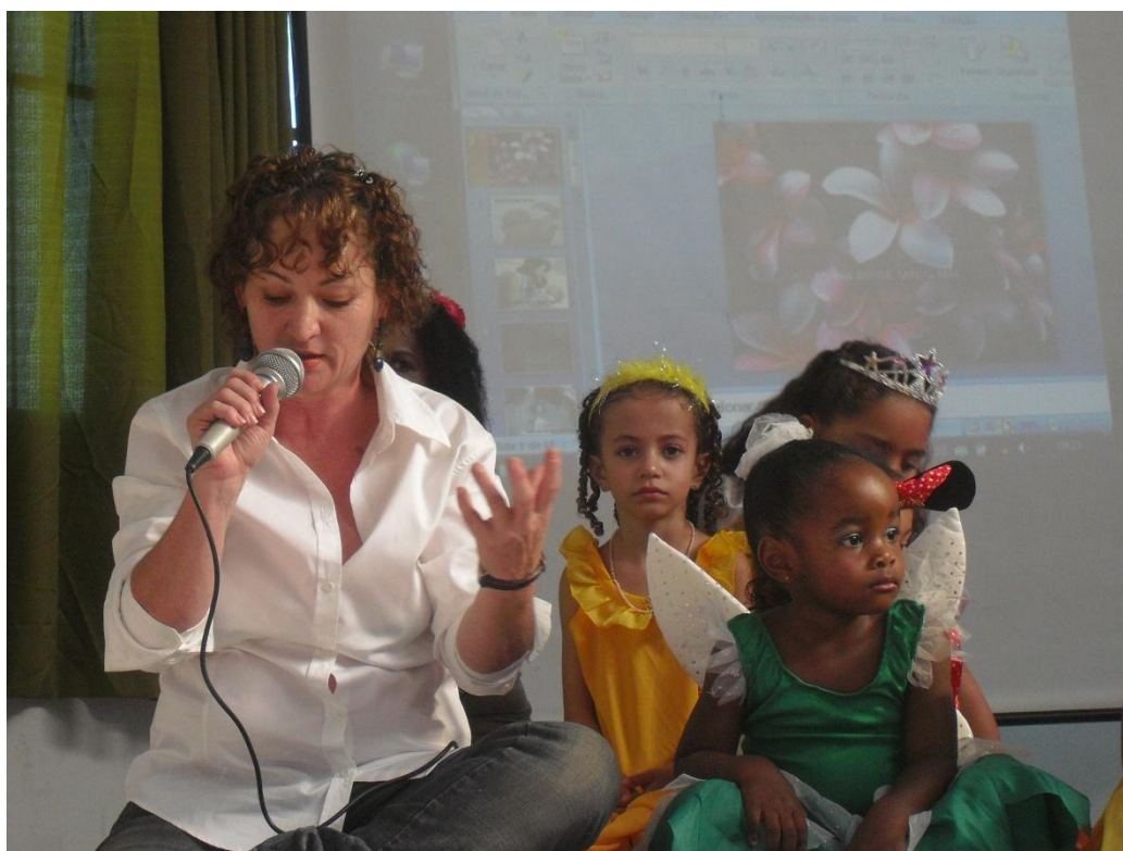
FIGURA 2 – A diretora e as protagonistas do recital de poesia.