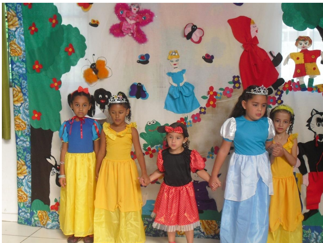
FIGURA 1 – As meninas protagonistas