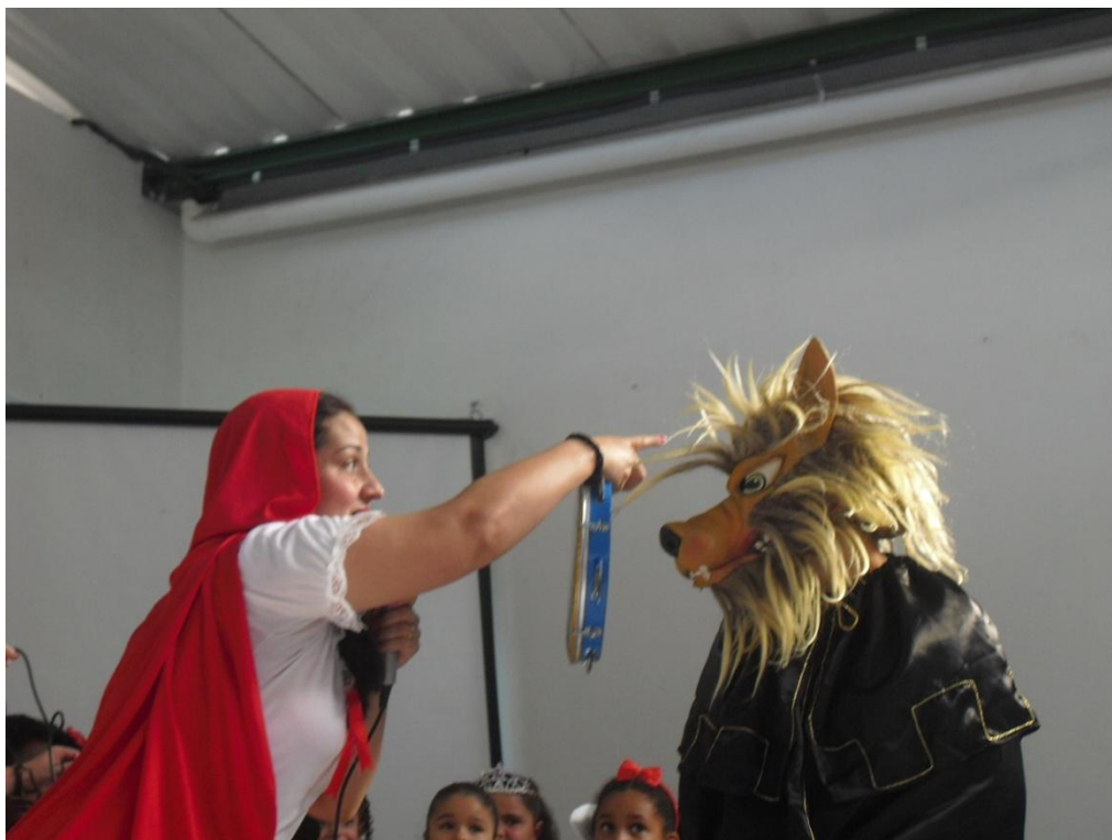
FIGURA 4 – Finalização do cordel – Dia das Mães