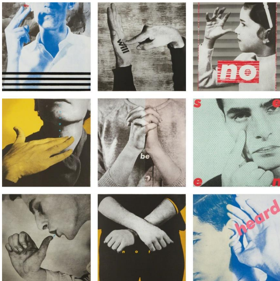
Figura 3 - Untitled (We will no longer be seen and not heard), 1985, Bárbara Kruger

a inserção das palavras we won't sugere uma manifestação contestadora que se opõe ao conteúdo da imagem, pois essa apresenta uma figura feminina em repouso, e não em uma atitude subversiva. Nota-se que a organização compositiva cria uma dualidade ou oposição entre as palavras nature (natureza) e culture (cultura), o que se deve ao fato de elas se encontrarem aumentadas e com as cores das letras e das tarjas invertidas entre si. O destaque dado a essas palavras enfatiza a dualidade que a artista pretende estabelecer entre o gênero feminino e o masculino, os quais são vinculados respectivamente à ideia de natureza e de cultura com a associação do pronome pessoal “nós” a um sujeito feminino e do pronome possessivo “sua” ao masculino (Arruda; Couto, 2011, p. 395-396).