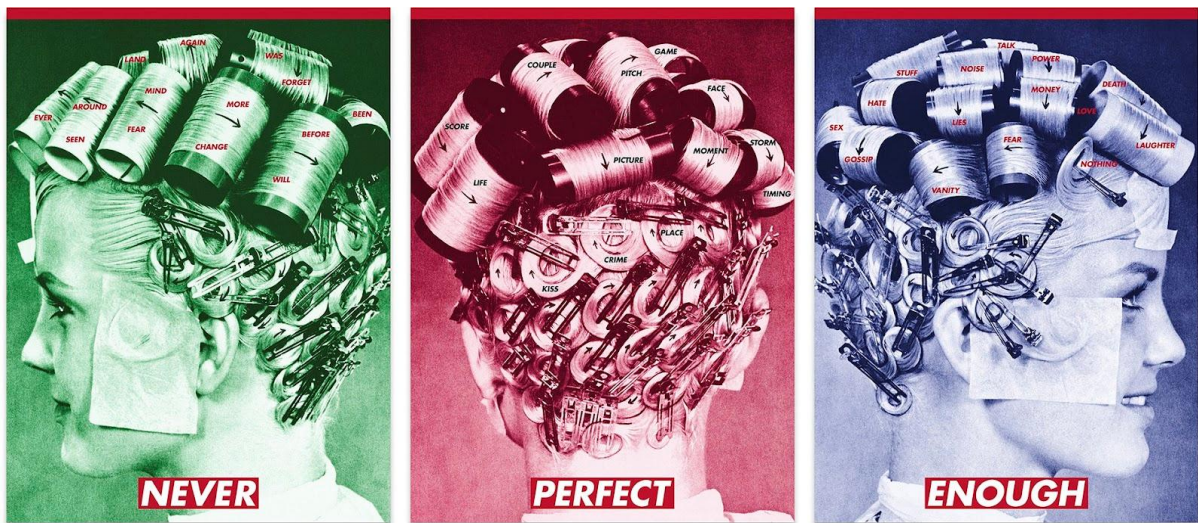
Figura 6 - Untitled (Never perfect enough), 2020, Bárbara Kruger

Algumas das palavras corroboram e/ou ampliam a interpretação da obra, como ‘mind’ e ‘fear’ no mesmo rolo de cabelo da primeira imagem, que a tradução seria algo como ‘medo da mente’, ou como as palavras ‘power’ e ‘money’ em dois rolos diferentes da terceira imagem, mas ligadas por uma seta, que significaria o ‘poder do dinheiro’.