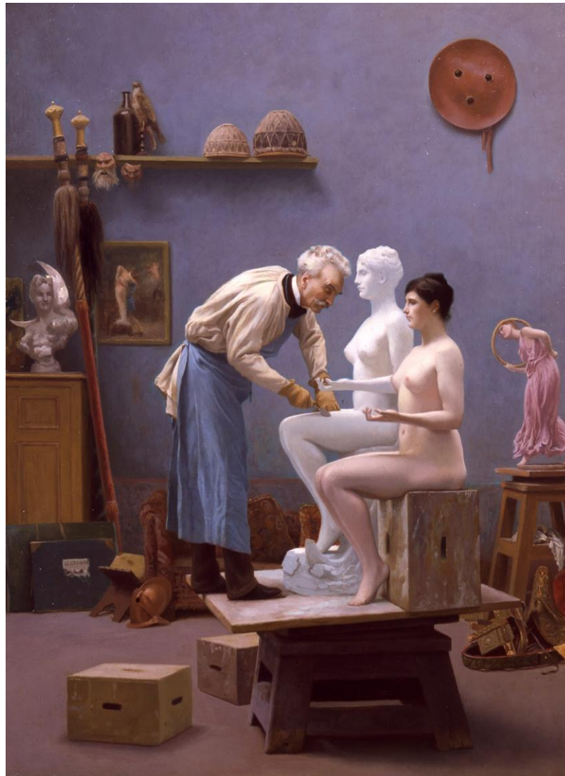
Figura 2 - O artista e sua modelo, 1894, Jean-Léon Gérôme

igualdade total, ou seja, inconsciente, o nu feminino não seria problemático. No nosso mundo, ele é (Nochlin, 2021, p. 1407).