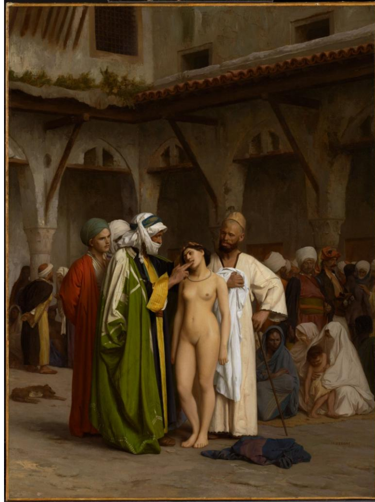
Figura 1 - Mercado de escravos, 1866, Jean-Léon Gérôme

aos corpos (nus) das mulheres, bem como ao lugar de submissão e passividade atribuído a elas. Ambos experimentados com verniz de naturalidade.