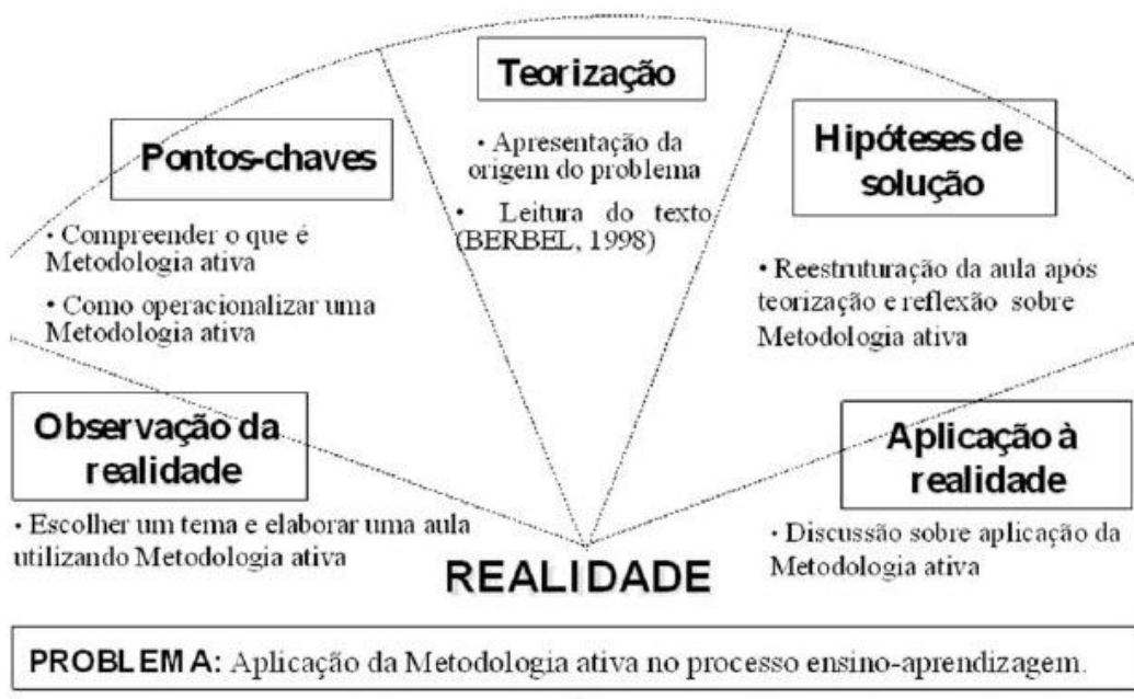
Figura1: Planejamento do Arco da Problematização de Charles Maguerez.

Arco de Charles Maguerez: refletindo estratégias de metodologia ativa na formação de profissionais de saúde, Esc Anna Nery (impr.), 2012 jan-mar; 16 (1):172-177