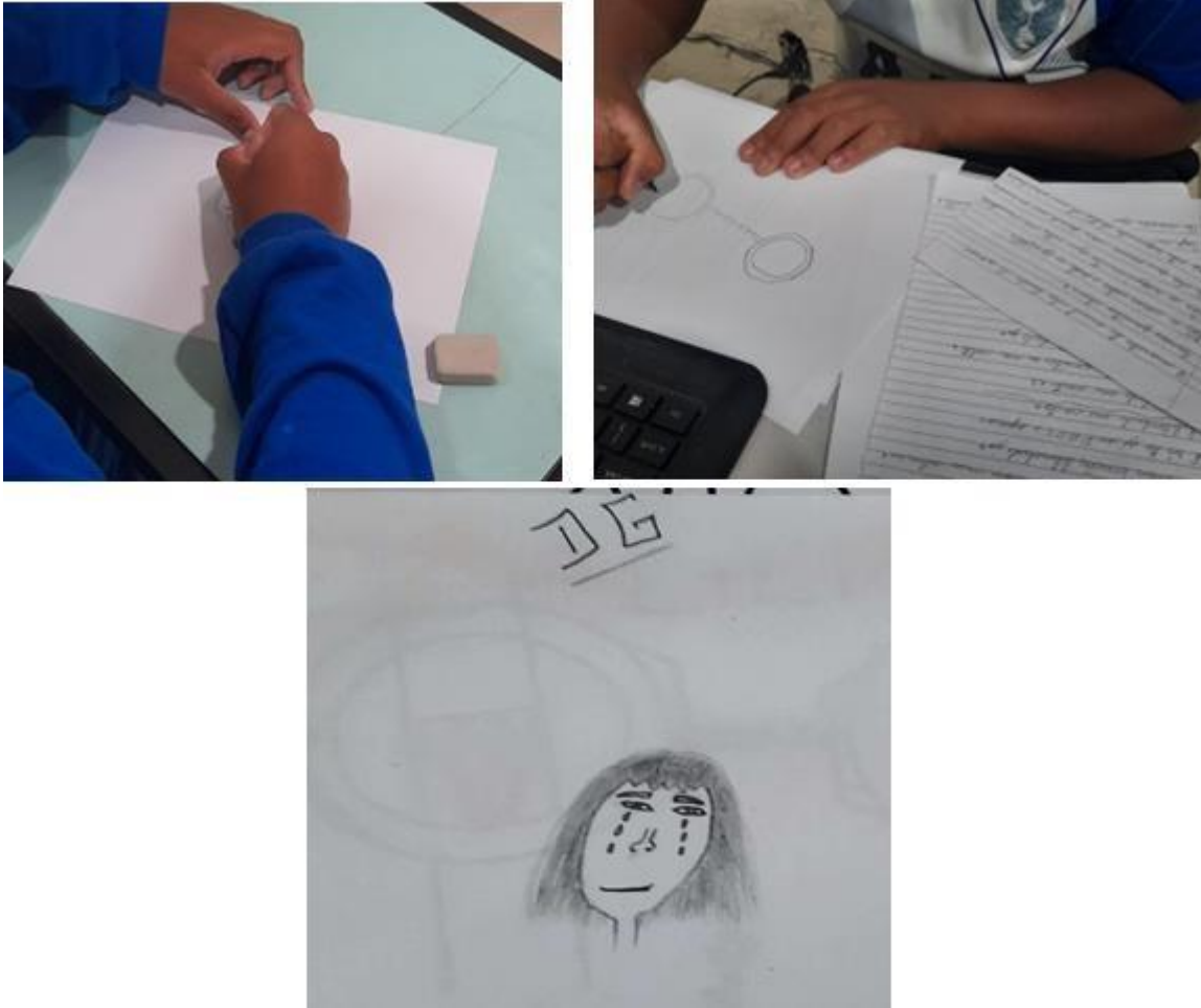
Figura 3 - Adolescente criando desenho - Centro Socioeducativo Lindeia- Belo Horizonte