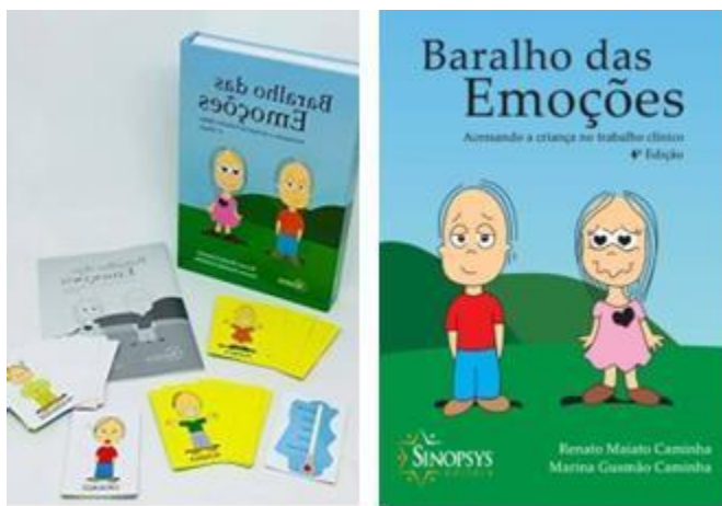
Figura 1: Baralho das emoções usado como atividade para a interação no grupo de adolescentes.

Dentro da dinâmica do jogo, a expressão das emoções naturais do ser humano é um ponto central. Chorar, sorrir, conversar, sentir raiva, sentir medo, ficar inseguro, sentir alegria, entre outras emoções, é normal a qualquer indivíduo em seu dia a dia. Nessa perspectiva, a inteligência emocional é trabalhada como ponto de partida para a organização das emoções e o controle e entendimento delas. Com o baralho é possível trabalhar esses aspectos em jovens.