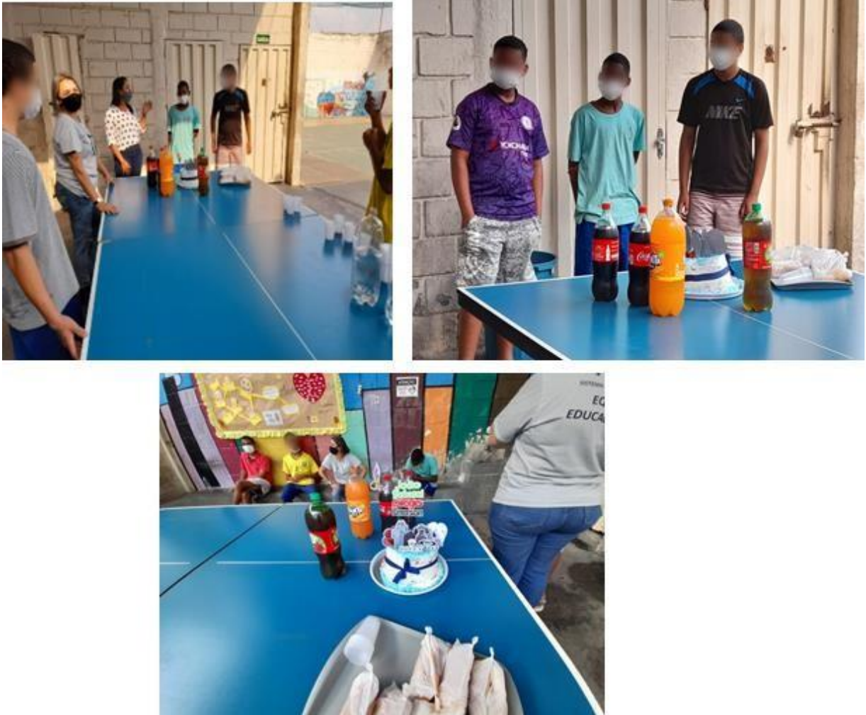
Figura 2 – Comemoração de aniversário no Centro Socioeducativo Lindeia- Belo Horizonte/MG