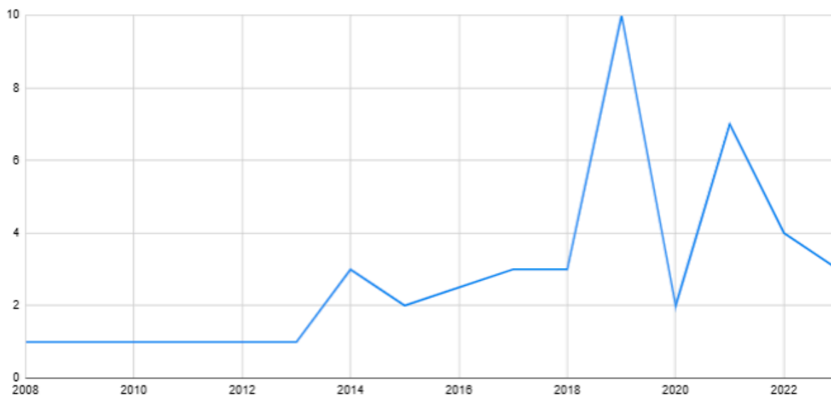
Figura 2. Publicações por ano

Inicialmente, os artigos foram analisados em relação ao ano de publicação e o país dos autores, considerando os 40 artigos analisados observou-se uma média de 3,33 publicações por ano entre os anos de 2008 e 2023, sendo que houve um crescimento no número de publicações anuais a partir do ano de 2019, que registrou o maior pico, com 10 publicações. O número de artigos começa em 2008, o que está alinhado com o fato de que o campo de pesquisa em Psicologia Positiva começou a se estruturar e ganhar reconhecimento a partir dos anos 2000, sendo assim, nos anos iniciais, o número de publicações foi mais esparsa, com apenas uma publicação registrada em cada um dos anos de 2008, 2010 e 2013. O período de 2014 a 2018 mostrou uma leve tendência de crescimento, com uma média de aproximadamente 2,8 artigos por ano, mas foi a partir de 2019 que o aumento se tornou mais evidente. Após esse pico, o número de publicações caiu para 2 artigos em 2020, e nos anos seguintes, o número voltou a crescer moderadamente, atingindo 7 artigos em 2021, antes de estabilizar em torno de 3 a 4 publicações anuais em 2022 e 2023, respectivamente, como pode ser observada na Figura 2.