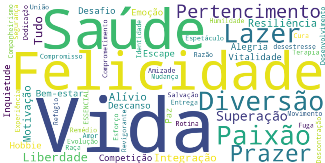
Figura 3. Nuvem de Palavras - Significado do Esporte para Atletas Universitários