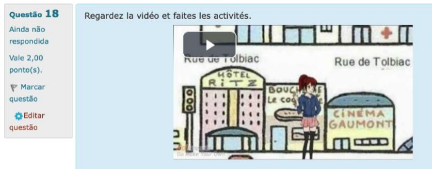
Figura 1. Seção Étude du genre textuel .