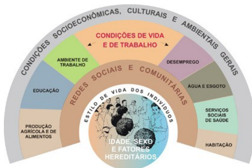
FIGURA 1 – Determinantes sociais de saúde - Whitehead & Dahlgren (BRASIL, 2006)

De Souza e Grundy (2004) e Brasil (2006) alegam que o objetivo da estratégia de promoção da saúde é de fomentar a qualidade de vida, reduzir vulnerabilidade e riscos à saúde. Para tanto, é preciso ações onde haja articulação entre setores para que se possa interferir nos determinantes sociais de saúde: estilos de vida, redes sociais e comunitárias, condições de vida e de trabalho (ambiente de trabalho, educação, produção agrícola e de alimentos, desemprego, água e esgoto, serviços sociais e habitação) e condições sociais, econômicas, culturais e ambientais mais amplas (FIGURA 1).