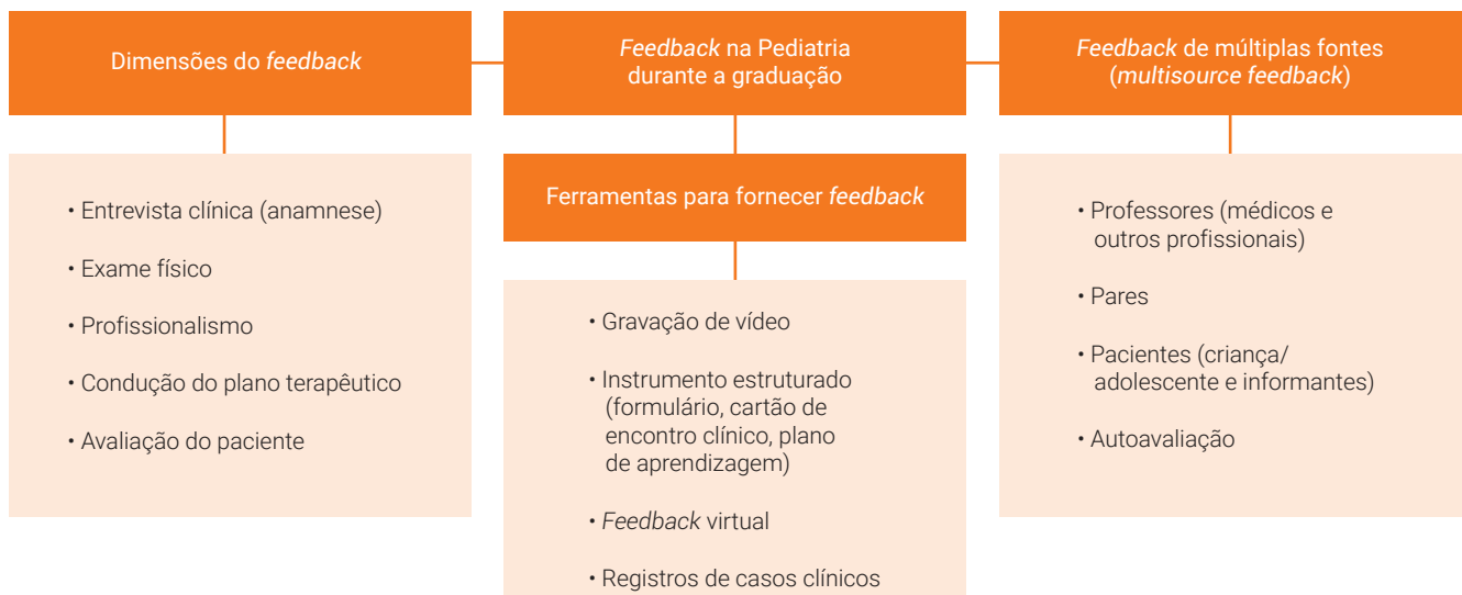
Figura 2. Categorização dos principais resultados da revisão narrativa, Brasil, 2020.

Embora os artigos selecionados tivessem uma grande diversidade de enfoques, foi possível categorizá-los em três grandes áreas (figura 2): 1) Feedback de múltiplas fontes (professores, pares, pacientes e a partir da perspectiva do próprio estudante); 2) Ferramentas úteis para fornecer feedback ( feedback virtual, feedback baseado em vídeo, instrumentos estruturados para o fornecimento de feedback e utilização dos registros de casos clínicos); e 3) Dimensões do feedback .