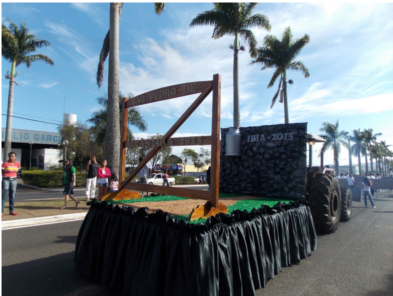
Desfile de 07 de setembro em comemoração aos 90 anos de Ibiá.