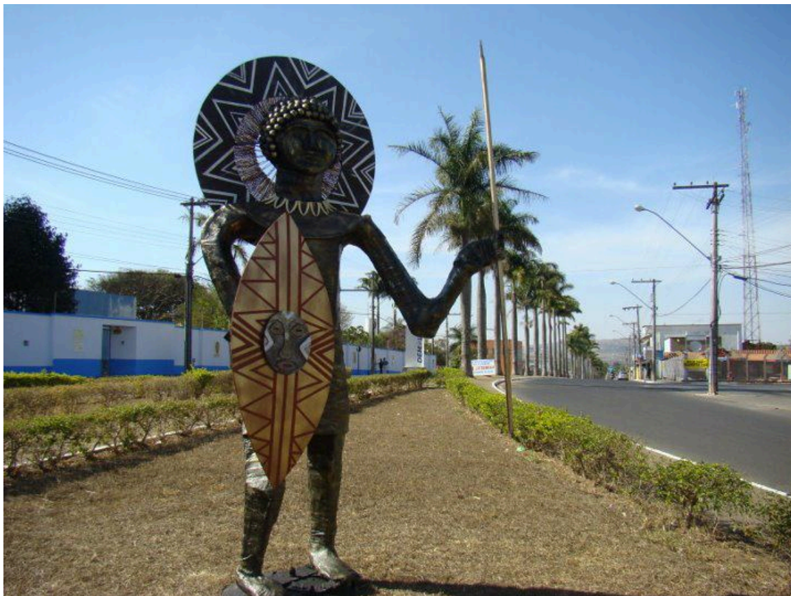
Programa Arte Por Toda Parte - Intervenção Urbana

Todos os anos comemoramos a Independência do Brasil e o aniversário de Ibiá com um animado Desfile Cívico onde os temas homenageiam a cidade, cidadãos, indústrias entre outras, enfim temas relacionados a história da cidade ou mesmo do país. O desfile é organizado pelas secretarias da Cultura e Educação e realizado por profissionais da educação juntamente com os alunos os professores. Os professores e quem desenvolve o tema, constroem os carros alegóricos além de trabalharem o tema com os alunos, já os alunos são os que dão vida ao desfile, pois são eles que desfilam representando o tema trabalhado.