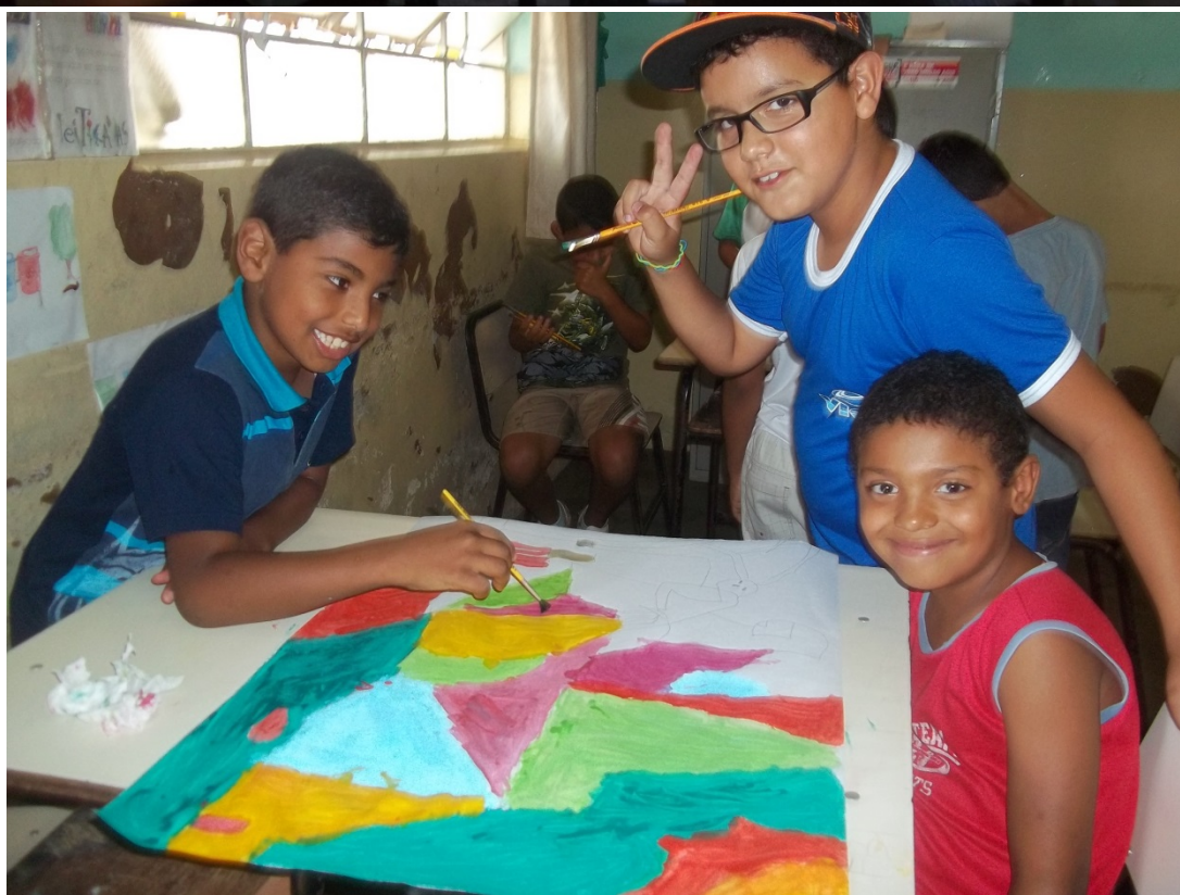
Alunos do 4º ano mediando aula de pintura para o 2º ano