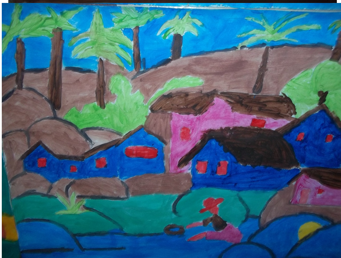
Pinturas realizados por alunos do 2º e 4º ano