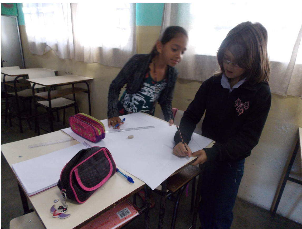
Alunos do 4º ano em processo de criação.

Nesse momento foi proposto aos alunos que fizessem a releitura da obra.