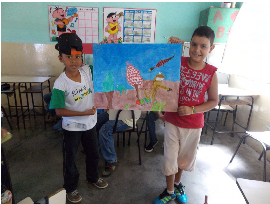
Alunos expõem suas releituras.