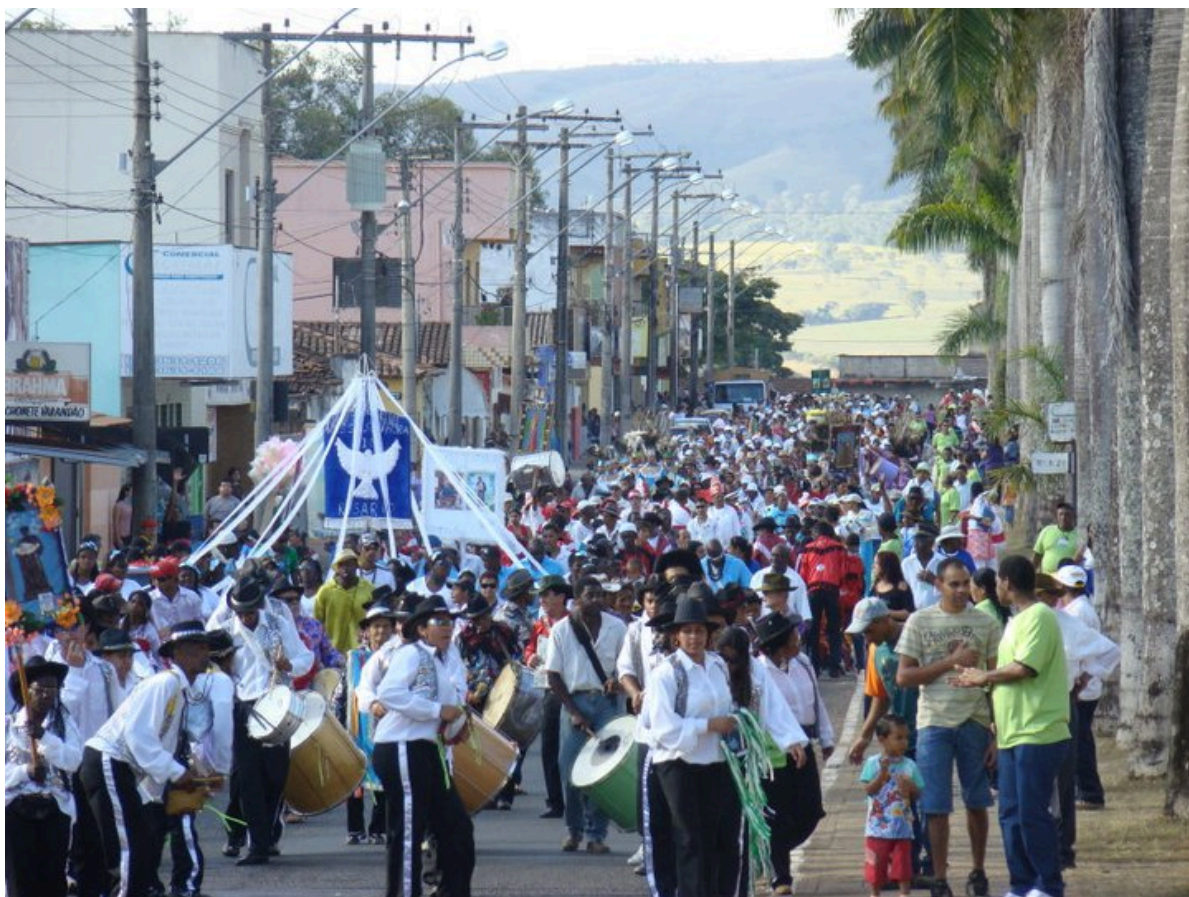
Festa em louvor a São Benedito e Nossa Senhora do Rosário em Ibiá.

E ao falarmos de riqueza cultural do município de Ibiá, não podíamos esquecer-nos das atividades artesanais destacando o bordado, crochê, entalhe em madeira, pintura em tela e tecido e trabalhos em tear, que recebem reconhecimento da população e visitantes pelo seu valor artístico. Aos sábados alguns destes trabalhos juntamente com a saborosa culinária ibiaense é exposta e vendida na feira livre da cidade.