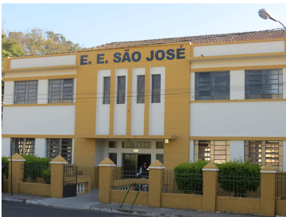
Escola Estadual São José.

O colégio São José foi e é palco de uma educação de sucesso e qualidade e foi neste prédio acadêmico que vários educandos tiveram acesso ao aprendizado escolar, bem como a cultura e a religiosidade que marca a realidade sócio educacional e cultural de Ibiá.