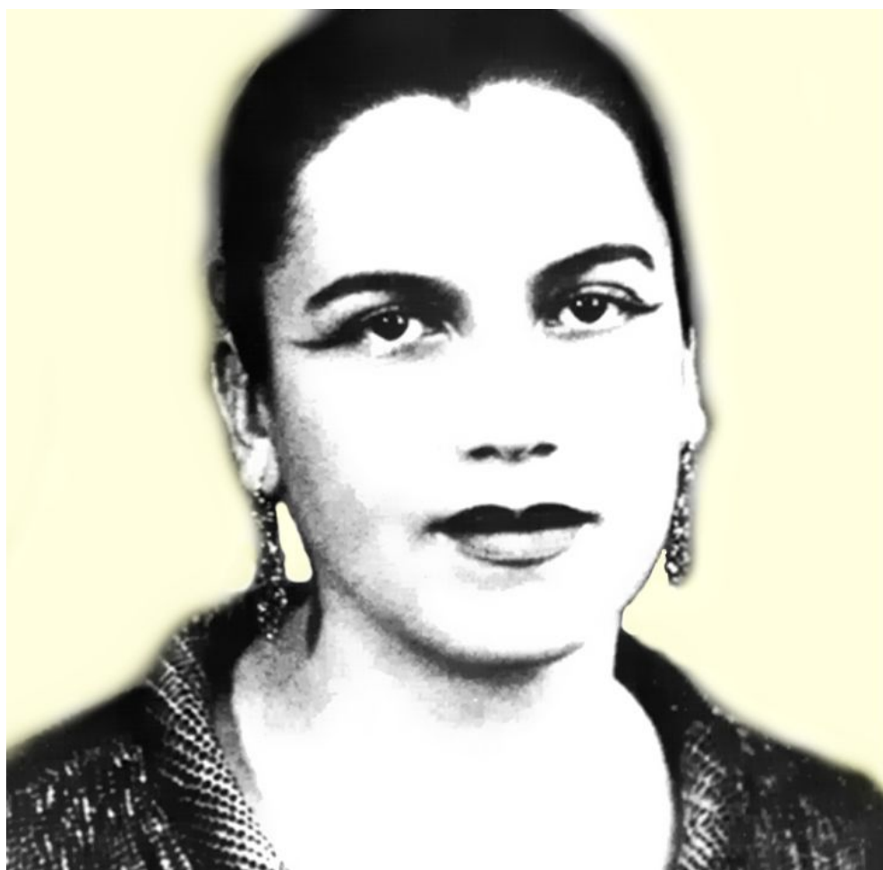
Tarsila do Amaral, Obras De Tarsila do Amaral Tarsila do Amaral 750 x 717 | 36.5KB | www.portalsaofrancisco.com....

Ainda de acordo com os PCNs de Artes ( 1997, p. 110), o professor é um “criador de situações de aprendizagem”. Ele é o mediador, o estimulador, o dosador ou seja é quem trabalha para que as aulas sejam significativas na aprendizagem do educando. É preciso que o educador analise, valorize e incentive o aluno a aprender e a criar e a sensibilizar. O professor é aquele que sabiamente deve conduzir o educando a se encontrar enquanto a aprendiz e a construtor de sua autonomia e a cidadão consciente e produtor de seu próprio conhecimento.