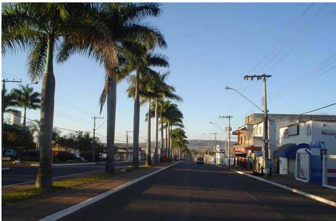
Avenida José Cambraia em Ibiá M.G

Ibiá, uma pequena cidade do Estado de Minas Gerais, está localizada na região do Alto Paranaíba, no centro-oeste do Estado. A cidade conta com uma população de aproximadamente 24.000 habitantes.