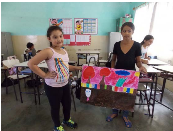
Alunas do 4º ano com uma de suas criações.

E é na escola que o educador deverá articular sua prática de modo a conduzir os alunos a se expressarem através da arte, sem medo de críticas nem de erros mas com o pensamento no ato de ousar, de tentar ser os artistas que esculpem ou pintam suas próprias vidas.