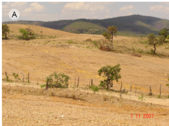
Fotografia 8 – Vista geral da área de exploração de cascalho (A). Vista panorâmica da área de extração de cascalho abandonada (B)