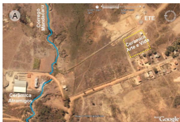
Fotografia 2 – Localização das cerâmicas e áreas de extração de argila em APP do córrego Mandacaru, em Claros dos Poções (A). Rejeitos das cerâmicas dispostos na margem do córrego Mandacaru, causando soterramento do leito, em Claros dos Poções (B)

As áreas de extração de argila estão concentradas em maior quantidade em áreas localizadas em sentido foz da bacia do rio São Lamberto, no município de Claros dos Poções. O mineral de granulometria bem fina é também proveniente da intemperização de arenito Urucuia (STEINER; VASCONCELOS, 2011). A argila é retirada em sistema de cavas em leito e utilizada como matéria prima para abastecimento das cerâmicas do município de Claros dos Poções, não existindo nenhuma medida de contenção dos impactos provocados pela extração do mineral. Para a retirada da argila faz-se a remoção da vegetação ciliar, e interferência direta no curso d'água. Todas as áreas de extração de argila e duas cerâmicas estão localizadas em Áreas de Preservação Permanente (APP) do Córrego Mandacaru, afluente do rio São Lamberto (FOTOGRAFIAS 2 a e b).