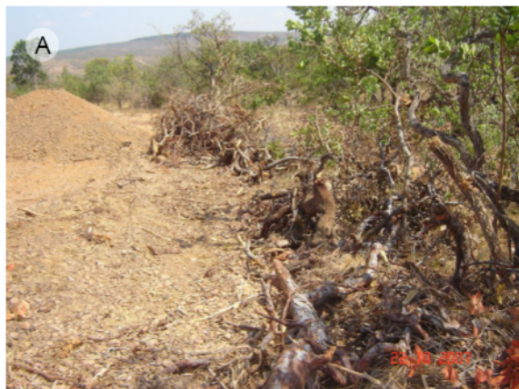
Fotografia 7 – Remoção da vegetação em área de extração de cascalho (A). Remoção da vegetação para extração e empilhamento do quartzo (B)