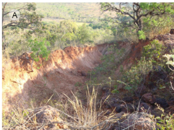
Fotografia 4 – Voçoroca formada abaixo de uma área de extração de areia (A). Cascalheira abandonada apresentando instabilidade de taludes (B)