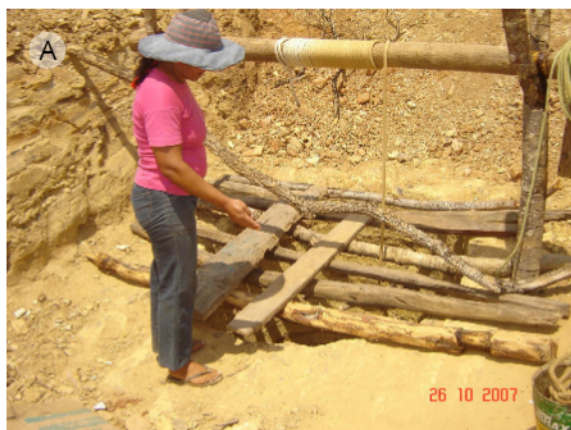
Fotografia 3 – Extração manual de quartzo em sistema de cavas (A) rejeito disposto na área sem nenhuma medida de contenção (B)

área entra em uma complexa cadeia produtiva, passando por diversos atravessadores e seu destino final são as siderúrgicas, que utilizam o minério em seus processos industriais. Na área foram visualizados pontos de desmoronamento e deslizamento de terra para as partes baixas do terreno. As cavas são abertas e abandonadas sem nenhuma medida de recuperação da paisagem (FOTOGRAFIAS 3a e 3b).