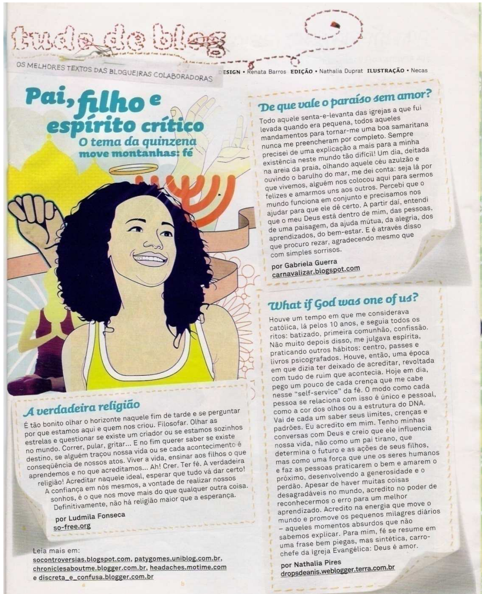
Figura 12: Capricho , 2006, ed. 1031.1

comentários sobre os temas abordados pela revista sejam constituídos de uma personalidade e de um caráter íntimo. A caracterização da seção será apresentada de modo mais detido no próximo capítulo. Neste momento, gostaria de apresentá-la a título de exemplificação genérica desse funcionamento íntimo.