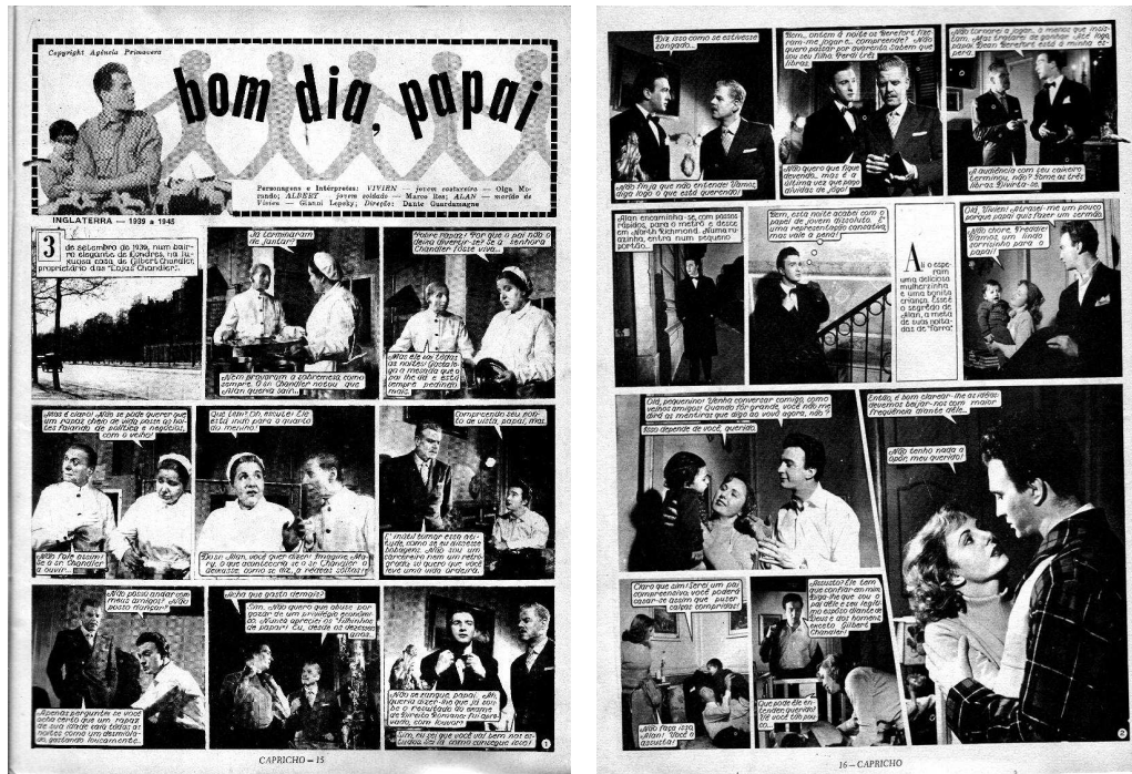
Figura 2: fotonovela Capricho década de 1950

A introdução das cenas seguintes por meio do enunciado do narrador projeta a imagem arquetípica da mulher na posição da passividade, da espera pelo marido. O sufixo de grau diminutivo -inha , responsável, no contexto, pelo processo de derivação do léxico mulher para mulherzinha , auxilia na compreensão dessa passividade feminina. Desse modo, o enunciado mulherzinha aponta para a fragilidade e a disponibilidade da mulher na espera do retorno da figura masculina ao lar, enquanto ela cuida da criança e dos afazeres domésticos. Essa construção do arquétipo feminino da passividade, da maternidade e da domesticidade são (re)afirmadas nas imagens finais. É a mulher que, após o esposo brincar com o filho, coloca-o para dormir.