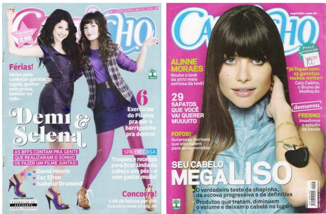
Figura 8: capas Capricho 2008 e 2009

Como se pode observar na figura 8, as capas apresentam personalidades famosas da música pop internacional e atrizes famosas. As chamadas das matérias anunciam temas que são considerados prototípicos ao “mundo feminino adolescente” como truques de maquiagem, beleza, moda, segredos para conquistar os meninos, histórias de amizade, amor e namoros, dicas e truques para emagrecer ou manter o corpo perfeito, bem como anúncios de relatos biográficos de adolescentes.