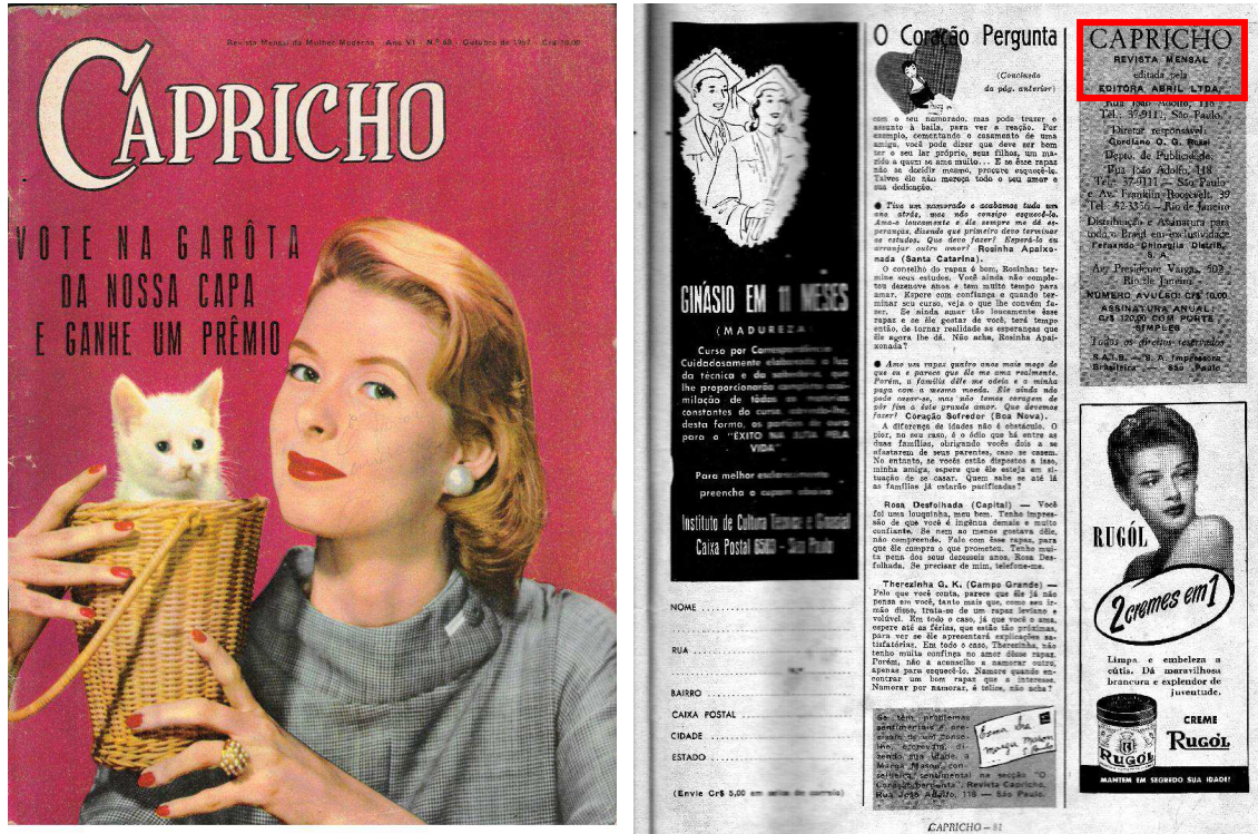
Figura 1: capa e editorial da Capricho década de 1950

mensal para ser quinzenal), observa-se, através do editorial, que, em 1957, a revista mantinha ainda sua periodicidade mensal (destaque da fig. 1).