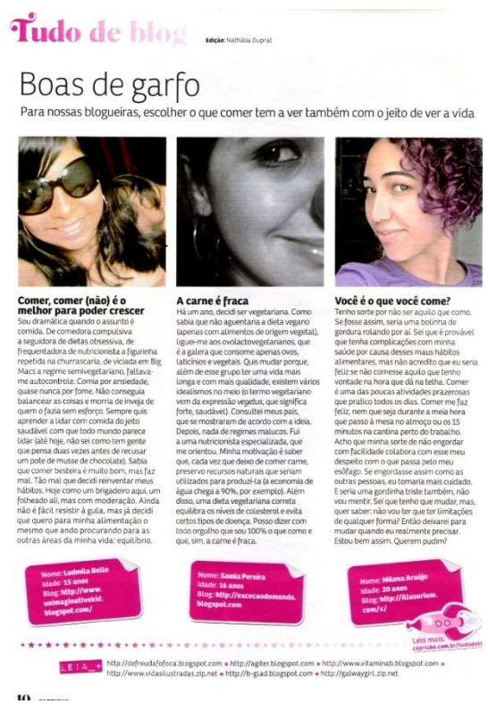
Figura 15: seção Tudo de Blog ed. 1074 Capricho