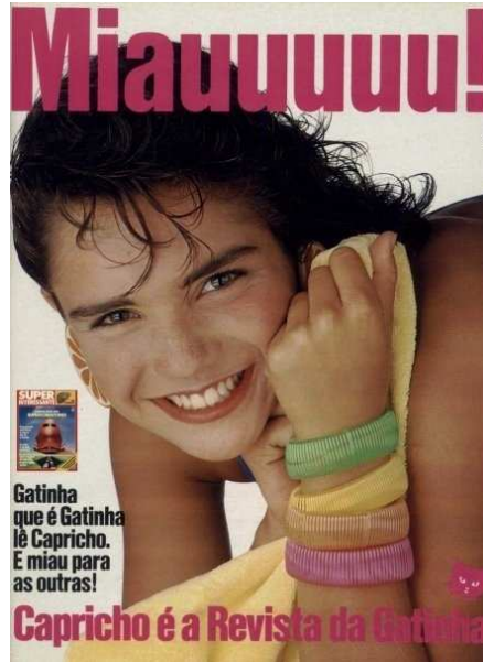
Figura 7: capa da revista Capricho 1985.

A estratégica modificação, com vistas ao reposicionamento no mercado editorial e à recuperação em termos de venda e circulação, desencadeou um redirecionamento da Capricho para um público mais jovem: as adolescentes que “até então não dispunham de um revista feita exclusivamente para elas” (SCALZO, 2004, p. 91). Nesse sentido, ao longo dos anos 1980, conforme aponta Scalzo (2004), a revista caminha para tornar-se a primeira revista para adolescentes entre 12 e 18 anos, com o intuito de atingir as classes A e B. segundo a autora (2004, p. 92), o propósito era fazer uma revista “que se parecesse, em forma e conteúdo, mas com uma amiga da leitora e menos com sua mãe, com sua professora e conselheira”. Nesse sentido, a revista pode ocupar o lugar da amiga ou da irmã, conversando com as adolescentes sobre seus problemas mais íntimos. Foi com esta receita que, nos anos 1990, a Capricho passa a ser a revista mais vendida no segmento adolescente.