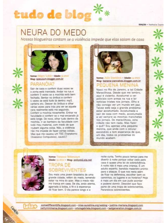
Figura 13: seção Tudo de Blog ed. 1032 Capricho