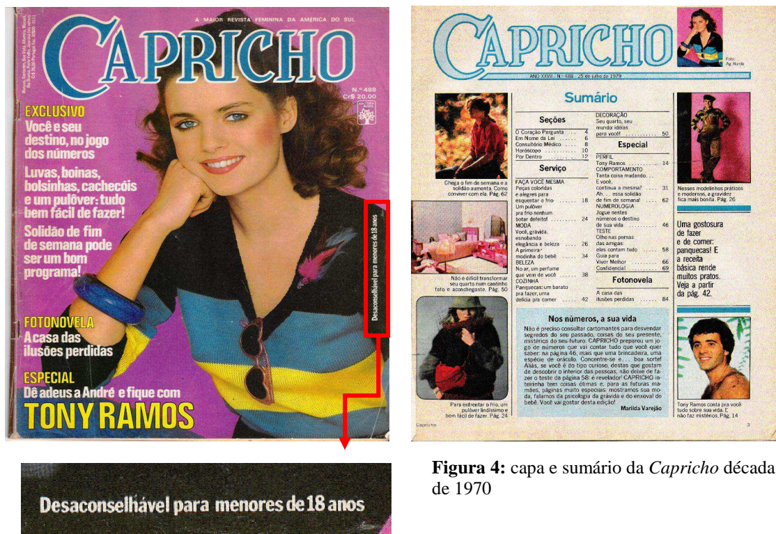
Figura 4: capa e sumário da Capricho década de 1970

A maioria das revistas já estava inserindo em suas páginas outros assuntos, sobretudo os bastidores da TV e, em contrapartida, muitos títulos de fotonovelas já haviam sumido do mercado editorial por não se adaptarem às mudanças ocorridas no público feminino (MIRA, 1997). Com o advento da televisão e das telenovelas, de acordo com Scalzo (2004, p. 90), “a Capricho teve que passar pela sua primeira mudança radical para se manter no mercado”. Essa mudança pode ser observada na edição de 1979, trazida para análise. Nessa edição, é possível observar que a Capricho encerra os anos 1970 com um novo editorial gráfico aliado a uma nova “receita” de revista para mulheres.