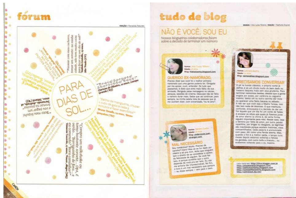
Figura 10: espaço da Capricho para diálogo com as leitoras

internet, o que apontei anteriormente. Através dessas seções é possível observar que, em decorrência do advento da internet, sobretudo dos blogs , a maneira como a comunicação entre a revista e as leitoras foi sendo modificada. De início esse contato se dava somente através das cartas, e a exposição física da mulher leitora ficava preservada. A publicação das fotos das leitoras ao longo das páginas da revista apóia a construção do ethos amigável da Capricho , no qual a aproximação com à leitora se dá no âmbito da afetividade.