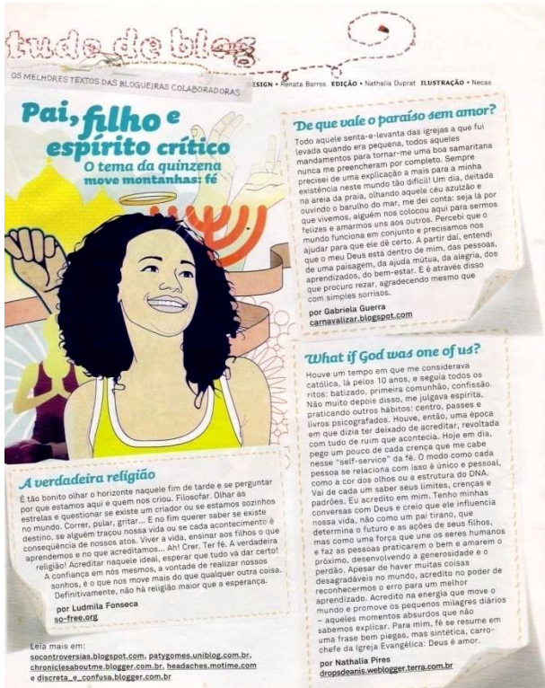
Figura 12: seção Tudo de Blog ed. 1031.1 Capricho

Para iniciar essas reflexões, recortei do corpus quatro seções que servirão de base para a discussão.