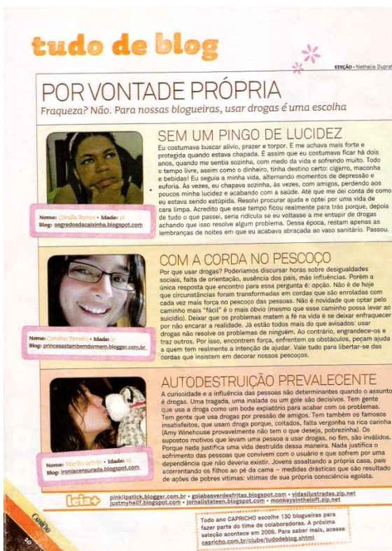
Figura 14: seção Tudo de Blog ed. 1051 Capricho