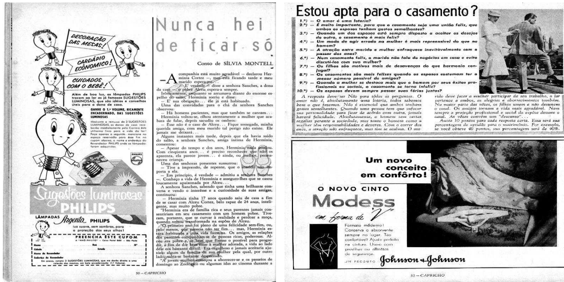
Figura 3: conto amoroso e teste na Capricho 1950

Apontar essas questões revela algumas representações e alguns sentidos de mulheres que circulam no imaginário social e que são recuperadas pelas revistas para que se dê a identificação com o mundo ético das leitoras. Essa construção social da mulher estampada nas páginas da Capricho permitem evidenciar certas representações do universo feminino que historiciza os sentidos de mulher na sociedade.