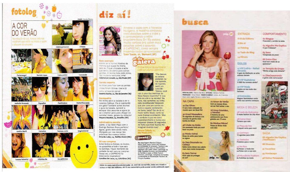
Figura 9: as frutas nas páginas da Capricho

As representações das “mulheres frutas”, por um lado, devido à exposição do corpo e ao apelo sexual, remetem à imagem da “mulher cachorra”. Por outro lado, as representações das frutas no universo da revista Capricho engendram a imagem delicada do feminino que pode associar-se à imagem da “mulher princesa”. Nessa dinâmica, são recuperadas as imagens em torno da mulher, construídas historicamente, nas quais a dualidade do comportamento feminino é posta em contraposição. Dito de outra maneira, essa representação da mulher cachorra versus a mulher princesa tem como base os pré-construídos da mulher bruxa versus a mulher deusa, a dona de casa versus a trabalhadora, a mulher puta versus a mulher santa, pré-construídos esses que são resignificados por uma rede de sentidos que (des)identificam as práticas das mulheres como sendo boas versus más.