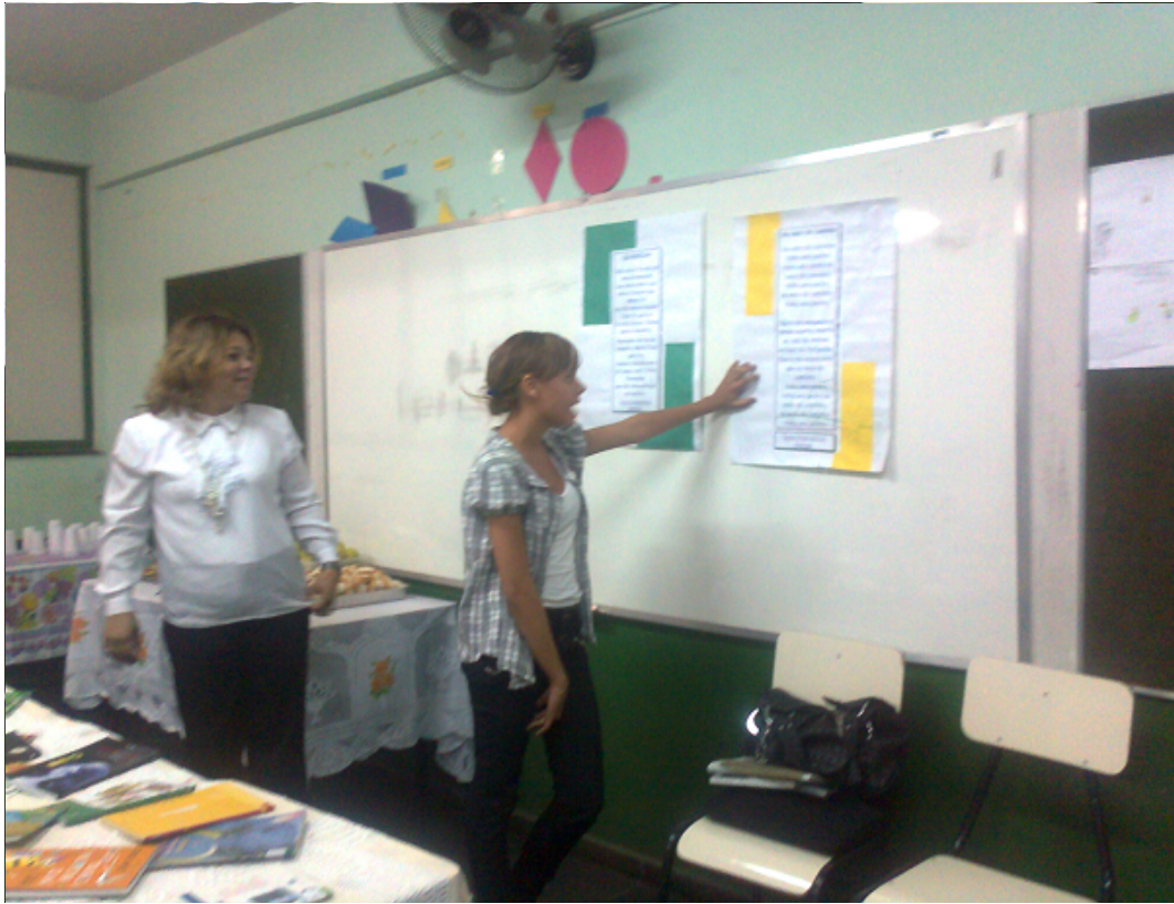
Chá Literário – Compartilhando Leituras