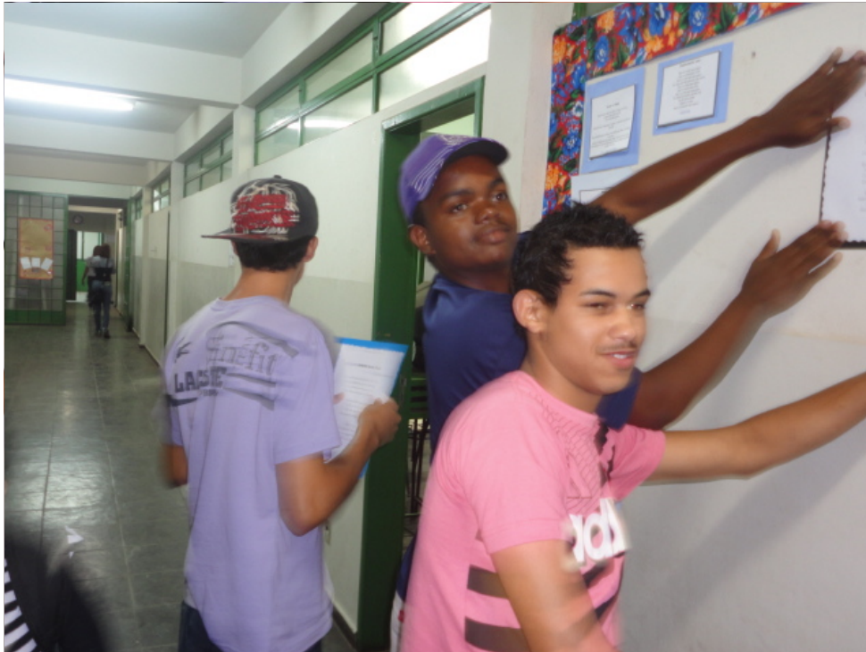
Segunda Ação: Mural dos Poemas - Construção Conjunta