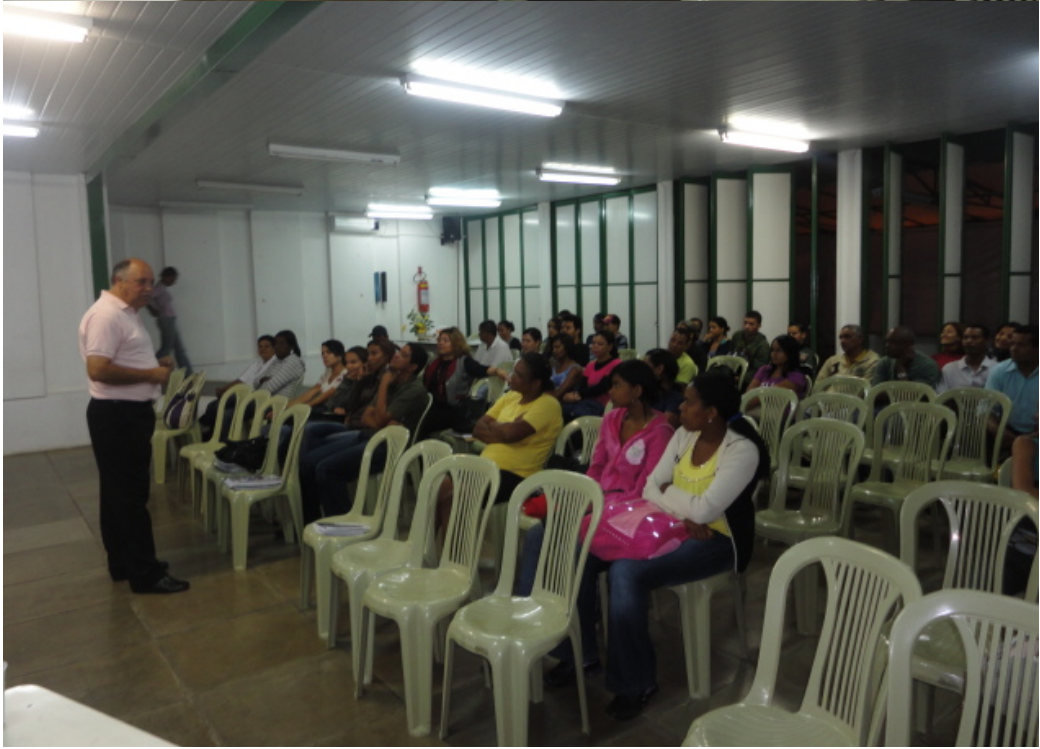
Quarta Ação: Palestra com o escritor Calazans