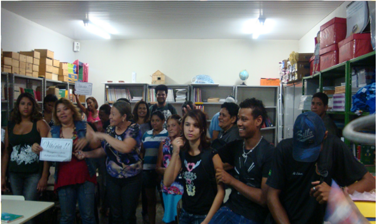
Acesso a Biblioteca: Conquistando o Espaço