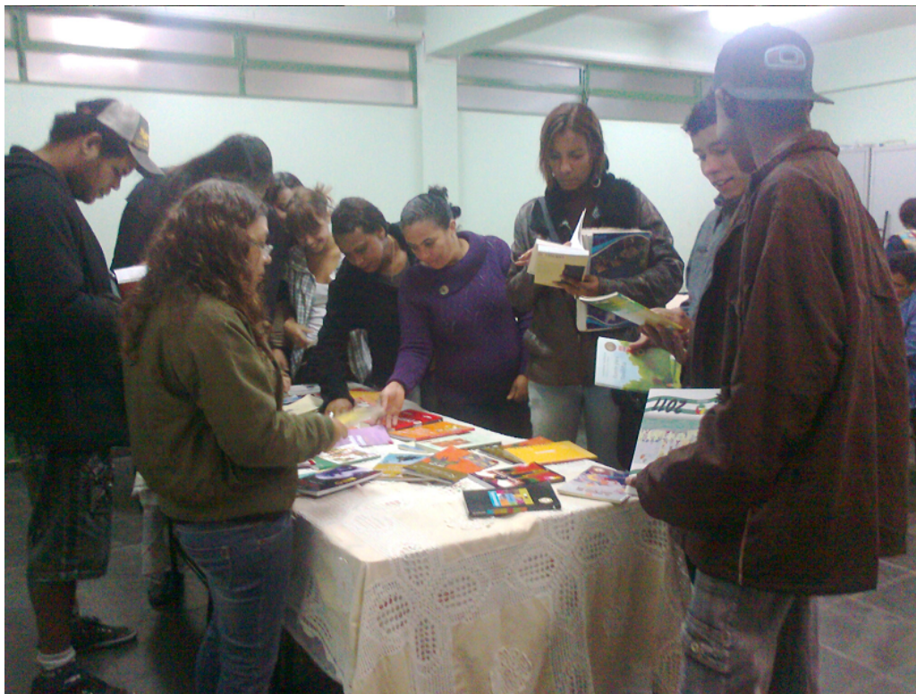
Quinta Ação: Chá Literário – Partilhando Leituras