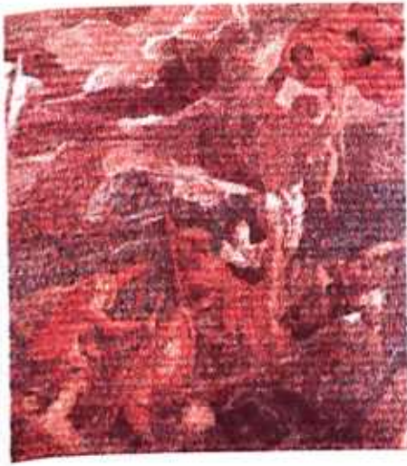
FIGURA 1 (TINTORETTO)