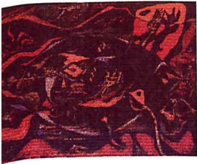
FIGURA 4 (MASSOM)