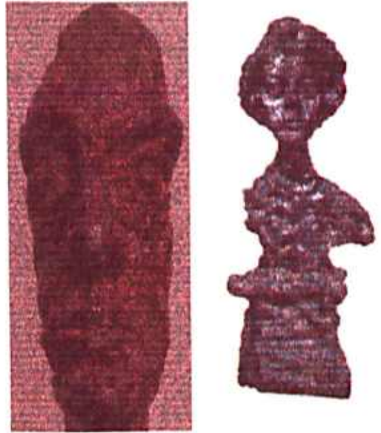
FIGURA 2 e 3 (GIACOMETTI)