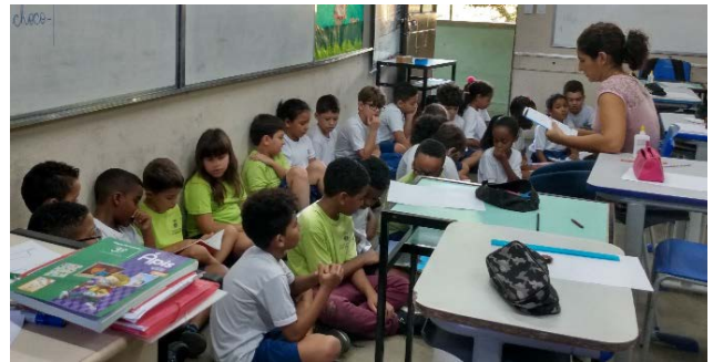
Fotos 4 e 5: 1º dia de leitura do livro: “O Pequeno Príncipe”

Nesse dia lemos os capítulos I, II e III. Todos os estudantes ficaram surpresos com os desenhos feitos pelo narrador da história, alguns até apostaram que fosse uma cobra, mas não com um elefante dentro da barriga. Acharam muito engraçadas as tentativas para se desenhar um carneiro e, como o Príncipezinho usa a sua imaginação ao receber o desenho de uma caixa e imaginar o carneiro dormindo lá dentro. Eles ficaram imaginando um planeta tão pequeno em que o carneiro não precisasse ficar amarrado pois não poderia sumir.