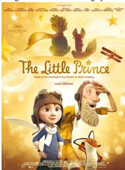
Imagem 4: Cartaz de divulgação do Filme

O filme não é uma adaptação direta do romance de Saint-Exupéry. Em vez disso, elementos da novela são tecidos numa narrativa original sobre uma menina que está lidando com sua mãe insistente que quer que ela cresça rápido demais. A mãe quer que sua filha estude numa escola de renome, e para garantir que sua filha passe na prova de inscrição, lhe impõe um plano de estudo rigoroso para o verão que deixa pouco tempo para o lazer. A menina, no entanto, distrai-se com seu vizinho, um avião aposentado que, ao longo do verão, compartilha com ela a história de um menino chamado "Pequeno Príncipe", a quem ele supostamente haveria encontrado num deserto quando seu avião caíra. A mãe fica furiosa quando descobre a relação dos dois, que estaria supostamente distraíndo a filha de seu importante trabalho, mas a menina continua visitando o Avião pelas costas da mãe. O Avião finalmente conclui a história do Pequeno Príncipe, e a menina fica chateada com o final triste do conto e corta laços com o Avião.