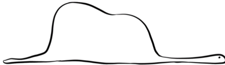
Imagem 2: O desenho 1 do Pequeno Príncipe 2

Diante da escolha e do desejo de lermos o livro até a data da peça teatral, na segunda feira, 29/04 demos início à leitura. Nesse primeiro dia, imprimi o desenho 1 feito pelo Aviador e pedi aos alunos que escrevessem o que eles achavam que o narrador do livro tinha desenhado ali, mas, pedi aos alunos que já conheciam a história para não interferirem na imaginação dos colegas e não falarem nada.