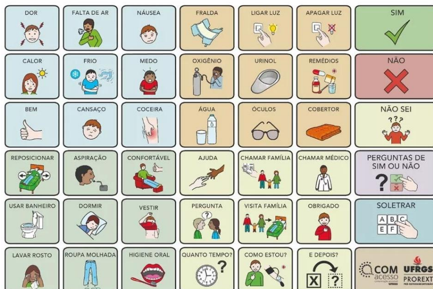
Figura 3 – Exemplo de prancha

Fonte: PICTOGRAMAS. Sérgio Palao – ARASAAC ( http://www.arasaac.org/ )