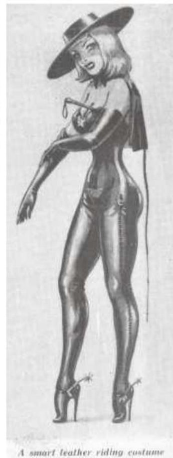
Figura 3: Bizarre 7, p. 32 e 18, p. 29. Uma polêmica sobre botas. Domínio público.

Figura 2: Bizarre 3, p. 16. Exemplo de pinup de J.W. Domínio público.