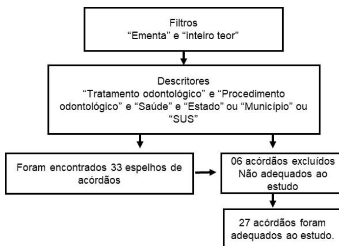
Figura 1. Fluxograma da busca por acórdãos, 2ª instancia, TJMG, julho de agosto/2017

Na estrutura do corpo dos acórdãos foram analisados os votos. Os votos são estabelecidos sempre por uma câmara composta por três desembargadores: o relator (a), o revisor (a) e o vogal, foi analisada, compreendida e interpretada.