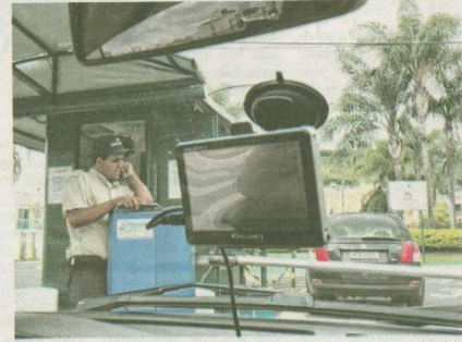
Acesso a parque no Paquetá é restrito a quem passar por controle de condomínio

A fundação explicou que os 18 parques restantes correspondem a espaços ainda em implantação, com obras viabilizadas a partir de recursos do Orçamento Participativo, ou se referem a áreas de preservação ecológica. (TG)