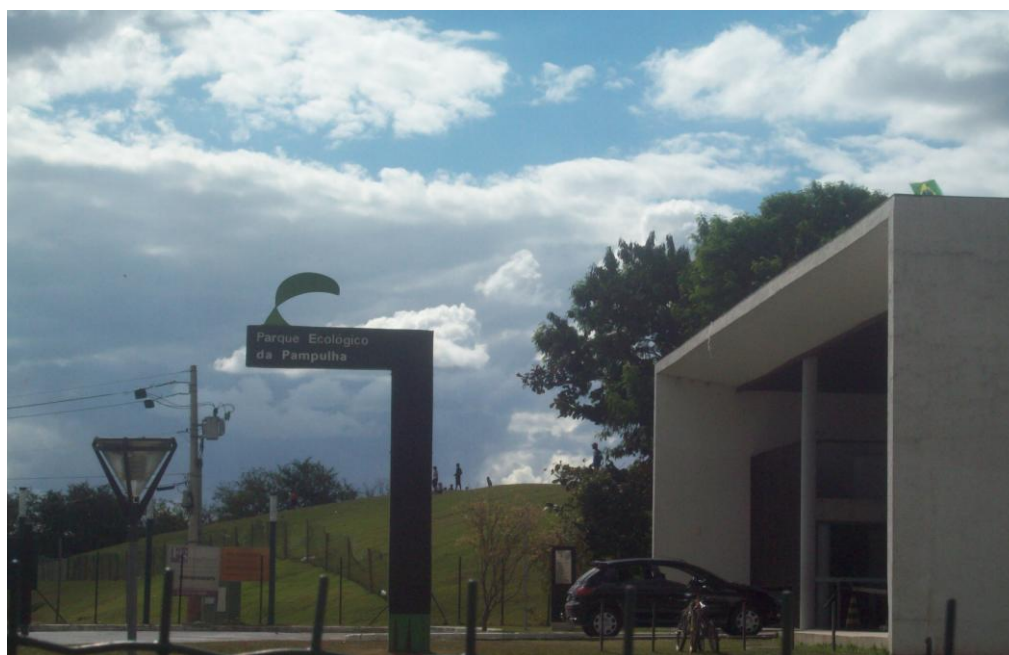
Figura 3 – Parque Promotor Francisco Lins do Rego