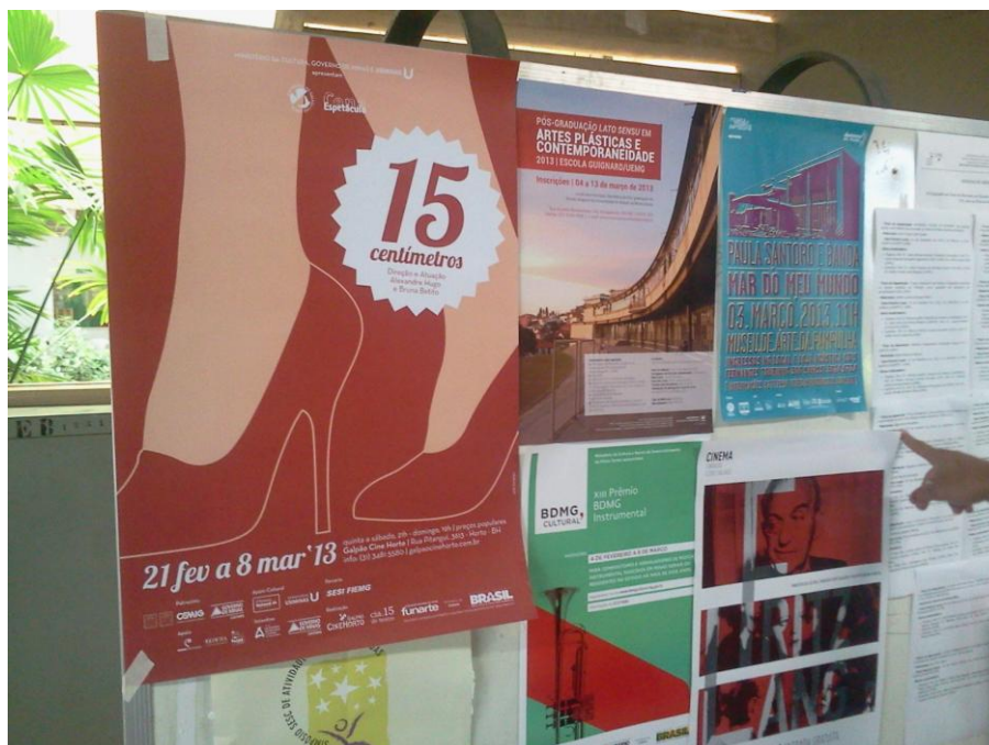
FIGURA 8 – Quadro de Divulgação de Eventos UFMG