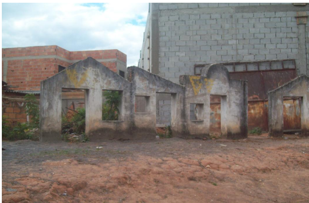
Figura 4 – Parque Maria do Socorro

Pampulha é o Point de correr assim? (G2-P8-M) Nós não costuma ir lá todo dia. Aquela Atlântica eu tenho que passar todo dia ali. Todo dia eu tenho que passar na Amintas Jaques ainda vou correr lá? Ai é meio Ruim eu passo lá todo dia aí lá é novo! (G2-P11-F) Ah lá é bom. Andar de bicicleta lá huum. É bom demais! Todo sábado. Mediadora/Entrevistadora 2 Ah lá na Pampulha é novo? (G2-P8-M) É tipo assim eu não vejo lá direto. (G2-P13-M) Na Pampulha também tem umas paradinhas mais adequadas para correr também. A estrutura para correr é bem melhor. (G2-P9-M) É a estrutura da Pampulha é muito melhor que a daqui da Região entendeu? (G2-P13-M) Os motoqueiro dando tiro. É cabuloso demais. Risadas.