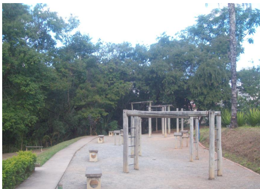
Figura 2 - Parque Ursulina de Andrade Melo