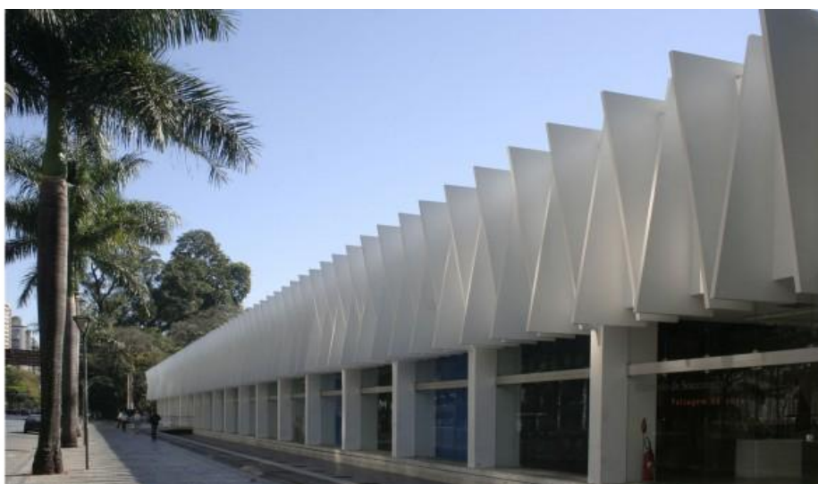
Figura 1 – Palácio das Artes

(G1-P1-M) (...) Achei meio assim parecendo um hospital rapaz (Todos) Risos. Eu tenho um medo de hospital e cês nem sabem como.