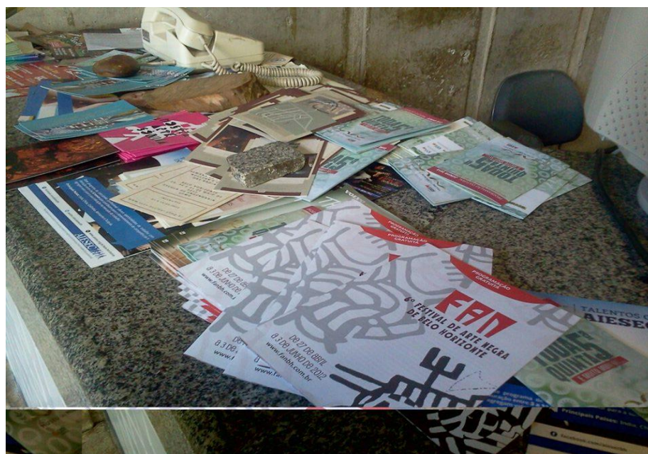
FIGURA 9 – Divulgação de Eventos Balcão EEFTO 2