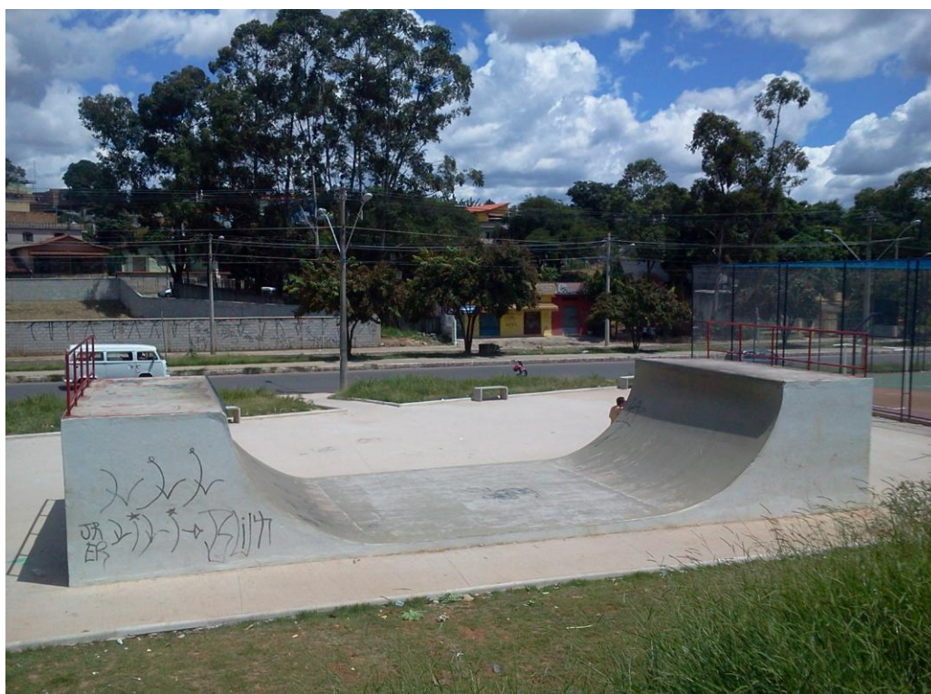
Figura 5 – Pista de Skate Praça do Divino - Contagem

equipamentos de lazer que foram aprovados no Orçamento Participativo, um em fase de Execução – Área de Esporte e Lazer do Bairro São Salvador (NO3) e dois em funcionamento – Ginásio Poliesportivo Dom Bosco (NO3) e Parque Ecológico Vescesli Firmino (P04). Os jovens reclamaram da falta de diálogo da Prefeitura com as pessoas que vão utilizar o equipamento, que nem sempre é construído de forma a atender a expectativa dos usuários. Ambas as pistas de skate poderiam contemplar a prática de duas modalidades bike BMX e skate vertical. Mas no geral os equipamentos são feitos somente para os skatistas. No caso dos Parques Municipais existe um agravante que é o fato de ser proibido entrar com bicicletas dentro dos parques e não existe especificação do tipo de bicicleta.