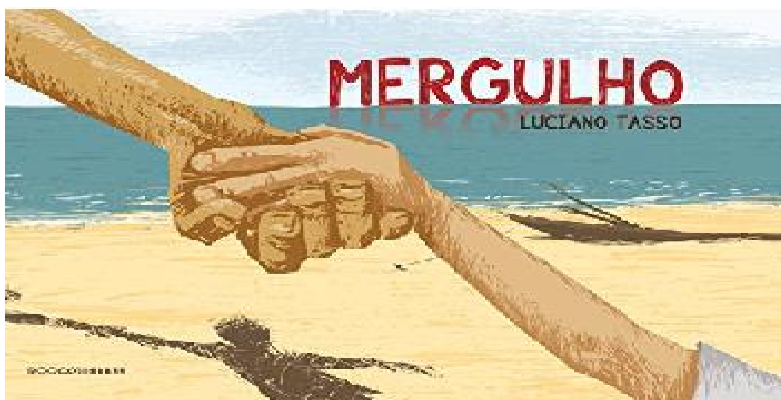
Figura 1 – Capa do livro Mergulho

Após as análises, o livro selecionado foi Mergulho de Luciano Tasso (Figura 1).