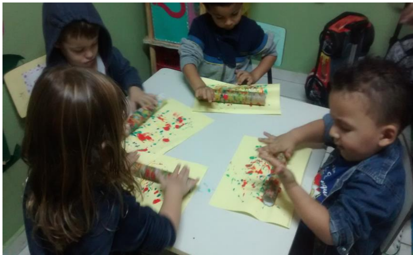
Figura 2 – Atividade de Artes Visuais para crianças de 3 anos

Nesse sentido é necessário que o professor desenvolva uma metodologia diferente, com atividades atrativas, dinâmicas, onde ele possa demonstrar a devida importância do ensino de Artes Visuais para crianças, que para fins deste estudo são as que se incluem na Educação Infantil, isto é, de 0 a 6 anos.