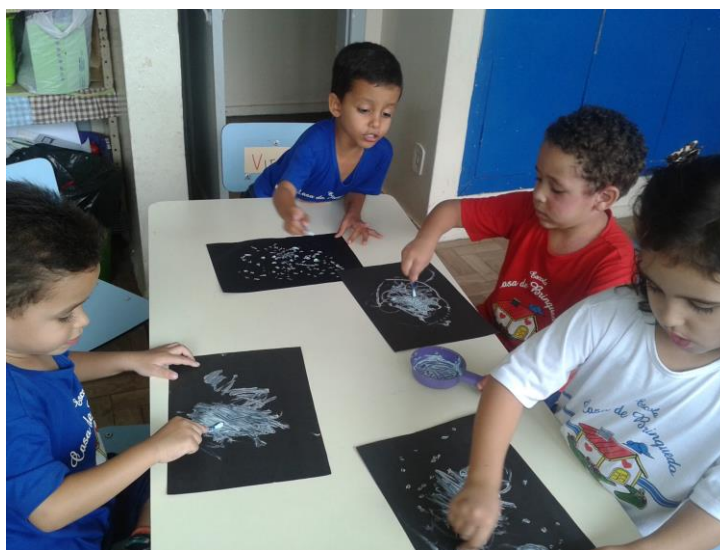
Figura 6 – Pintura com cotonetes e creme dental

Em outro momento foram oferecidos aos alunos durante uma aula, cotonetes, folhas pretas e creme dental. Na ocasião as crianças se divertiram bastante e produziram trabalhos diferentes através de materiais utilizados no seu cotidiano. Dias após esta aula a mãe de uma aluna relatou que no momento em que limpava o ouvido da filha com o cotonete, a criança disse: “ mamãe você sabia que na minha escola o cotonete vira pincel para pintar e o creme dental vira tinta? ”.