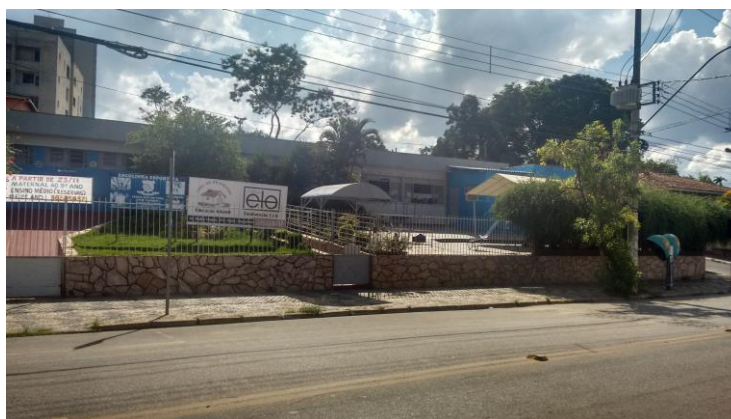
Figura 4 – Fachada Colégio Elo