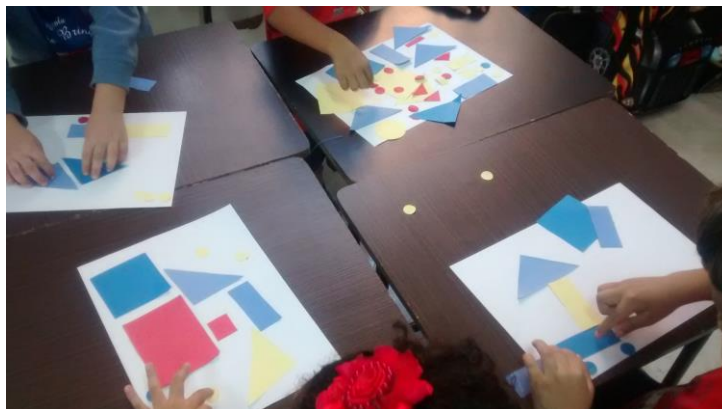
Figura 5 – Artes Visuais utilizando formas Geométricas

diferente do oferecido e buscavam também outras referências como as dos desenhos animados que elas tinham o hábito de assistir na TV. Para as crianças do 1º e 2º período, como não havia uma imagem para “copiar”, elas se sentiam mais livres e deixaram a imaginação fluir.