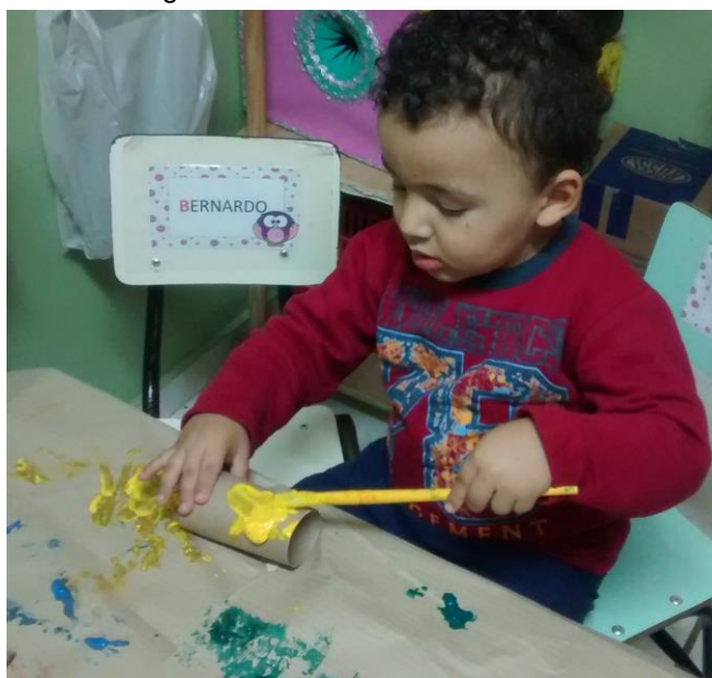
Figura 3 – Artes Visuais Maternal III